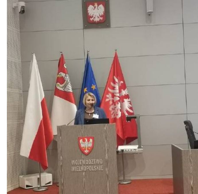
Konferencja regionalna „Rewitalizacja 2.0 w Wielkopolsce”, Poznań, 02.03.2020r.