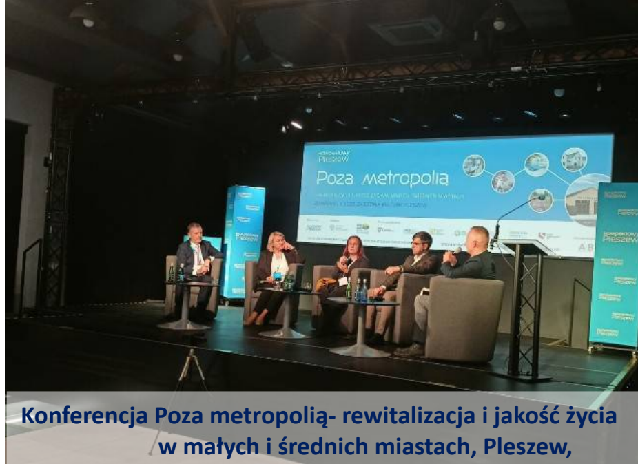
Konferencja Poza metropolią- rewitalizacja i jakość życia w małych i średnich miastach, Pleszew, 26.09.2022r.