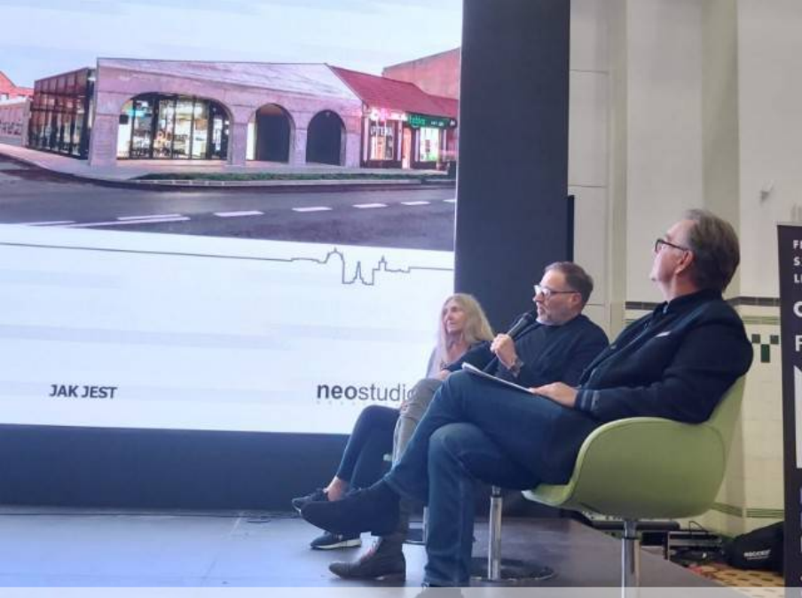
Konferencja Piękno Architektury, Łódź, 22-23.09.2022r.