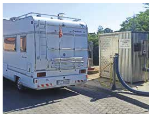
Punkt serwisowy dla kamperów na terenie oczyszczalni ścieków w Wieleniu

Gmina Wielen to miejsce turystycznych możliwości przyciągająca coraz więcej turystów ceniących swobodę i niezależność. Nowoczesne kampery pozwalają