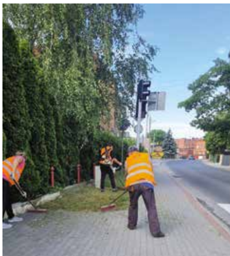
Zajęcia w warsztatach CIS - porządkowanie ciągów komunikacji pieszej na terenie Wielenia