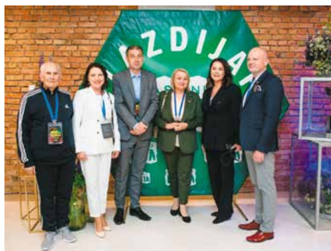
Delegacja Gminy Wieleń z Mer Lazdijai podczas międzynarodowej Pasienio Fiesta, 2-3.06.2023.