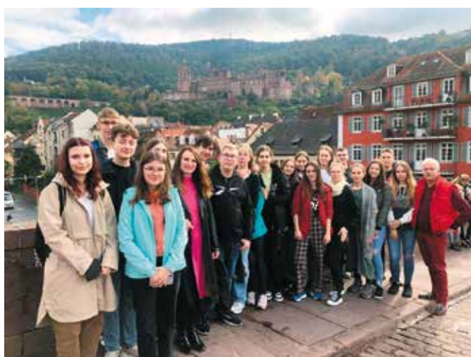
Grupa młodzieży z Zespołu Szkół w Wieleniu podczas wizyty w Homburgu, październik 2022.