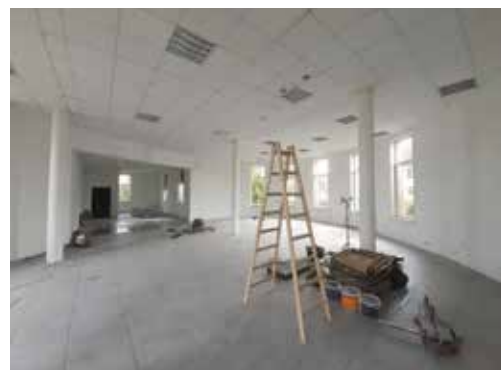
SOWA Wielen w trakcie prac adaptacyjnych

Na ukończeniu znajdują się prace na zadaniu pn. „Przebudowa pomieszczeń filii Biblioteki Publicznej przy SP nr 2 w Wieleniu na Centrum Nauki SOWA”. Zakres rzeczowy robót obejmował adaptację pomieszczeń wraz z ich dostosowaniem do potrzeb montażu eksponatów oraz sprzętu stanowiącego wyposażenie wieleńskiej Strefy Odkrywania Wyobraźni Aktywności SOWA. Wykonano prace związane z: przebudową dachu, warstwami izolacyjnymi, opierzeniami, podejściami instalacji