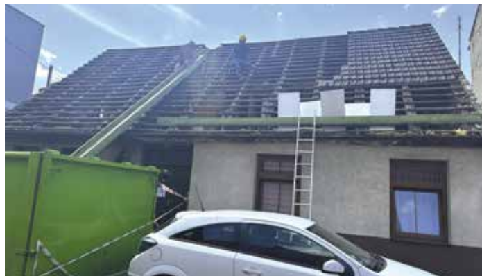
Budynek przy ul. Kasprzaka 10 w trakcie remontu dachu

W związku ze zbliżającym się terminem montowania wkładów żaroodpornych, Administracja Budynków Komunalnych w Wieleniu przypomina o konieczności przestrzegania zaleceń kominiarza. Bez zgody wynajmującego i pozytywnej opinii kominiarskiej nie można samowolnie zmieniać systemu grzewczego w zajmowanym lokalu mieszkalnym. Przypomina się, że w lokalach znajdujących się w budynkach Wspólnot Mieszkaniowych, do zmiany systemu grzewczego, niezbędna jest opinia kominiarza, zgoda współwłaścicieli nieruchomości oraz wynajmującego.