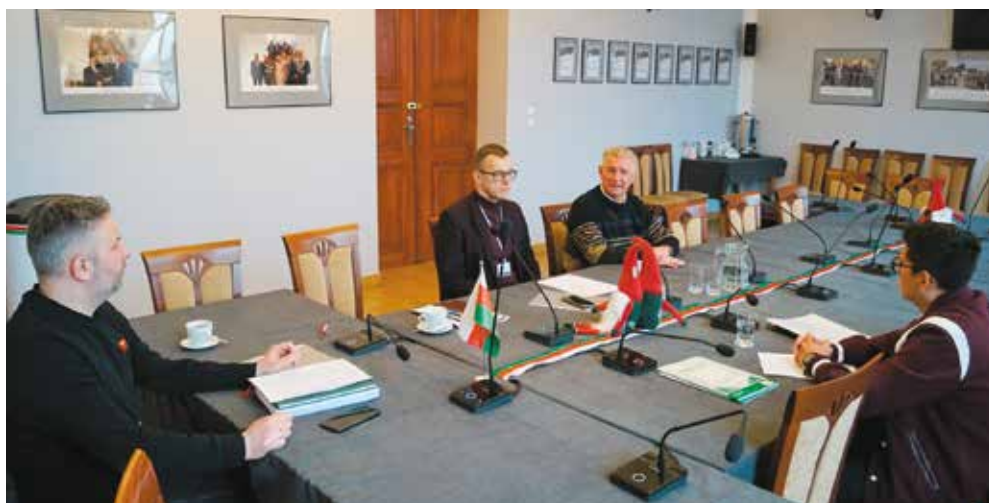
Rada budowy - sieć kanalizacji sanitarnej Aleja Zamkowa w Wieleniu

Trwają prace budowlane dotyczące budowy odcinka sieci kanalizacji sanitarnej na Alei Zamkowej w Wieleniu. W ramach inwestycji wybudowany zostanie kolektor sanitarny o długości 1,133 km, w tym 0,8 km to sieć tłoczna. Zadanie obejmuje również budowę przepompowni ścieków wraz z robotami elektrycznymi, automatyką, ogrodzeniem i oświetleniem. Umowny koszt realizacji zadania to: 1.341.130,50 zł. Inwestycja finansowana jest ze środków subwencji kanalizacyjnej. Ogłoszono postępowanie przetargowe na wyłonienie wykonawcy robót kolejnego etapu zadania.