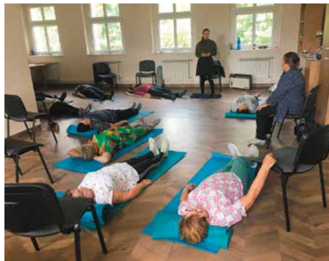
Miejsca tworzą ludzie aktywni ...