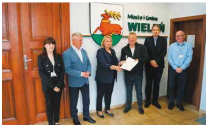
Podpisanie umowy z wykonawcą na budowę slipu

Przeprowadzenie inwestycji jest możliwe dzięki środkom zewnętrznym pozyskanym przez Gminę Wieleń w ramach poddziałania „Wsparcie na wdrażanie operacji w ramach strategii rozwoju lokalnego kierowanego przez społeczność” w ramach działania „Wsparcie dla rozwoju lokalnego w ramach inicjatywy LEADER” objętego Programem Rozwoju Obszarów Wiejskich na lata 2014-2020.