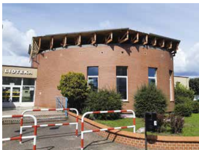
SOWA Wielen widok z zewnątrz w trakcie prac

elektrycznej pod urządzenia, rozbiórką części ścian wewnętrznych, nowymi posadzkami, uzupełnieniami tynków oraz malowaniem