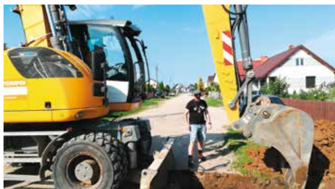
Budowa sieci kanalizacji deszczowej w Rosku w trakcie prac

Zadanie realizowane na podstawie umowy podpisanej z wykonawcą w dniu 17 lutego 2023 r. Zakres rzeczowy pierwszego etapu prac obejmuje wykonanie sieci kanalizacji deszczowej dla układu drogowego w obrębie ulic: Cmentarnej, Studniowej, Tęczowej, Kwiatowej i Jarzębinowej w Rosku. Wybudowany zostanie także odcinek sieci kanalizacji deszczowej wzdłuż drogi Rosko- Rosko Kolonia do rowu melioracyjnego R-3 gdzie zainstalowany zostanie wylot sieci deszczowej wraz z urządzeniami podczyszczającymi wody opadowe. Wybudowana zostanie sieć kanalizacji deszczowej o długości 3,24 km, na trasie której zainstalowanych będzie 85 studni rewizyjnych oraz 140 wpustów deszczowych. Zadanie finansowe jest ze środków pozyskanych przez Gminę Wieleń w ramach Rządowego Funduszu Polski Ład: Program Inwestycji Strategicznych (edycja I). Koszt realizacji robót budowlanych związanych z budową sieci kanalizacji deszczowej to: 7.200.000,00 zł. Dofinansowanie stanowi kwotę: 6.840.000,00 zł, wkład Gminy Wieleń: 360.000,00 zł (5% wartości robót budowlanych). Dodatkowo Gmina Wieleń poniesie koszty nadzoru inwestorskiego