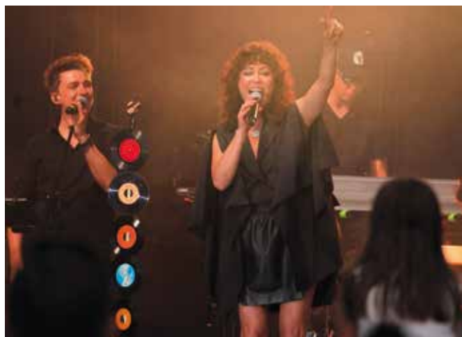
Natalia Kukulska z zespołem - Gwiazda wieczoru „Dni Ziemi Wielieńskiej.” Fot. z koncertu w dniu 16.07.2023 r.