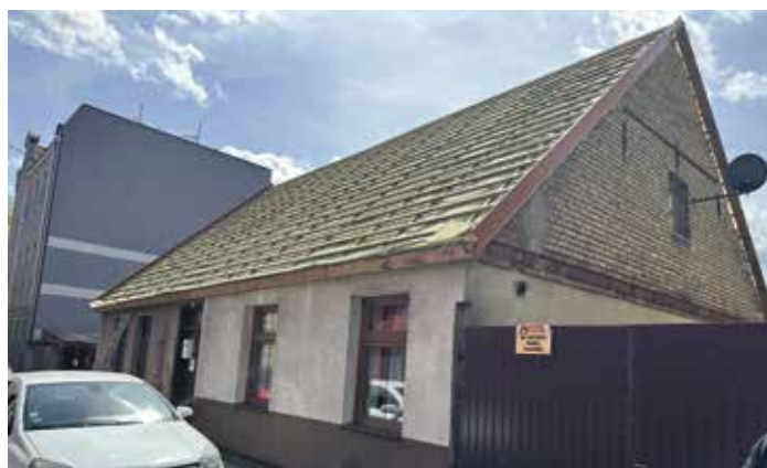
Budynek przy ul. Kasprzaka 10 w trakcie remontu dachu