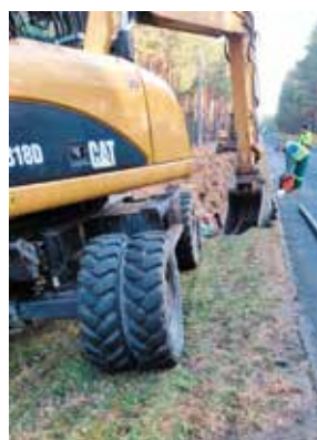
Prace wodociągowe w obrębie sołectwa Mężyk

/Rządowy Fundusz Polski Ład: Program Inwestycji Strategicznych/