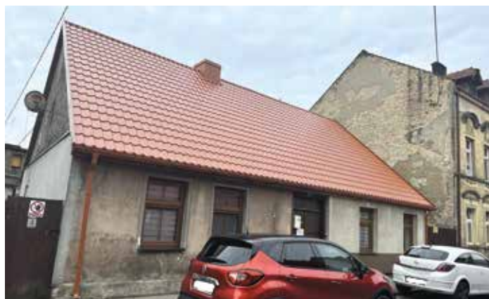
Budynek przy ulicy Kasprzaka 10 po remoncie dachu

Wspólnoty Mieszkaniowe, takie jak: Plac Powstańców Wlkp. 9, Czarnkowska 2, Kościuszki 50, Kościuszki 52, Kościuszki 12, Daszyńskiego 9 w Wieleniu zapraszają zainteresowane firmy do składania ofert na wykonywanie remontów elewacji i dachów w roku 2023/2024. Oferty prosimy składać do siedziby Administracji Budynków Komunalnych w Wieleniu, ul. Lipowa 3.