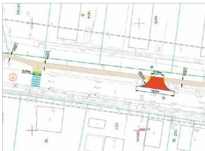
Wyciąg z dokumentacji budowy chodnika przy ul. Jana Pawła II w Wieleniu