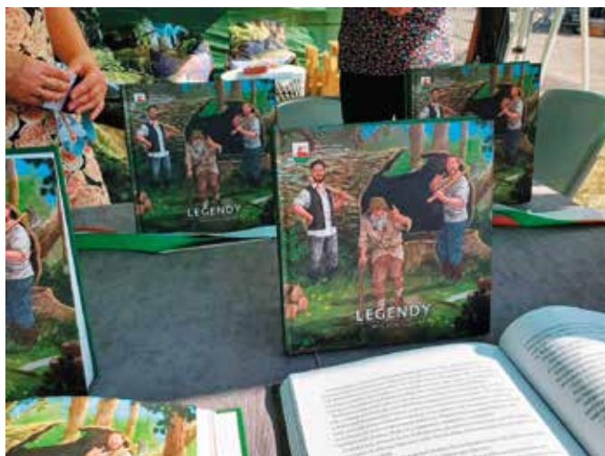
„Legendy Wielkopolski - Mazurzy Wieleńscy z Puszczy Noteckiej” na stoisku Biblioteki XXI w., 16.07.2023 r. w Wieleniu

teckiej 1992 r.” Biblioteka XXI w. działająca w strukturach NCK – przeprowadziła promocję książki pt. „Legendy Wielkopolski”, w tym legendę pt.: „Mazurzy Wieleńscy w Puszczy Noteckiej”. Książka trafi do sprzedaży na początku przyszłego roku. Stoiska prezentowały również Nadleśnictwo Potrzebowice oraz PKO Bank Polski I Oddział w Wieleniu.