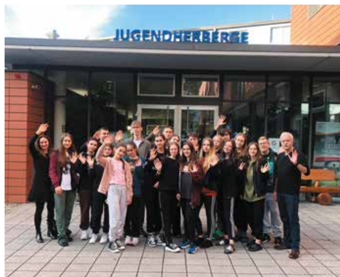
Młodzież z Zespołu Szkół w Wieleniu podczas wymiany - październik 2022

Ważnym etapem rozwoju kadry nauczycieli w ramach projektu Erasmus + była wizyta grupy nauczycieli z Turcji w Zespole Szkół w Wieleniu, aby wzajemnie doskonalić umiejętności informatyczne przy stosowaniu narzędzi IT. Lata 2017-2019 to kolejna inwestycja w doświadczenia, gdzie wspólnie z czterema państwami Słowacją, Włochami, Turcją, Grecją, Zespół Szkół w Wieleniu wygrał projekt „Spielend neues lernen”. Młodzi uczestnicy podczas dwuletniej współpracy stawiali czoła nowym zadaniom, uczyli się samodzielności, wytrwałości oraz radzenia sobie w różnych sytuacjach. Wizyta w poszczególnych krajach partnerskich sprawiła, że młodzież stała się bardziej otwarta na nowe doświadczenia. Kontakty te zaowocowały trwałymi relacjami, które nadal są podtrzymywane poprzez wzajemne odwiedziny, czy prowadzone video- konferencje. ZS w Wieleniu stawia na rozwój językowy, dzięki któremu uczniowie będą mogli w przyszłości korzystać z szerokiego rynku pracy. Coroczne projekty z Paul- Weber Schule Berufsbildungszentrum Homburg z Niemiec, we współpracy z organizacją międzyrządową Polsko - Niemiecka Współpraca Młodzieży (PNWM) poszerzyło ofertę edukacyjną nauki języka niemieckiego. W ramach współpracy międzynarodowej realizowanej przez organ prowadzący Zespół Szkół, jakim jest Gmina Wieleń,