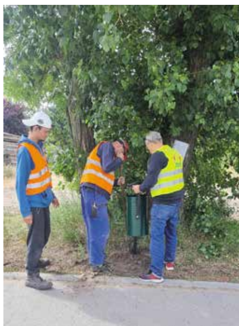
Zajęcia warsztatowe - montowanie kosza na śmieci

zadań zleconych przez osoby prywatne, lokalne firmy i instytucje, w tym największego odbiorcę usług CIS – Gminę Wieleń, obejmuje: