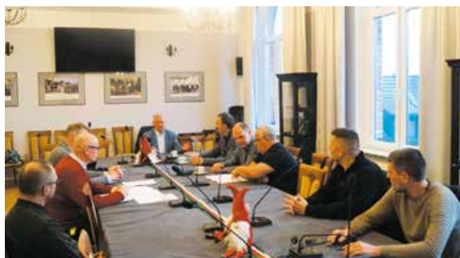
Rada budowy zadania przebudowy dróg na os. Północ w Wieleniu

gram Inwestycji Strategicznych. Koszt realizacji robót budowlanych to: 6.075.000,00 zł, w tym wkład własny Gminy Wielen: 303.750,00 zł, a środki zewnętrzne (Rządowy Fundusz Polski Ład: Program Inwestycji Strategicznych): 5.771.250,00 zł- co stanowi 95% kosztów prac budowlanych. Dodatkowo Gmina ze środków własnych sfinansuje koszt sprawowania nadzoru inwestorskiego w kwocie: 60.270,00 zł.