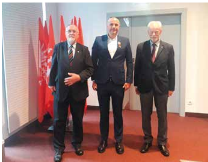
Odnaczony Medalem KEN z członkami Zarządu Głównego TPPW 1918 - 1919