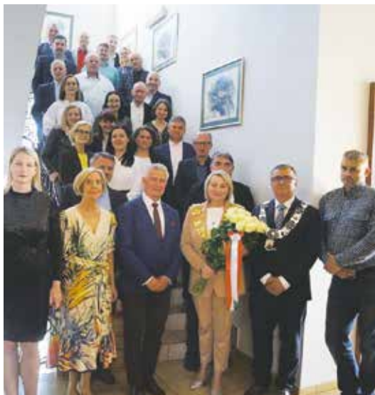
XXXI Sesja Rady Miejskiej w Wieleniu

Omówione zostały sprawy związane z wykonaniem budżetu za rok 2021, w szczególności: Sprawozdania finansowe za 2021 rok,