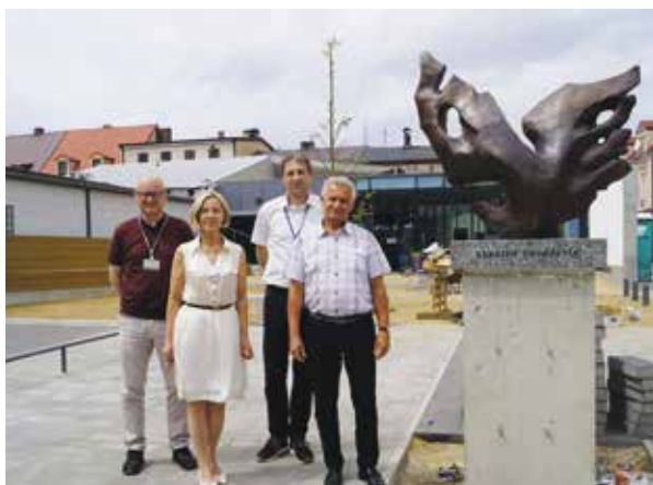
Wielen. Przystanek Edukacja. Montaż rzeźby „Noteckie Skrzydła”

Na Przystanku Edukacja zamontowano rzeźbę „Noteckie Skrzydła”. Niesie ona przesłania takie jak: docenianie aspiracji edukacyjnych i artystycznych, osiągnięcie