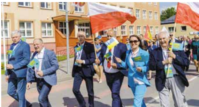
Litewskie Święto z udziałem delegacji Gminy Wieleń