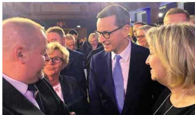
Spotkanie z Prezesem Rady Ministrów Mateuszem Morawieckim