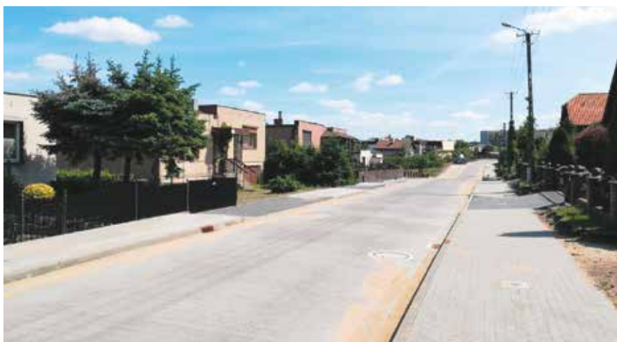
Ulica Bukowa po zakończeniu prac nawierzchniowych

zana była do unieważnienia postępowania. W drugiej procedurze przetargowej złożone przez wykonawców oferty przekroczyły znacznie budżet przeznaczony na realizację zadania. Dzięki działaniom Gminy Wieleń oraz innych jednostek samorządu terytorialnego przedłużona została ważność udzielonych promes dofinansowania. Dzięki temu Gmina Wieleń będzie mogła ogłosić kolejne postępowanie przetargowe na przełomie lipca i sierpnia br. Trwa także poszukiwanie dodatkowych źródeł finansowania zadania. W przypadku wyłonienia wykonawcy prac zadanie realizowane będzie w latach 2022 - 2024. Rzeczowy zakres prac obejmuje wykonanie nawierzchni ulic, chodników oraz kanalizacji deszczowej w obrębie ulic: Cmentarna, Studniowa, Tęczowa, Jarzębinowa i Kwiatowa w Rosku. Na realizację za-