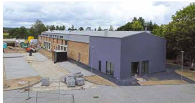
Mediateka w budowie, czerwiec 2022

Od 2017 roku przy szkole tętni życiem nowoczesna Hala Sportowo - Widowiskowa, która jest atutem miasta i placówki. Zajęcia wychowania fizycznego odbywają się w pełnowymiarowej hali z infrastrukturą pozwalającą na organizację zawodów sportowych wysokiej rangi, imprez kulturalno - oświatowych, koncertów, uroczystości szkolnych. Obiekt otoczony parkiem ze starodrzewem.