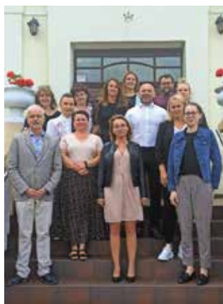
Rada Pedagogiczna rok szkolny 2021 - 2022

uczniów), kurs młody Webmaster (15 uczniów), kurs w zakresie grafiki komputerowej (30 uczniów), kurs z CISCO, kurs JAVA, kurs obsługi wózka widłowego (16 uczniów), kurs na prawo jazdy - kategoria B (16 uczniów), kurs projektowania dostaw, kurs „Infrastruktura magazynowa”