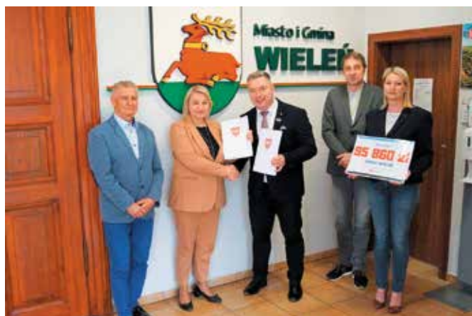
Podpisanie umowy dofinansowania na przystań wodną Łazienki w Wieleniu

Zgodnie z wymogami konkursu - przed złożeniem wniosku o dofinansowanie - Gmina Wieleń wyłoniła wykonawcę robót budowlanych. Podpisanie umowy dofinansowania z Samorządem Województwa Wielkopolskiego umożliwiło rozpoczęcie za-