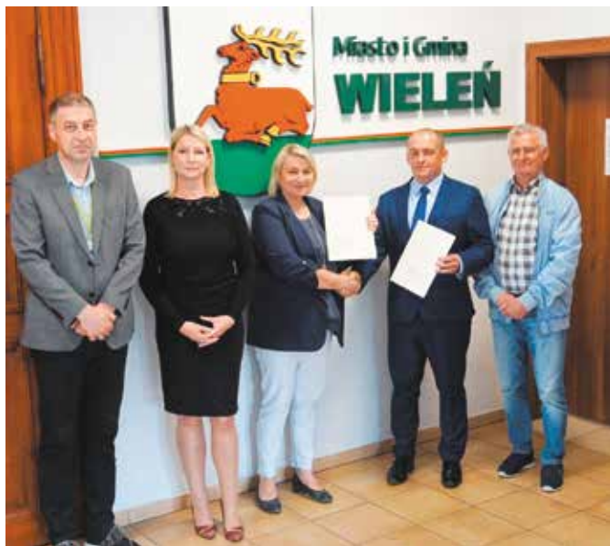
Podpisanie umowy na wodociąg Gulcz Wybudowanie I etap

Po zakończonym w roku 2021 zadaniu związanym z wodociągowaniem osiedla Międzylesie w Wieleniu oraz budową odcinków sieci wodociągowej w m. Nowe Dwory i Rosko przyszedł czas na realizację kolejnych inwestycji wodociągowych.