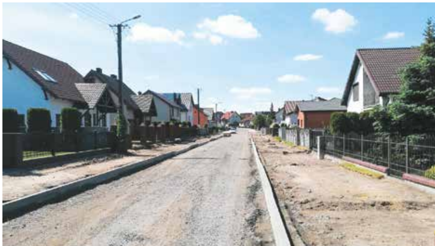
Ulica Jarzębinowa w trakcie prac budowlanych

W toku wyłaniania wykonawcy robót budowlanych znajduje się zadanie związane z przebudową ulic w Rosku. Pierwszy przetarg zakończony został wyłonieniem Wykonawcy, który nie stawił się na podpisaniu umowy oraz nie wniósł zabezpieczenia należytego wykonania umowy. W związku z tym, zgodnie z przepisami prawa zamówień publicznych, Gmina Wieleń zobowią-