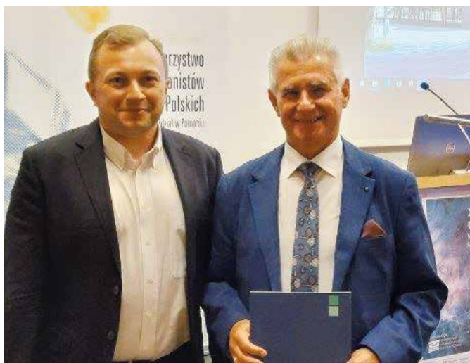
Na zdjęciu z Dyrektorem Towarzystwa Urbanistów Polskich Oddz. Poznań przedstawiciel wyróżnionego w konkursie Samorządu Gminy Wieleń

23 czerwca 2022 r. w Poznaniu odbyły się obchody XIV Dnia Urbanisty. Uroczystość była okazją do wręczenia nagród i wyróżnień w XI edycji konkursu organizowanego przez Towarzystwo Urbanistów Polskich Oddział w Poznaniu na „Najlepiej zagospodarowaną przestrzeń publiczną w Wielkopolsce”. Przedsięwzięcie zostało objęte patronatem Marszałka Województwa Wielkopolskiego.