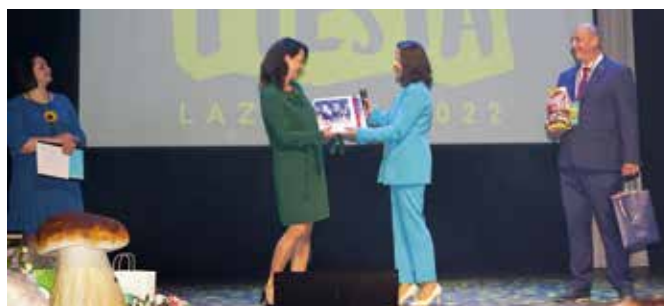
Na pamiątkę spotkania fotoksiążka Polsko - Litewskie partnerstwo Wieleń - Lazdijai

W trakcie uroczystości przekazane zostały informacje o aktualnie realizowanych inwestycjach, m.in. o największym projekcie unijnym (wartości: 25,7 mln zł) – „Rewitalizacja Wieleń szansą rozwoju Gminy”, współfinansowanym w 85% ze środków Wielkopolskiego Regionalnego Programu Operacyjnego na lata 2014 - 2020. W tym roku wszystkie inwestycje realizowane w ramach rewitalizacji zostaną oddane do użytku. W imieniu Samorządu Gminy Wieleń zaproszono Panią Mer Rejonu Lazdijai Ausmę Miškinienė oraz przedstawicieli Samorządu Gminy Partnerskiej Lazdijai na uroczyste podsumowanie całego Programu Rewitalizacji w Wieleń (wrzesień 2023 r.).