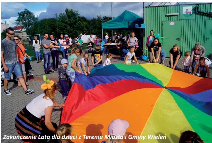
Zakończenie Lata dla dzieci z Terenu Miasta i Gminy Wieleń