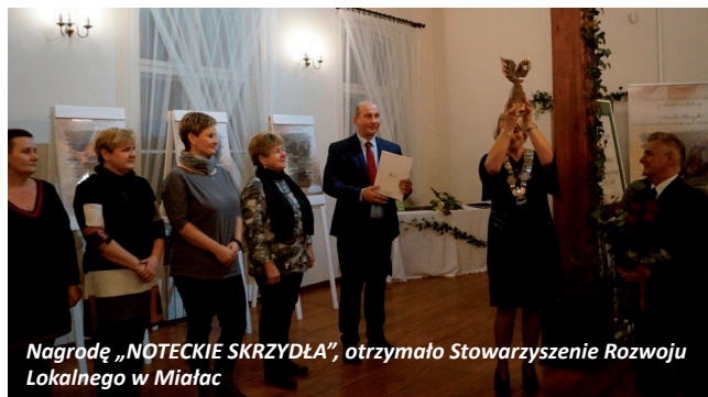
Nagrodę „NOTECKIE SKRZYDŁA”, otrzymało Stowarzyszenie Rozwoju Lokalnego w Miałach