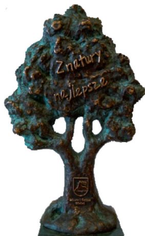
Zarządzenie Nr 124/2016 Burmistrza Wieleń z dnia 15.9.2016