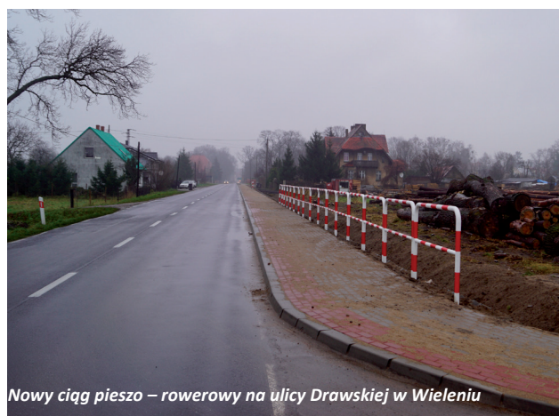
Nowy ciąg pieszo – rowerowy na ulicy Drowskiej w Wieleniu

wała kilka zadań drogowych. Bezpośrednio z budżetu gminy zadania były finansowane w wysokości min. 50% kosztów. Pozostałe środki pochodziły z Funduszu Sołectkiego lub osiedlowego. Na Osiedlu Północ wybudowano odcinek chodnika pomiędzy ulicą Leśną i Daszyńskiego oraz pierwszy odcinek chodnika na ulicy Międzyleskiej. We współpracy z zarządem Osiedla Staromiejskie wymieniono nawierzchnię chodnika na dwóch odcinkach ulicy Sienkiewicza w Wieleniu. Wykonano prace związane z pierwszym etapem budowy chodnika na ulicy Polnej we Wrzeszczynie. Koszt tego zadania finansowanego ze środków Gminy Wielen oraz Funduszu Sołectkiego wsi Wrzeszczyna to ok. 49 tys. zł. Wybudowano odcinek chodnika przy ul. Nojiego w Wieleniu. Koszt zadania (opracowanie dokumentacji, realizacja, nadzór) to kwota 26.423,18 zł. We wrześniu, za kwotę 24.040,53 zł, wykonany został odcinek chodnika przy ul. Jaryńskiej w Wieleniu. W listopadzie wykonano zjazd z drogi wojewódzkiej przy ulicy Dworcowej w Wieleniu. W Rosku przy ul. Mężykowskiej i Stu-