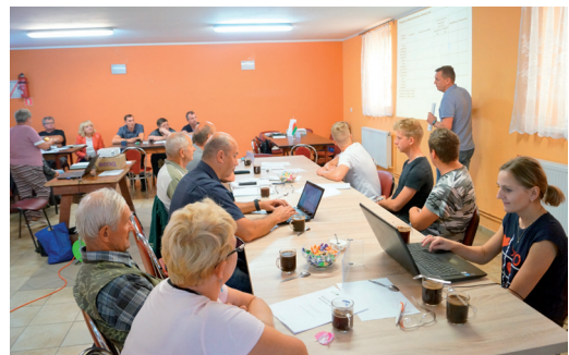
Warsztaty z moderatorami Odnowy Wsi

Nowe Dwory, Miały i Mężyk. Pod okiem moderatorów pracowali przedstawiciele grup odnowy wsi, rad sołeckich, stowarzyszeń. Sołeckie Strategie Rozwoju wsi podle-