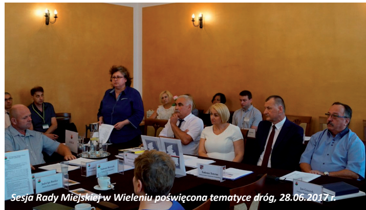
Sesja Rady Miejskiej w Wieleniu poświęcona tematyce dróg, 28.06.2017 r.

pomiędzy Gminą Wieleń, a Powiatem Czarnkowsko- Trzcianeckim w latach 2016-2018 zaplanowane były do realizacji chodniki przy drogach powiatowych w: Rosku (ul. Dworcowa), Dzierżążnie Wielkim oraz Mężyku. W roku 2016 chodnik wybudowany został w Rosku (ul. Dworcowa) natomiast w bieżącym roku Zarząd Dróg Powiatowych w Czarnkowie wykonał pierwszy etap prac związanych z budową chodnika w Dzierżążnie Wielkim przy drodze powiatowej nr 1321P. Wybudowano chodnik na odcinku długości 306 mb. Koszt robót budowlanych to: 141.409 zł. Dodatkowo zawarto porozumienie na wykonanie chodnika w ciągu drogi powiatowej nr 1338P na odcinku ul. Mężykowskiej w Wieleniu. Tu wybudowany został obustronny chodnik o łącznej długości ok. 450 metrów. Inwestorem był Zarząd Dróg Powiatowych w Czarnkowie natomiast Gmina Wieleń współfinansowała zadania w kwocie 74.486 zł. Wartość całkowita robót to ok. 121.000 zł.