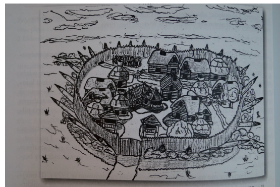
Plan konkursu związanego z jubileuszem Wielenia (SP nr 1, 1998)

ustanawiani przez niego starostowie. W tym czasie władca prowadził również działania mające na celu zabezpieczenia granic poprzez budowę systemu zamków obronnych. Taki zamek, według kronikarza