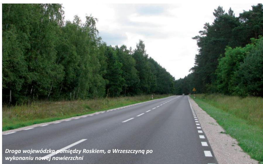
Droga wojewódzka pomiędzy Roskiem, a Wrzeszczyną po wykonaniu nowej nawierzchni

wała kilka zadań drogowych. Bezpośrednio z budżetu gminy zadania były finansowane w wysokości min. 50% kosztów. Pozostałe środki pochodziły z Funduszu Sołectkiego lub osiedlowego. Na Osiedlu Północ wybudowano odcinek chodnika pomiędzy ulicą Leśną i Daszyńskiego oraz pierwszy odcinek chodnika na ulicy Międzyleskiej. We współpracy z zarządem Osiedla Staromiejskie wymieniono nawierzchnię chodnika na dwóch odcinkach ulicy Sienkiewicza w Wieleniu. Wykonano prace związane z pierwszym etapem budowy chodnika na ulicy Polnej we Wrzeszczynie. Koszt tego zadania finansowanego ze środków Gminy Wielen oraz Funduszu Sołectkiego wsi Wrzeszczyna to ok. 49 tys. zł. Wybudowano odcinek chodnika przy ul. Nojiego w Wieleniu. Koszt zadania (opracowanie dokumentacji, realizacja, nadzór) to kwota 26.423,18 zł. We wrześniu, za kwotę 24.040,53 zł, wykonany został odcinek chodnika przy ul. Jaryńskiej w Wieleniu. W listopadzie wykonano zjazd z drogi wojewódzkiej przy ulicy Dworcowej w Wieleniu. W Rosku przy ul. Mężykowskiej i Stu-