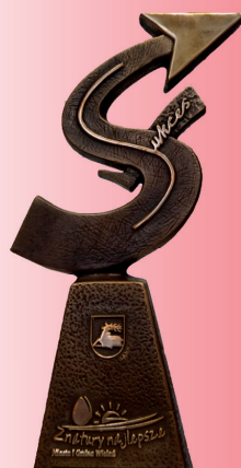
Zarządzenie Nr 208/2017 Burmistrza Wieleń z dnia 2.10.2017