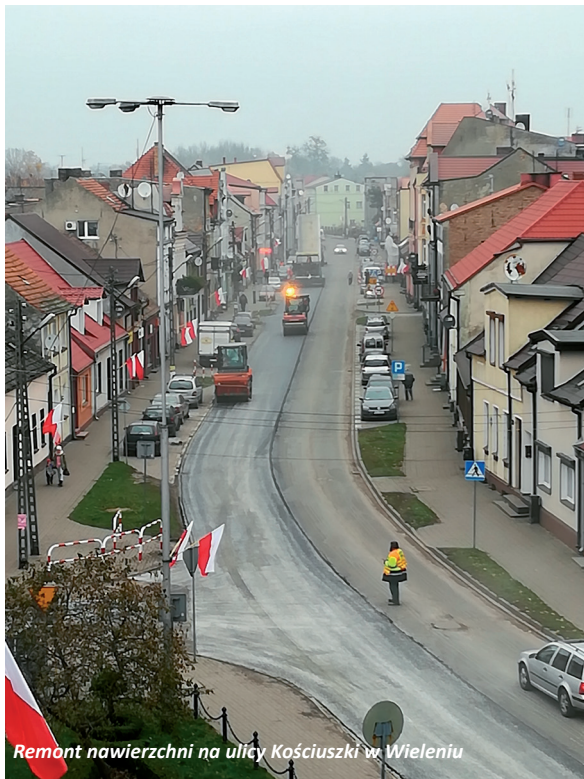
Remont nawierzchni na ulicy Kościuszki w Wieleniu

W okresie letnim drogowcy zarządzający drogami wojewódzkimi przystąpili do remontu drogi wojewódzkiej nr 181 pomiędzy Wrzeszczyną i Roskiem. Łącznie długość wyremontowanego odcinka to 2,6 km. Zakres prac obejmował odnowę nawierzchni jezdni poprzez ułożenie dwóch warstw masy bitumicznej, uzupełnienie poboczy gruntowych oraz malowanie oznakowania poziomego. Wartość zadania, które sfinansowane zostało ze środków Wielkopolskiego Zarządu Dróg Wojewódzkich w Poznaniu to 1,2 mln zł.