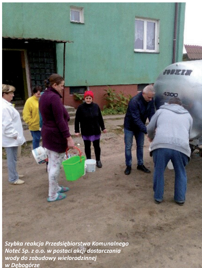
Szybka reakcja Przedsiębiorstwa Komunalnego Noteć Sp. z o.o. w postaci akcji dostarczania wody do zabudowy wielorodzinnej w Dębogórze

Korzystając z okazji Zarząd Spółki oraz Pracownicy PK „NOTEĆ” życzą wszystkim Mieszkańcom gminy Wieleń zdrowych, spokojnych, spędzonych w rodzinnej atmosferze Świąt Bożego Narodzenia. Niech nadchodzący Nowy Rok będzie pełen sukcesów zarówno prywatnych jak i zawodowych.