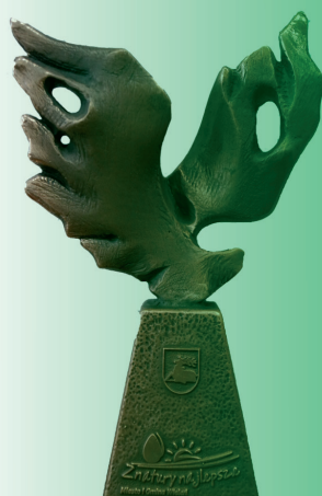
Zarządzenie Nr 222/2017 Burmistrza Wieleń z dnia 7.11.2017