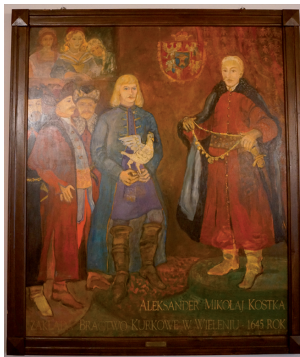
Historyczny obraz przedstawiający uroczystość założenia Bractwa Kurkowego w Wieleniu (1645)

Przed niespełną dwadzieścia laty rocznicowy artykuł kończyłem pytaniem, czy władzom miasta i gminy, dzięki