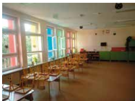
Odnowione pomieszczenie w Przedszkolu przy ulicy Sportowej

Od początku istnienia kotłowni w Szkole Podstawowej Nr 2 w Wieleniu, problemem były nachodzące wody gruntowe, które powodowały, iż funkcjonujące tam piece szybciej traciły swoją żywotność. Na początku 2019 roku udało się z budżetu gminy wyasygnować kwotę 300 tysięcy złotych na remont kotłowni. W ramach prac modernizacyjnych zamontowana została studnia schładzająca, która gromadzi nachodzące wody gruntowe. Podłoga w kotłowni została wykonana z materiałów niepalnych, wytrzymałych na zmianę temperatury oraz uderzenia. Zamontowane zostały drzwi ogniowe o odpowiedniej odporności.