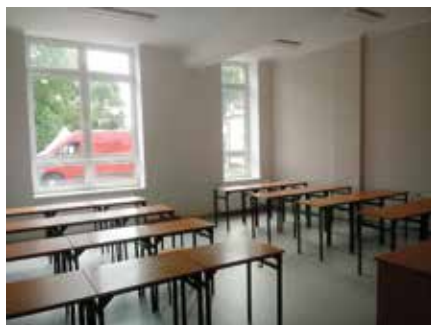
Nowa pracownia w ZS w Wieleniu