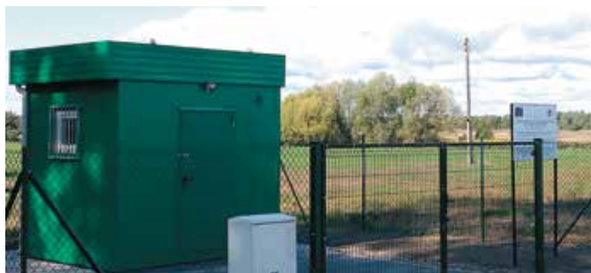
Pompownia wody w m. Rosko na trasie sieci wodociągowej

Na terenach wiejskich Gmina realizuje zadania współfinansowane ze środków Programu Rozwoju Obszarów Wiejskich 2014-2020. Wspomnieć tu należy o budowie sieci wodociągowej dla wsi Biała i Hamrzysko wraz z rozbudową stacji uzdatniania wody w m. Rosko. Obecnie na ukończeniu są prace związane z budową sieci przewidzianej projektem dla wsi Biała. Planowany jest częściowy odbiór sieci i jej oddanie do eksploatacji dzięki czemu korzystanie z sieci przez mieszkańców wsi Biała będzie możliwe w roku bieżącym. Wykonawca jeszcze w tym roku rozpocznie prace związane z wodociągowaniem wsi Hamrzysko. Umowny termin zakończenia całości zadania to maj 2020 roku.