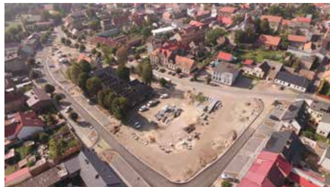
Ulica Nowe Miasto i targowisko w Wieleniu w trakcie prac

W Wieleniu, również przy wsparciu środkami Programu Rozwoju Obszarów Wiejskich, powstaje obiekt nowoczesnego targowiska. Umowny termin zakończenia prac to koniec października br. Obecnie trwają prace związane z montażem pokrycia dachowego oraz obudowa i wykończenie kontenerów socjalno-technicznych.