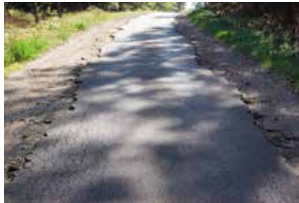
Stan istniejący drogi Hamrzysko- Krucz

i Fiołkowej oraz przykanalików odprowadzających wody opadowe do istniejącej sieci kanalizacji deszczowej. Droga zostanie włączona w pas drogi wojewódzkiej nr 135 (ul. Potrzebownicka), przy której zlokalizowana zostanie zatoka autobusowa wraz z wiatą przystankową. W obrębie prowadzonych prac zagospodarowana zostanie również zielen. Oświetlenie ww. odcinka drogi zostało przygotowane w ramach wcześniej realizowanych zadań gminy. Wniosek dotyczący ulicy Storczykowej i Fiołkowej uplasował się na 41. miejscu listy zadań rekomendowanych do dofinansowania. Szacunkowy koszt robót to 1.397.173,93 zł, w tym dofinansowanie 586.490,00 zł (50% kosztów kwalifikowanych).