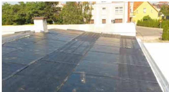
OSP Wieleń w trakcie prac remontowych

W trakcie opracowania jest dokumentacja projektowa dla przebudowy chodnika przy drodze powiatowej w Dębogórze. Realizacja pierwszego etapu robót przewidziana jest na rok 2020. Ze środków Gminy Wieleń opracowywane są projekty dla zadań inwestycyjnych, które planowane są na kolejne lata. Dokumentacje projektowe są opracowywane na: budowę parkingu przy ulicy Kasprzaka wraz z łącznikiem pomiędzy ulicą Kasprzaka i Wybickiego, przebudowę dróg w Rosku wraz z budową kanalizacji deszczowej (Cmentarna, Jarzębinowa, Tęczowa, Kwiatowa, Studniowa), budowę sieci wodociągowej i kanalizacji sanitarnej w Wieleniu (os. Międzyzlesie, ul. Pilska, Al. Zamkowa), budowę sieci wodociągowej z przyłączami (Gulcz Wybudowanie, Rosko Wybudowanie, Nowe Dwory). Rozpoczęto opracowanie programu funkcjonalno- użytkowego dla budowy oświetlenia ulicznego na os. Międzyzlesie i Zatorze w Wieleniu, który stanowić będzie podstawę do wszczęcia procedury wyłonienia wykonawcy robót w formule „zaprojektuj i wybuduj”.