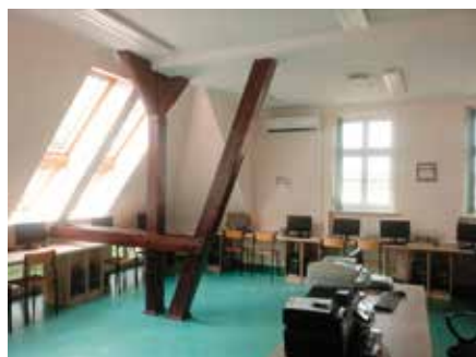
Wyremontowana pracownia logistyczna w ZS w Wieleniu