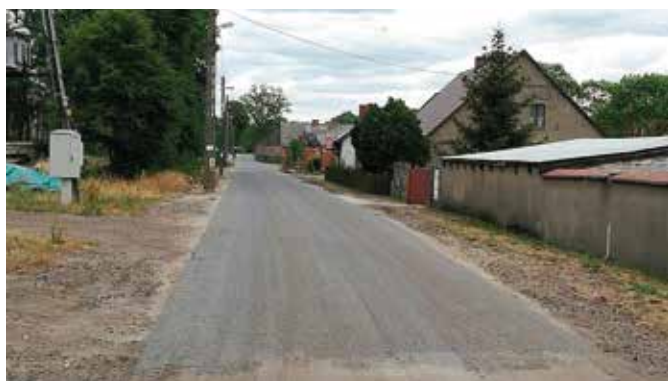
II etap robót na drodze Marianowo- Herburtowo

Przy dofinansowaniu ze środków Urzędu Marszałkowskiego Województwa Wielkopolskiego zrealizowano kolejny etap prac związanych z przebudową drogi Marianowo- Herburto- wo. W roku bieżącym wykonano odcinek drogi o dł. 0,9 km i średniej szerokości 4,0 m. Obecnie utwardzenie nawierzchni drogi obejmuje już całą wieś Marianowo oraz odcinek we wsi Herburtowo do wysokości posesji nr 7. Koszt tegorocznego etapu zadania to: 358.889,40 zł, przy czym 241.600,00 zł stanowiło dofinansowanie z Urzędu Marszałkowskiego Województwa Wielkopolskiego w Poznaniu. Dodatkowo wykonana zostanie nawierzchnia asfaltowa na włączeniu drogi gminnej do drogi wojewódzkiej od strony Marianowa przy zjeździe do wsi za Punktem Selektywnej Zbiórki Odpadów Komunalnych.