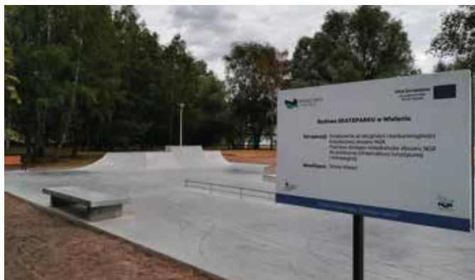
Skatepark przy ulicy Sportowej w Wieleniu

W ramach środków pozyskanych z Programu Operacyjnego „Rybnictwo i Morze”, działanie „Realizacja lokalnych strategii rozwoju kierowanych przez społeczność” wybudowano skatepark przy zbiorniku wodnym „Marcinówka”. Obiekt, który oficjalnie otwarto podczas Dni Ziemi Wieleńskiej, cieszy się dużym powodzeniem, szczególnie wśród dzieci i młodzieży. Inwestycja realizowana była jako część zadań przewidzianych do etapowego wykonania ujętych w koncepcji zagospodarowania terenów pomiędzy ulicą Sportową i Mężykowską w Wieleniu.