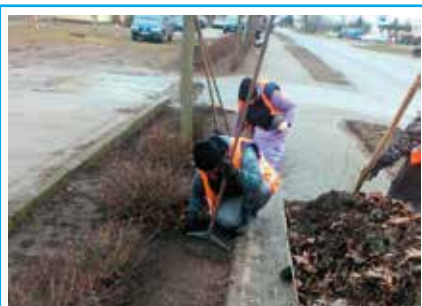
Realizacja umowy z Gminą Wielen dotycząca całorocznego utrzymania porządku i pielęgnacji zieleni na terenie miasta Wielen