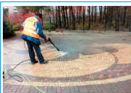
Realizacja prac zleconych przez osoby prywatne i lokalne firmy