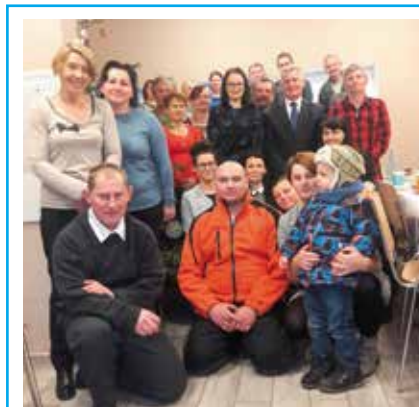
Realizacja porozumienia z Miejsko-Gminnym Ośrodkiem Pomocy Społecznej w Wieleniu w zakresie koordynacji aktywizacji społeczno – zawodowej w ramach zajęć Centrum Integracji Społecznej dla uczestników projektu „Program aktywnej integracji w Gminie Wielen” współfinansowanego przez Unię Europejską w ramach EFS.