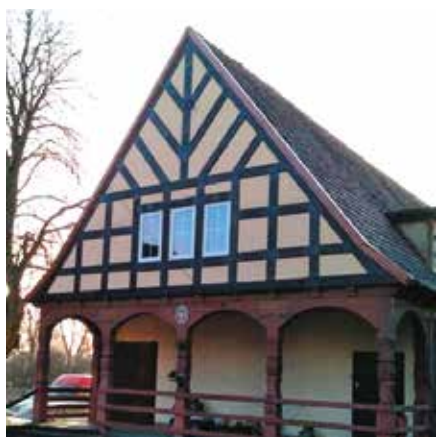
Budynek gminny w Herbutowie przed i po wykonaniu remontu szczytu