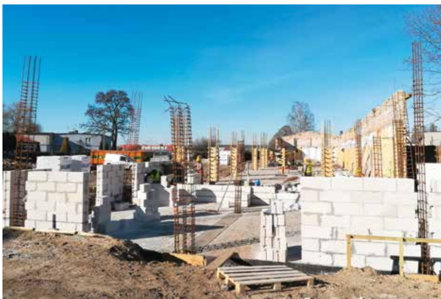
Fot. Mediateka w Wieleniu w trakcie budowy

Kontynuowane są zadania związane z projektem „Rewitalizacja Wielenia szansą rozwoju Gminy”. Projekt składa się z czterech modułów, z których zakończony w roku 2020 został moduł „Nowe Miasto NA NOWO”. Wybudowana infrastruktura w obrębie ulicy Nowe Miasto służy już mieszkańcom naszej gminy oraz wszystkim odwiedzającym Wielen. Trwają natomiast prace przy realizacji pozostałych trzech modułów. W obrębie Zespołu Szkół w Wieleniu powstaje wieleńska mediateka. Obiekt realizowany jest w formule „zaprojektuj i wybuduj”. Obecnie trwają prace związane z wykonaniem nowej konstrukcji żelbetowej słupowej budynku oraz prace