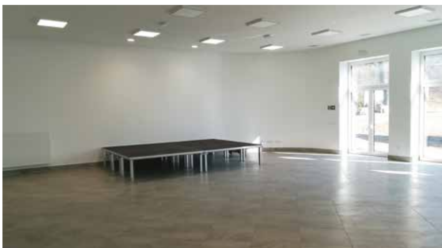
Fot. Sala wiejska w Folsztynie

tw. dróg dojazdowych do pól. Tu Gmina Wieleń złożyła jesienią 2020 roku wniosek o dofinansowanie przebudowy kolejnego odcinka drogi Marianowo- Herburtowo (IV etap obejmuje odcinek o dł. ok. 1 kilometra w obrębie wsi Herburtowo). W przypadku pozyskania dofinansowania na tym odcinku drogowym prace zostaną zrealizowane w roku bieżącym. Niezależnie od tego dokonany zostanie przegląd gwarancyjny wcześniej zrealizowanych prac na drodze Marianowo- Herburtowo i wykonane zostaną naprawy gwarancyjne powstałych ubytków nawierzchni.