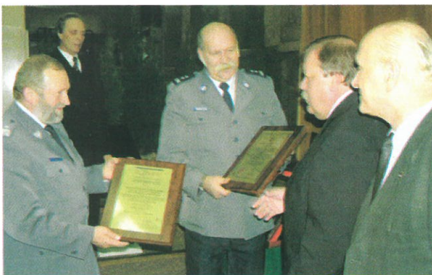
Obchody Europejskiego Tygodnia Jakości '2003 – wręczenie certyfikatu systemu zarządzania