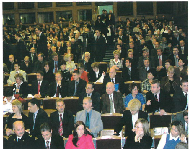
Uczestnicy konferencji zorganizowanej z okazji...