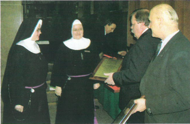
Obchody Europejskiego Tygodnia Jakości '2003 – wręczenie certyfikatu systemu zarządzania