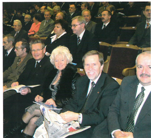
... Europejskiego Tygodnia Jakości i obchodów 45-lecia

Wraz z uzyskaniem członkostwa Polski w Unii Europejskiej, 1 maja PCBC uzyskuje notyfikację jako jednostka certyfikująca wyroby w zakresie dziesięciu dyrektyw nowego podejścia. PCBC obchodzi 45-lecie działalności podczas Europejskiego Tygodnia Jakości.