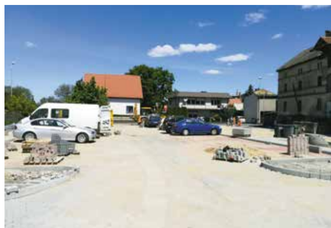
Parking na ulicy Kasprzaka w trakcie budowy

przełomie maja i czerwca br. dokonano także wymiany trzech wiat przystankowych wraz z wykonaniem nawierzchni z kostki betonowej polbruk zlokalizowanych na terenie m. Wieleń. W latach poprzednich wiaty przystankowe etapowo wymieniano na obszarach wiejskich gminy.