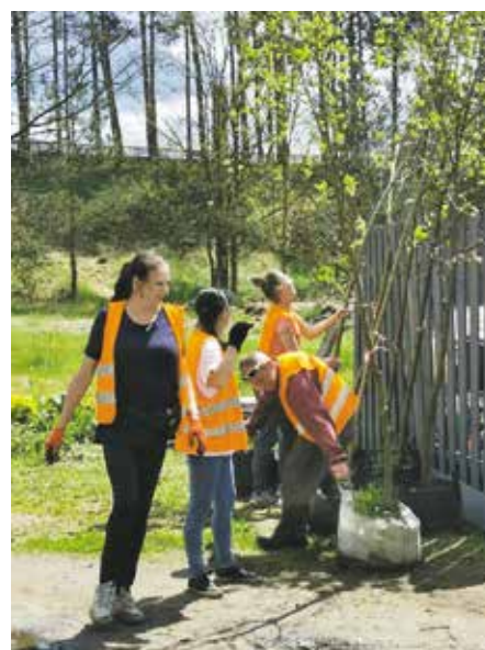
Uczestnicy programu reintegracji społecznej i zawodowej

CIS zostało wyznaczone przez Burmistrza Wieleń Elżbietę Rybarczyk - do przyjmowania osób kierowanych przez Sąd Rejonowy w Trzciance do odbywania nieodpłatnej, kontrolowanej pracy na cele społeczne. CIS ARKA w 2020 roku miał nadzór nad pracami 37 skazanych osób. Centrum zobowiązane jest zorganizować skazanym osobom szkolenie BHP, przydzielić podstawową odzież ochronną oraz zorganizować prace na cele społeczne w miejscu zamieszkania. W Wieleń kontrolę nad pracami sprawują instruktorzy CIS, na terenie sołectw odbywa się