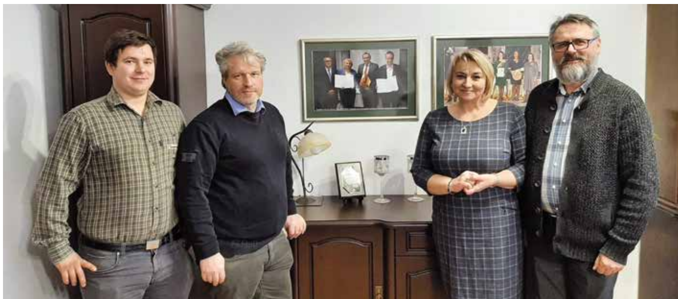
Wizyta przedstawicieli zaprzyjaźnionej Gminy Kirkel, 19 lutego 2021 r.

Wspólnota Węgla i Stali (EWWiS założona przez: Belgię, Francję, Holandię, Luksemburg, Niemcy i Włochy) była pierwszą w historii ponadnarodową instytucją europejską, która ostatecznie przekształciła się w UE.