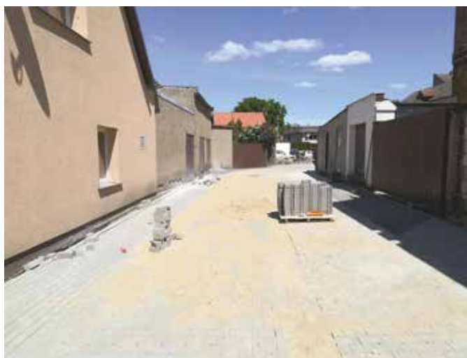
Droga łącząca ulicę Kasprzaka i Wybickiego w trakcie robót

Zakończone zostały zadania związane z przebudową i modernizacją sali wiejskiej w Folsztynie oraz budową żłobka w Wieleniu. Oba zadania realizowano z dofinansowaniem zewnętrznym - salę wiejską w ramach Programu Rozwoju Obszarów Wiejskich na lata 2014- 2020, natomiast żłobek w ramach Programu „Maluch+” oraz Wielkopolskiego Regionalnego Programu Operacyjnego na lata 2014-2020. Tu dofinansowanie obejmowało także wyposażenie obiektu oraz jego funkcjonowanie w okresie 20 miesięcy. Obiekty oddane zostały do użytku i dziś służą już mieszkańcom.