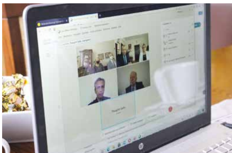
Przedstawiciele powiatów partnerskich, współpracujących z Powiatem Saarpfalz Powiat Łańcut oraz Powiat Przemysł