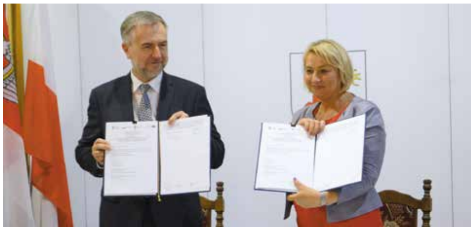
Podpisanie umowy dofinansowania realizacji projektu „Przebudowa Ośrodka Kultury w Wieleńiu”