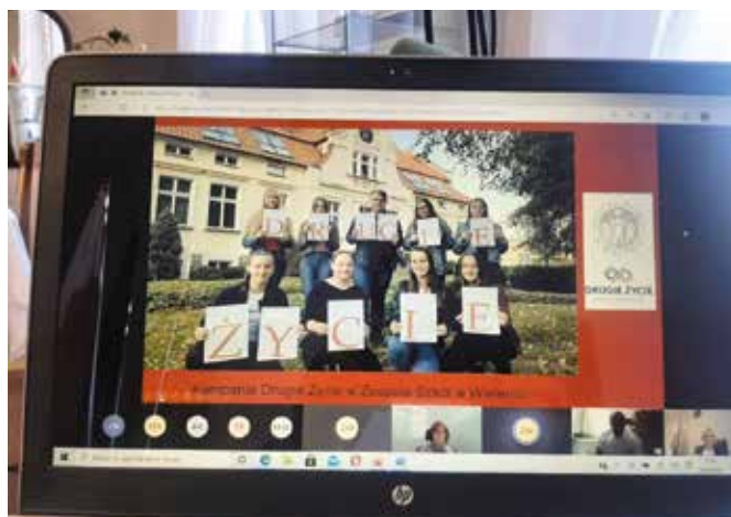
Uczniowie Zespołu Szkół w Wieleniu uzyskali tytuł laureata kampanii „Drugie życie”

Jest nam bardzo miło, że nasze działania zostały zauważone i docenione przez Kapitułę Kampanii. Uzyskanie tytułu laureata jest dla nas ogromnym sukcesem i dużym wyróżnieniem. Cieszymy się, że mogliśmy stanowić część tego niezwykle ważnego przedsięwzięcia, promować transplantację i przyczynić się do ratowania życia drugiego człowieka. Ostatnie siedem miesięcy to okres wyczerpanej pracy, której nadrzędnym celem było promowanie oświadczeń woli oraz szerzenie wiedzy na temat transplantacji. Swoimi działaniami chcieliśmy dotrzeć do szerokiego grona odbiorców, uświadamiać, rozwiewać wszelkie mity i przekłamania krążące wokół idei transplantacji. Cieszymy się, że udało nam się rozdać prawie 300 oświadczeń woli!