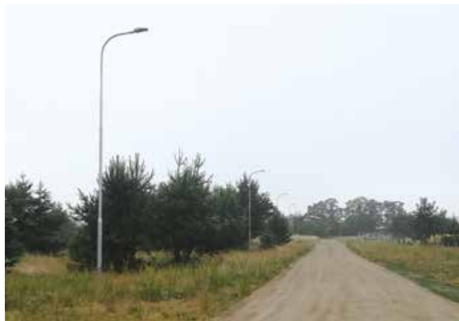
Oświetlenie na osiedlu Międzyzlesie w Wieleniu

W ramach II naboru wniosków o dofinansowanie z Rządowego Funduszu Inwestycji Lokalnych Gmina Wieleń pozyskała kwotę dwóch milionów złotych na prace wodociągowe w obrębie Gminy Wieleń. Podpisano już umowę z wykonawcą oraz rozpoczęto roboty budowlane w zakresie pierwszej części zadania, która obejmuje wykonanie odcinków sieci wodociągowej w Nowych Dworach, Rosko Wybudowanie, Rosko ul. Polna oraz osiedle Międzyzlesie w Wieleniu. Prace budowlane dla tego zakresu to koszt ok. 700 tys. zł, a ich zakończenie planowane jest w roku 2021. Po za-