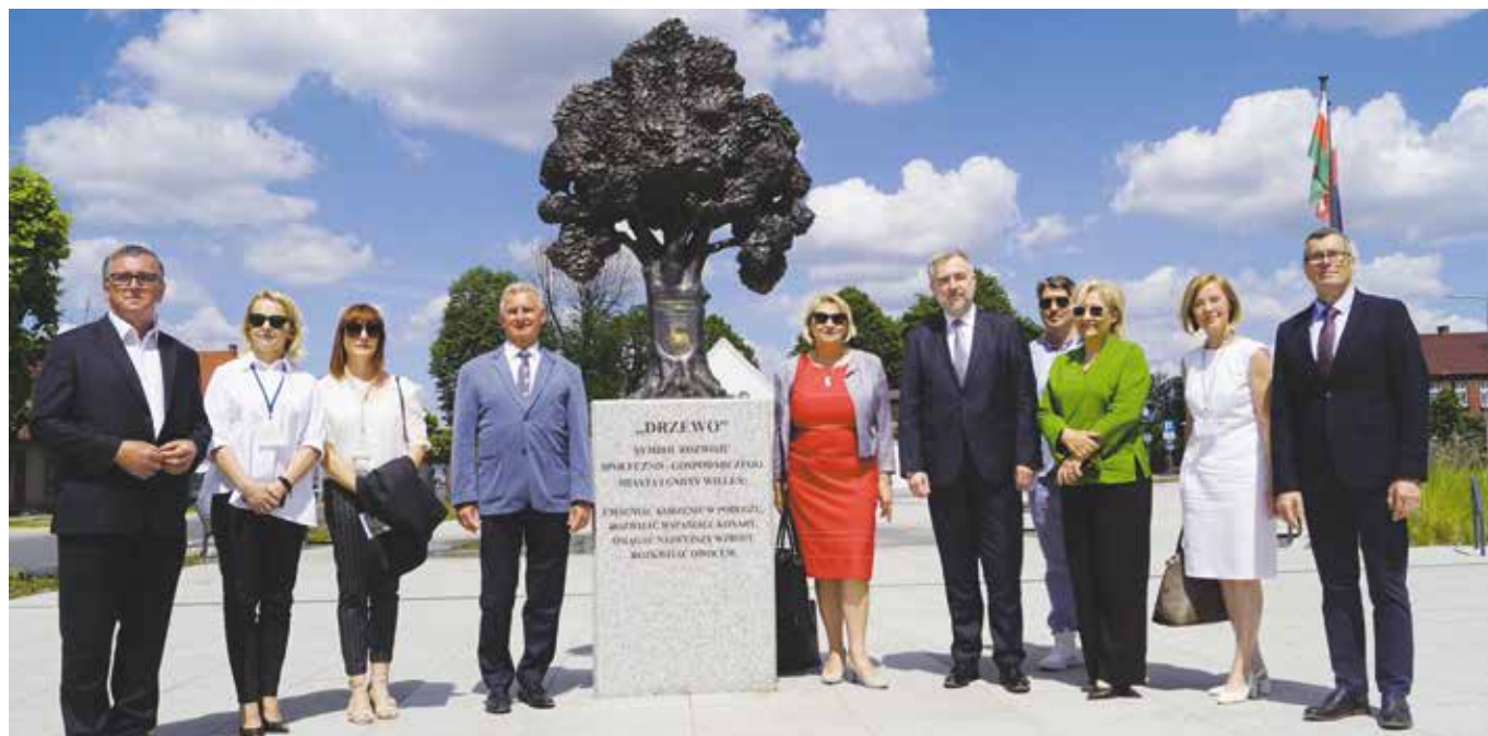
Wizyta w terenie - NOWE MIASTO NA NOWO, wspólne zdjęcie przy rzeźbie „DRZEWO”

Gmina skutecznie pozyskała środki unijne. „Przebudowa Ośrodka Kultury Strzelnica w Wieleniu” jest to 54 projekt realizowany w Gminie Wielen z wykorzystaniem środków z zewnętrznych. Ośrodek Kultury „Strzelnica” przejdzie gruntowny remont, obejmujący m.in. termomodernizację budynku. Renowacja dotyczy także parku otaczającego obiekt, gdzie mieszkańcy i odwiedzający to miejsce goście, będą mogli spędzać czas wolny. Powstanie również Szlak Perł Ziemi Wieleńskiej, na którym usytuowane będą tablice informacyjne, zlokalizowane przy zabrykach na terenie całej Gminy Wielen. Zaplanowano także zakup mobilnej estrady do wykorzystania podczas plenerowych imprez kulturalnych. Koszt całego przedsięwzięcia to 1,5 mln zł, z czego 1 mln zł pochodzić będzie z unijnego dofinansowania.