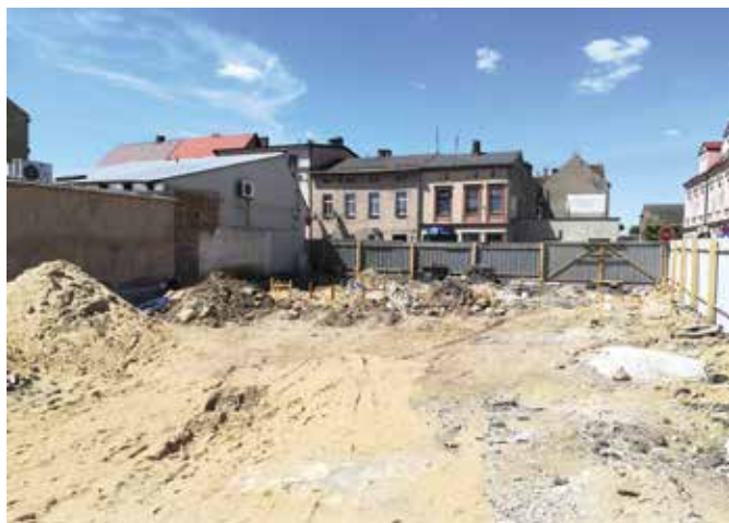
Przystanek Edukacja w Wieleniu w trakcie prac ziemnych

ra będzie realizowała tegoroczny odcinek prac. Koszt zadania to: 238.521,60 zł. Zgodnie z wymogami dot. dróg dojazdowych do pól wykonana zostanie droga w metodzie powierzchniowego utwardzenia emulsją i grysami o średniej szerokości 4,0 m. Zakończenie prac planowane jest na koniec lipca br.