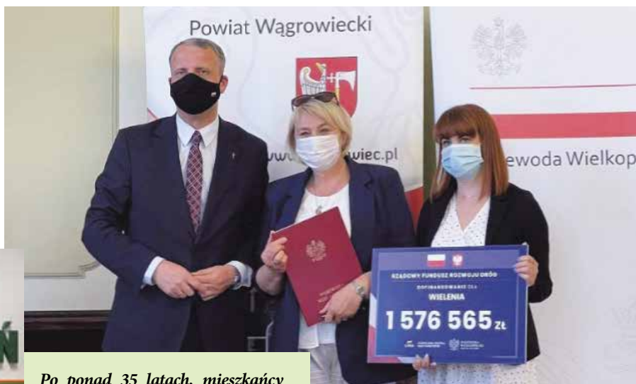
Podpisanie umowy na dofinansowanie zadania

Zadanie drogowe obejmuje przebudowę nawierzchni dróg i chodników na