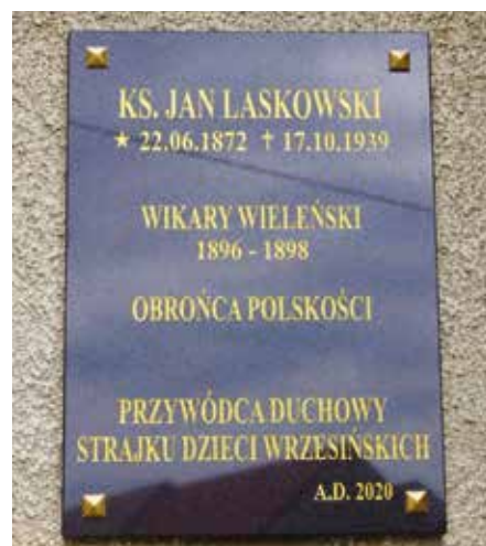
Tablica pamiątkowa zamontowana na ścianie zewnętrznej kościoła parafialnego w Wieleniu