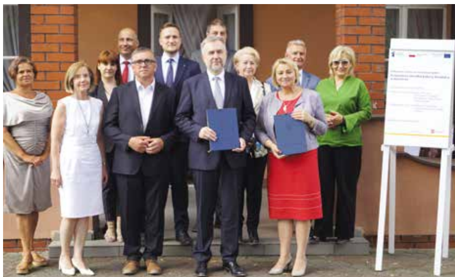
Uczestnicy uroczystości podpisania umowy w Ośrodku Kultury „Strzelnica” w Wieleńiu