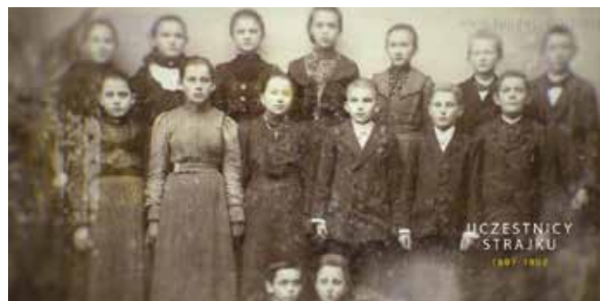
Uczestnicy Strajku 1901 - 1902

W roku 2021 przypada 120. rocznica Strajku Szkolnego Dzieci Wrześnińskich. Protest uczniów Katolickiej Szkoły Elementarnej we Wrześni w 1901 r. był szczególnym przejawem walki o polskość w okresie zaborów. Dzieci, które stanęły w obronie nauczania religii w języku polskim otrzymywały okrutne kary od nauczycieli. Wydarzenia te stały się symbolem walki z germanizacją i o przetrwanie polskiej tożsamości narodowej.