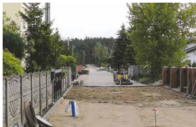
Ulica Bęglewska w trakcie przebudowy

W zakresie dróg gruntowych w drugim kwartale br. przeprowadzone zostały prace związane z doziaranianiem, poprawą nawierzchni oraz profilowaniem odcinków dróg. Przeprowadzono remonty cząstkowe dróg gminnych o nawierzchni asfaltowej. Na