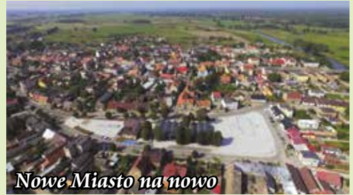
Nowe Miasto na nowo