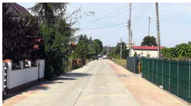
Ulica Bęglewska w Wieleniu po realizacji robót

mownicze. Jedno przy zejściu do rzeki ulicą Nadnotecką i drugie po zachodniej stronie mostu na Noteci. Na nabrzeżach powstanie infrastruktura umożliwiająca użytkownikom jednostek pływających zaopatrzenie w wodę, zrzut ścieków oraz ładowanie akumulatorów. Poza pasem przylegającym bezpośrednio do rzeki Noteci, na działkach stanowiących własność gminy, wykonane zostaną: ścieżki edukacyjne, park ornitologiczno- przyrodniczy, tablice historyczne, klomby z roślinnością nadnoteckich łąk, plac zabaw oraz wielofunkcyjna przestrzeń umożliwiająca realizację przedsięwzięć integracyjnych i informacyjno- promocyjnych. Projekt „Rewitalizacja Wielenia szansą rozwoju Gminy” jest dofinansowany ze środków Wielkopolskiego Regionalnego Programu Operacyjnego na lata 2014- 2020, poddziałanie 9.2.1. Rewitalizacja miast i ich dzielnic, terenów wiejskich, przemysłowych i powojkowych.