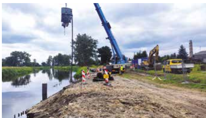
Rozpoczęcie prac na bulwarach nadnoteckich w Wieleniu

Dokonano wyboru wykonawcy prac wodociągowych na terenie gminy. Zadanie stanowi pierwszy etap inwestycji dla zakresu, dla którego opracowane zostały wcześniej dokumentacje projektowe wraz z uzyskaniem wszelkich uzgodnień. W ramach zadania wybudowano już odcinki sieci wodociągowej w Nowych Dworach, Rosko Wybudowanie, Rosko ul. Polna. Trwają roboty montażowe związane z kompleksowym wodociągowaniem osiedla Międzyzlesie w Wieleniu. Realizowany obecnie zakres prac finansowany jest ze środków Rządowego Funduszu Inwestycji Lokalnych w kwocie ok. 700 tys. zł.