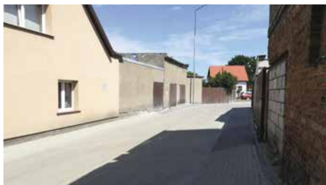
Droga łącząca ulicę Wybickiego i Kasprzaka w Wieleniu

W okresie letnim br. przekazano do użytkowania zadania realizowane przy finansowaniu ze środków Rządowego Funduszu Inwestycji Lokalnych. Dzięki pozyskanym środkom zewnętrznym Gmina Wieleń zrealizowała zadania związane z budową parkingu przy ulicy Kasprzaka wraz z drogą łączącą ulice: Kasprzaka i Wybickiego oraz przebudową ulicy Bęglewskiej w Wieleniu. Łącznie koszt zrealizowanych obu zadań drogowych to kwota 896,2 tys. zł. Zakończono także inwestycję dotyczącą kompleksowej budowy sieci oświetlenia ulicznego w obrębie osiedla Zatorze i Międzyzlesie w Wieleniu. Zadanie oświetleniowe również finansowano ze środków pozyskanych w ramach Rządowego Funduszu Inwestycji Lokalnych. Koszt inwestycji zrealizowanej w formule „zaprojektuj i wybuduj” to kwota: 561,1 tys. zł. Wykonano linie oświetleniowe o łącznej długości ok. 4,5 km oraz zamontowano 96 punktów świetlnych ledowych.