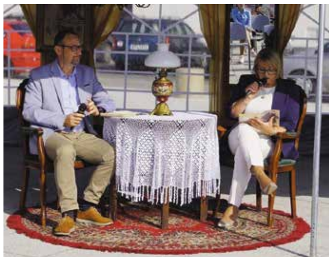
W Wieleniu czytano dramat Gabrieli Zapolskiej pt. „Moralność pani Dulskiej”

zmodernizowanym placu Nowego Miasta. Imprezie towarzyszyło gminne stoisko wystawiennicze i animacyjne przygotowane wspólnie przez Miejsko - Gminny Ośrodek Pomocy Społecznej, Lokalne Centrum Wolontariatu oraz Urząd Miejski w Wieleniu. Na stoisku można było otrzymać między innymi materiały na temat akcji #szczepiMYgminy. Wydarzenie zostało przygotowane w takiej formie, aby każdy w każdej chwili mógł do niego dołączyć.