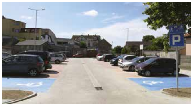
Parking przy ul. Kasprzaka w Wieleniu