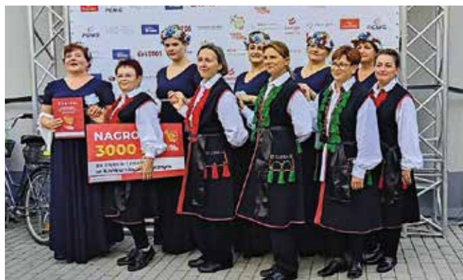
Guleckie Szprychy z Gulcza zajęły I miejsce podczas Finału Festiwalu KGW Polska od Kuchni w Swarzędzu

Zespół działa od około 7 lat, skupia 15 par, które w czasie wolnym przygotowują choreografię do różnorodnego repertuaru muzycznego (muzyka klasyczna, ludowa, rozrywkowa). „Guleckie Szprychy” z Gulcza uświetniają swoimi występami uroczystości gminne i powiatowe, a także wydarzenia o zasięgu ponadlokal-