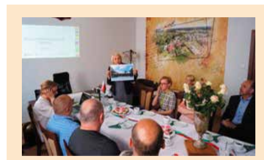
2017 PRZEDSTAWIENIE SIŁY PROJEKTU