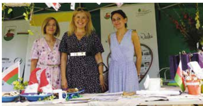
Stoisko promocyjne Gminy Wielen na przystani „Yndzel” w Drawsku, 31.07.2021 r.