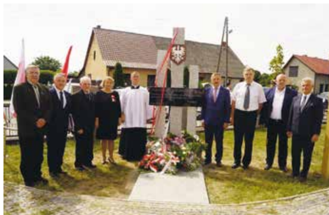
Pomnik Powstańców Wielkopolskich w Gulczu po odsłonięciu i poświęceniu 15.08.2021