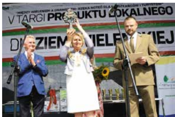
Wieleń, 17.07.2021 r. - V Targi