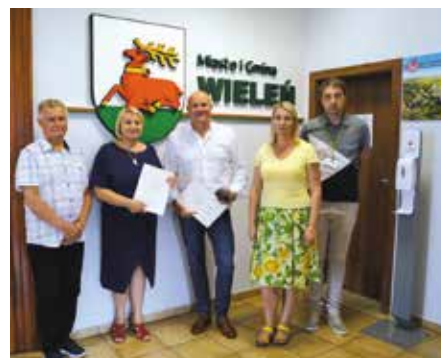
Podpisanie umowy z wykonawcą robót drogowych os Drowskie

Jest to kolejne zadanie drogowe realizowane na terenie Gminy Wielęń przy wsparciu ze środków Rządowego Funduszu Rozwoju Dróg. W roku 2020 oddano do użytku drogę Hamrzyisko- Krucz oraz odcinek ulicy Storczykowej i Fiołkowej (nazwa programu: Fundusz Dróg Samorządowych). Natomiast w roku