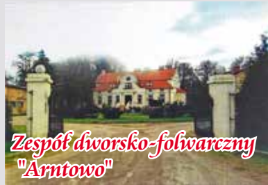
Zespół dworsko-fołwarczny "Arntowo"