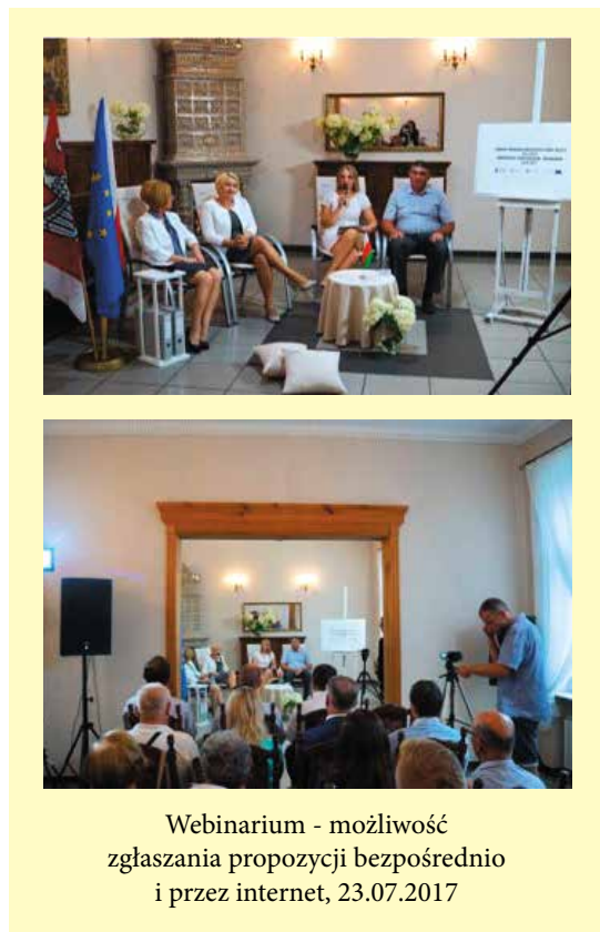
Webinarium - możliwość zgłaszania propozycji bezpośrednio i przez internet, 23.07.2017