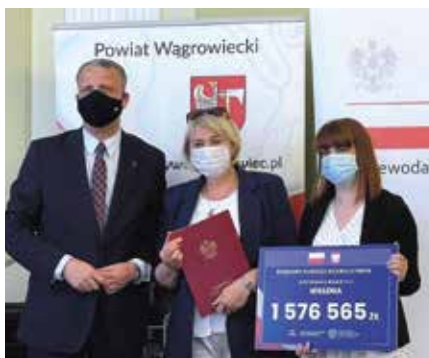
Podpisanie umowy dofinansowania na budowę dróg

Kolejnym krokiem w celu realizacji zadania było podpisanie umowy z wykonawcą robót budowlanych, które nastąpiło w dniu 29 czerwca 2021 r. Wykonawcą wybrano w wyniku przeprowadzonego postępowania w trybie podstawowym- zgodnie z obowiązującą ustawą Prawo zamówień publicznych. W ramach zadania wykonane zostaną nawierzchnie utwardzone jezdni oraz chodników w obrębie ulic: Jarzębinowa, Akacyjowa, Bukowa, Topolowa, Jesionowa, odcinek ciągu pieszo- jezdni łączący ulicę Bukową z Akacyjową, oraz odcinek ulicy Przemysłowej od drogi wojewódzkiej (ul. Drowska) do skrzyżowania z ulicą Topolową. Odwodnienie wykonanych nawierzchni zostanie zapewnione poprzez podłączenie kratek ulicznych ściekowych do istniejącej sieci