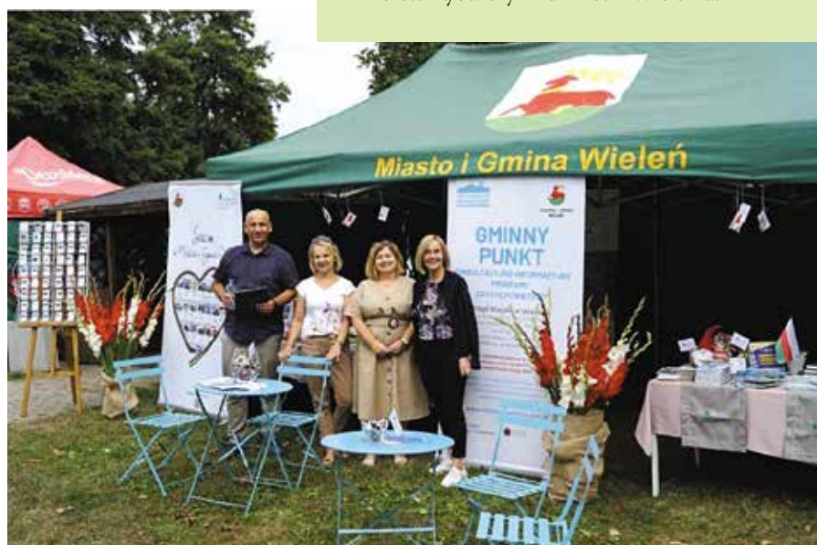
Stoisko promocyjne Gminy Wieleń