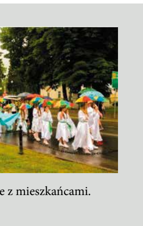
... z mieszkańcami.

Facebook * Lekcje * Akademia Obywateli * Makieta * Prezentacje * Ankiety tradycyjne * Webinarium * Broszury * Transmisje * Ogłoszenia * Targi