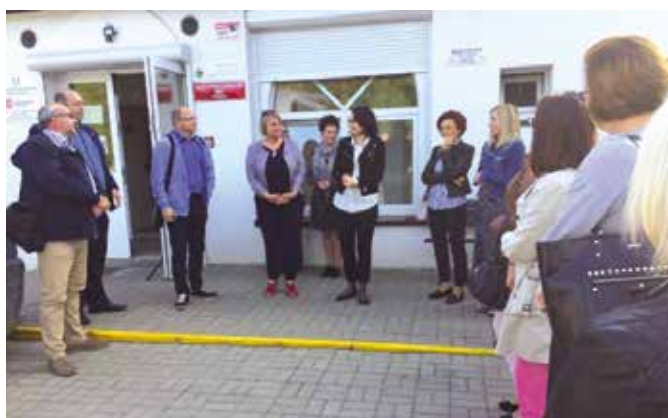
Wizyta studyjna delegatów z Gminy Rycyzwół w Centrum Integracji Społecznej ARKA w Wieleniu