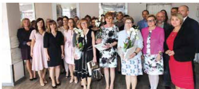
Podziękowanie dla nauczycieli odchodzących na emeryturę