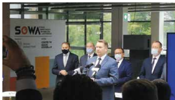
Spotkanie z Ministrem Edukacji i Nauki Przemysławem Czarnekim w Piotrkowie Trybunalskim 20.09.2021. Program pilotażowy SOWA

Centrum Nauki Kopernik podpisał z Gminą Wieleń umowę, na nieodpłatne przekazanie ekspozycji w celu stworzenia wystaw oraz prowadzenia warsztatów. Gmina zobowiązuje się do przyjęcia, utrzymania i udostępniania publiczności wystaw oraz prowadzenia programów edukacyjnych dla społeczności lokalnej