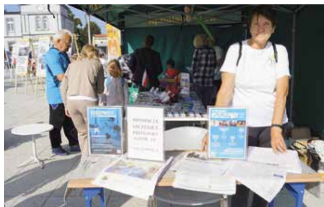
Wydarzenie towarzyszące - akcja informacyjno- promocyjna #szczepiMYgminy

Akcja „Narodowego Czytania” w Wieleniu zorganizowana została przez Nadnoteckie Centrum Kultury, 4 września 2021 roku na