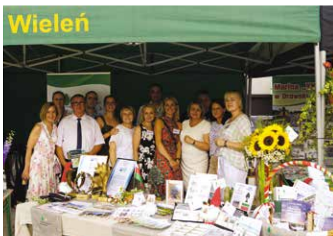
Stoisko promocyjno- informacyjne Gminy Wieleń podczas V Targów Produktu Lokalnego - „Z natury Najlepsze”