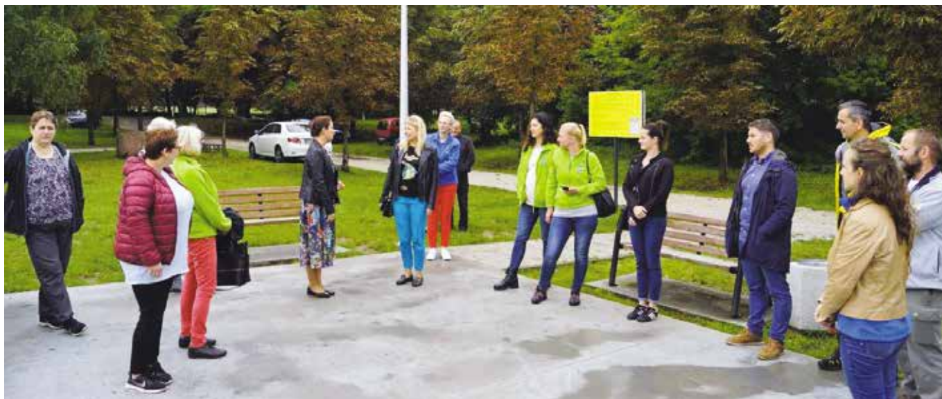
Wizyta studyjna członków NGR na obiekcie skateparku w Wieleniu