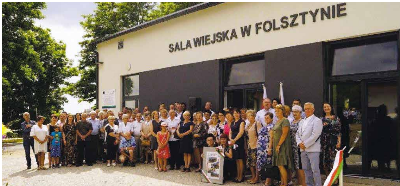
Otwarcie sali wiejskiej w Folsztynie, 27.06.2021 r.