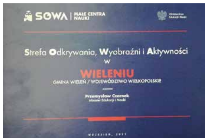
SOWA Strefa Odkrywania Wyobraźni Aktywności powstanie w Wieleńiu