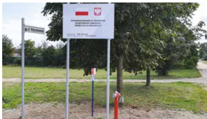
Budowa sieci wodociągowej w Rosku

Trwają prace budowlane dotyczące projektu „Rewitalizacja Wielenia szansą rozwoju Gminy”. Inwestycja dofinansowana jest ze środków Wielkopolskiego Regionalnego Programu Operacyjnego na lata 2014- 2020. W obrębie mediateki wykonano większość prac konstrukcyjnych ściennych oraz stropowych, a także część instalacji wewnętrznych. Wkrótce nastąpi montaż elementów konstrukcji dachu wraz z pokryciem dachowym. Na Przystanku Edukacja zrealizowano większość prac ziemnych, zbrojarskich oraz instalacji podziemnych. W kolejnym etapie prac wykonawca przystąpi do prac żelbetowych konstrukcyjnych, montażu obiektu kawiarenki oraz zagospodarowania wielofunkcyjnej przestrzeni, która ma powstać w wyniku realizacji tego zadania. Z początkiem lipca br. rozpoczęte zostały roboty budowlane związane z realizacją zadania pn. „Nadnoteckie Bulwary w Wieleniu”. W ramach zadania, na długości ponad pięciuset metrów wzdłuż brzegu Noteci, powstanie ciąg pieszo- rowerowy. Nabrzeże rzeki zostanie przeprofilowane, umocnione oraz wykonane zostaną dwa nabrzeża cu-