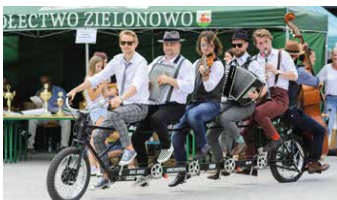
V Targi Produktu Lokalnego w Wieleniu, Orkiestra na Dużym Rowerze