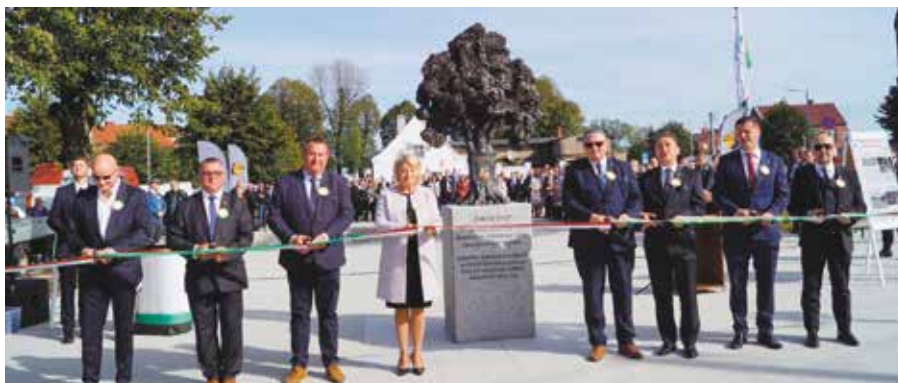
Uroczyste otwarcie „Nowego Miasta na Nowo” - po modernizacji

W obrębie rewitalizowanego obszaru zamontowano elementy skateboardingowe, parkour, maszty flagowe, ławki i stojaki rowerowe. Znalazło się także miejsce na podświetlaną fontannę typu plaza. W ramach realizowanego zadania zamontowano rzeźbę „Drzewo” symbolizującą nagrodę Burmistrza Wielenia w dziedzinie przedsiębiorczości.