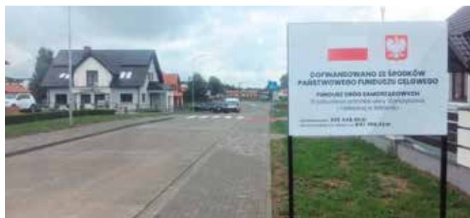
Odcinek ulicy Storczykowej po przebudowie

Zagospodarowany został skwer, który powstał przy skrzyżowaniu ulicy Fiołkowej i Storczykowej. Ciąg drogowy został wyposażony w oznakowanie pionowe i poziome. Oświetlenie przy realizowanym odcinku drogi zostało wybudowane w ramach wcześniej realizowanych zadań gminy. Dalsze odcinki oświetlenia osiedla Zatorze realizowane będą w latach 2020- 2021 w ramach odrębnego zadania inwestycyjnego. Wybudowane odcinki dróg oznakowano tablicami informującymi o dofinansowaniu z „Funduszu Dróg Samorządowych” zgodnie z wymogami programu.