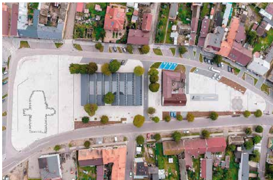
„Nowe Miasto na Nowo”, publikacja za najbardziej popularnym portalem na świecie piszącym o designie i architekturze https://www.designboom.com/architecture/neostudio-modular-steel-structures-marketplace-reconstruction-poland-10-28-2020

Przecięcia wstęgi dokonano przy rzeźbie „Drzewo”- symbolu wartości wielęńskiego samorządu: osiągać najwyższy wzrost, roz-