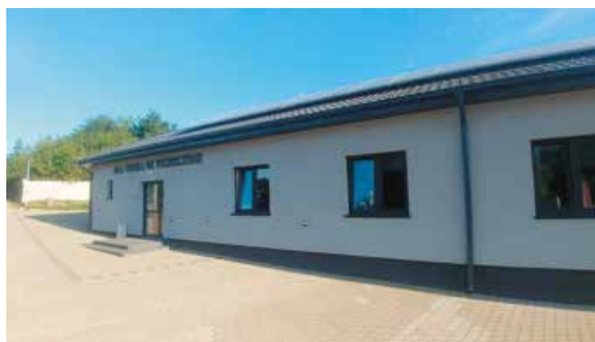
Sala wiejska we Wrzeszczynie po modernizacji

We współpracy z Zarządem Dróg Powiatowych zrealizowano zadanie polegające na polepszeniu nawierzchni gruntowej drogi powiatowej- odcinka drogi Wielen- Mężyk. Zadanie realizowane jest