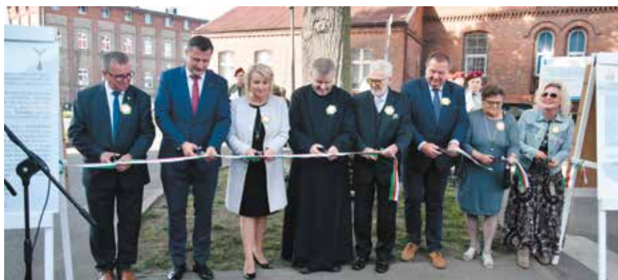
Odświeżenie Tablicy „Dąb Arendt” na 100 - lecie Powrotu Ziemi Wielieńskiej do Macierzy

Insp. ds. współpracy ze społeczeństwem Referat Organizacyjny