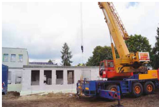
Prace przy układaniu stropu na obiekcie żłobka w Wieleniu