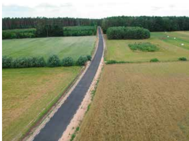
Droga Hamrzysko Krucz po przebudowie

Ze środków Wielkopolskiego Regionalnego Programu Operacyjnego na lata 2014- 2020 realizowane jest zadanie pn. „Rewitalizacja Wielenia szansą rozwoju Gminy”. W roku 2020 zakończono prace związane z pierwszym modułem tego projektu - „Nowe Miasto NA NOWO”. W ramach tego modułu wykonano utwardzenie płyty rynku oraz przestrzeni wokół obiektu targowiska miejskiego. Wybudowano elementy zagospodarowania przestrzeni publicznej, w tym elementy skateboardingowe i parkourowe. Z uwagi na charakter przestrzeni wykorzystywanej głównie jako miejsce handlu zamontowana została rzeźba „Drzewo”- symbol przedsiębiorczości i rozwoju gospodarczego. W obrębie zagospodarowanego placu zamontowano fontannę typu plaza. W ramach zadania zagospodarowano tereny zielone oraz podświetlono zielenią wysoką. Cały teren wyposażony został w system monitoringu. Przebudowano także odcinek ulicy Nadnoteckiej. Przy ulicy Nowe Miasto zainstalowano także wiatę przystankową, która będzie wykorzystywana jako przystanek komunikacji zbiorowej z chwilą rozpoczęcia prac na Przystanku „Edukacja”, który stanowi kolejny moduł projektu rewitalizacyjnego. Na wyłonienie wykonawcy prac tego zadania ogłoszony zostanie wkrótce przetarg nieograniczony. Projekt rewitalizacji to także obiekt me-