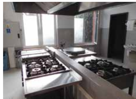
Zaplecze kuchenne przy oddziałach przedszkolnych