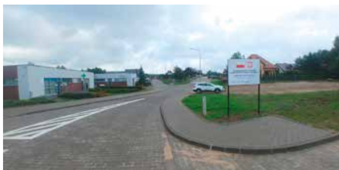
Ulice Storczykowa i Fiołkowa po przebudowie widok od strony drogi wojewódzkiej

Zakres rzeczowy zadania obejmował wykonanie nawierzchni jezdni z kostki betonowej polbruk oraz obustronnych chodników na odcinku ulicy Storczykowej i Fiołkowej w Wieleniu. W ramach prac wybudowane zostały przykanaliki pozwalające na odwodnienie realizowanego odcinka drogi poprzez odprowadzenie wód opadowych do istniejącej sieci kanalizacji deszczowej. Drogę włączono w pas drogi wojewódzkiej nr 135 (ul. Potrzebowicka), przy której wybudowana została zatoka autobusowa wraz z wiatą przystankową. W ramach prac budowlanych ułożona została nawierzchnia drogi technologicznej z płyt betonowych ażurowych do obiektu przepompowni ścieków przy ulicy Potrzebowickiej.