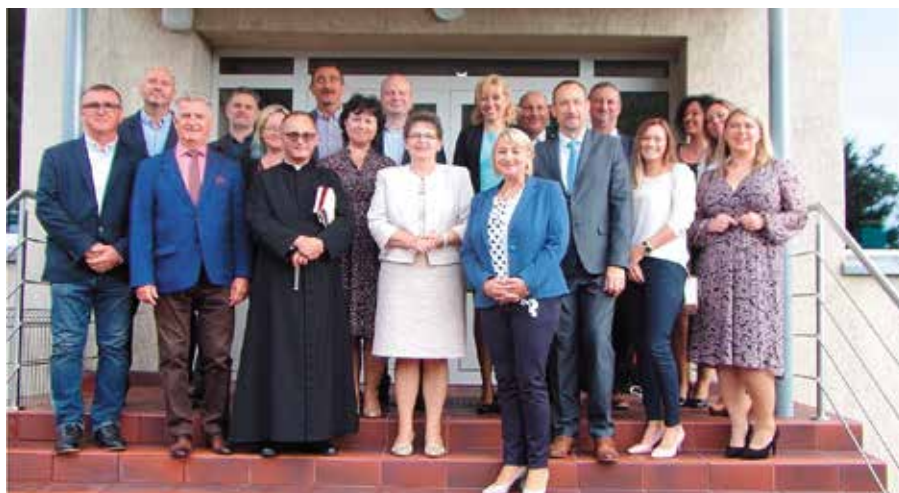
Otwarcie oddziałów przedszkolnych w SP II w Wieleniu

W ramach prac adaptacyjnych powstały trzy przestrzenne izby przedszkolne wraz z łazienkami zlokalizowanymi przy każdej Sali. Do tej pory, w budynku przed-