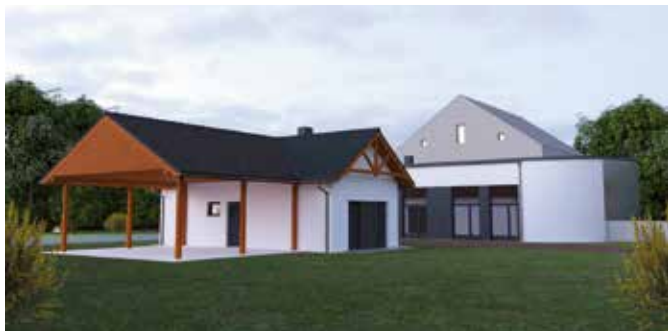
Koncepcja projektowa sali wiejskiej w Folsztynie

Zajęcia wraz z animatorem odbywać się będą w następujących zakresach: utworzenie dziecięcego zespołu tanecznego „Bocianie Gniazdo,” wieczory gier planszowych i zajęć sportowych, zajęcia stacjonarne i wyjazdowe dla seniorów. Zapraszamy!