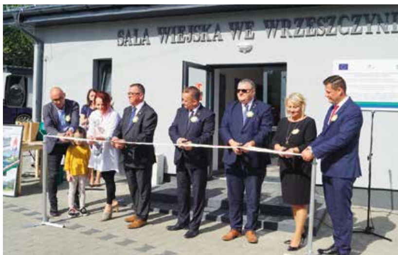
Otwarcie sali wiejskiej we Wrzeszczynie