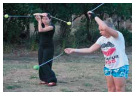
Treningi wymagają dużej precyzji

„M-Fire” to grupa kuglarska złożona z młodzieży z Miałów i Mężyka, która powstała w ramach projektu „Ogień nas połączy”. Projekt otrzymał dofinansowanie w konkursie „Wielkopolska Wiara 2015”. Młodzi ludzie przygotowują się do pierw-