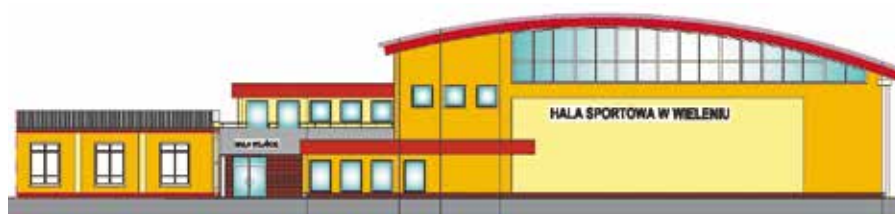
ELEWACJA OD STRONY UL. JARYŃSKIEJ (FRONTOWA)

W ramach zadania wybudowany zostanie obiekt hali sportowej pełniący również funkcje widowiskowe. Hala sportowa w Wieleniu posiadać będzie arenę sportową o wymiarach 24,5 m x 44,5 m z możliwością podziału kurtynami na trzy niezależne boiska. Oprócz areny sportowej znajdują się tu miejsca na salę fitness, siłownię, zaplecze szatniowo-sanitarne, pokoje nauczycieli, trenerów, magazyn sprzętu sportowego oraz widownię na 300 miejsc. Zagospodarowany zostanie również teren przyległy do obiektu- planowane jest wykonanie parkingu dla samochodów osobowych, zatoki dla autobusów oraz nasadzenia zieleni.