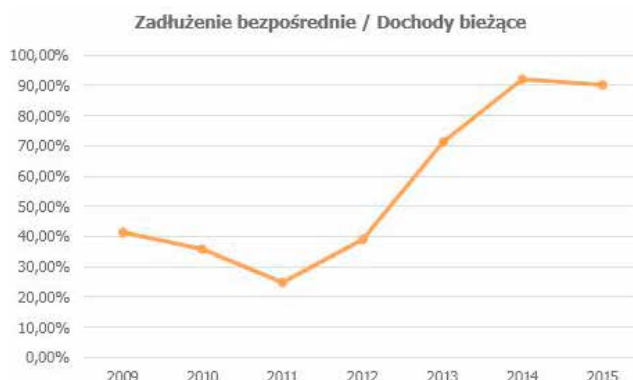
Wysokość zadłużenia w stosunku do dochodów bieżących w poszczególnych latach

Przed radnymi i Panią burmistrz stoją trudne zadania. Jednym z najważniejszych będzie opracowanie budżetu na przyszły rok. Jak go stworzyć? Gdzie szukać oszczędności? Jedno jest pewne, że decyzje, które zostaną podjęte niebawem będą miały swoje przełożenie, nie tylko na najbliższy rok, ale i na kolejne lata. Podczas ostatniej sesji burmistrz Elżbieta Rybarczyk zaapelowała do radnych, softysów, dyrektorów o rzetelną współpracę na rzecz przyszłości gminy. Co to oznacza w praktyce? Trzeba przede wszystkim racjonalizować wydatki oraz przyjrzeć się funkcjonowaniu i sposobom zarządza-