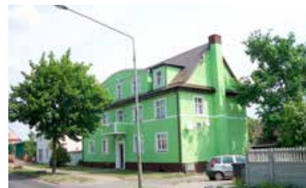
Budynek Wspólnoty Mieszkaniowej przy ul. Jana Pawła II 19 w Wieleniu po remoncie dachu, elewacji i przemurzeniu komina