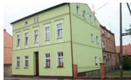
Budynek Wspólnoty Mieszkaniowej przy ul. Kościuszki 3 w Wieleniu po wykonanym remoncie

Większość budynków, którymi zarządza Administracja Budynków Komunalnych zostało wybudowanych przed 1945 rokiem. Powoduje to, że substancja mieszkaniowa Gminy Wielen jest w złym stanie i wymaga ciągłych remontów. W bieżącym roku ABK wykonała szereg prac remontowo-budowlanych przeznaczając na to 622 tys. zł. (stan na 30.09.2015 rok). Były to usługi dekarские, zdunskie, elektryczne, wodno-kanalizacyjne. Jednocześnie Administracja Budynków Komunalnych jako Zarządca ponosi koszty związane z budynkami gminnymi takie jak: ubezpieczenia, przeglądy techniczne, sanitarne, elektrycz-