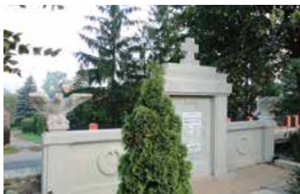
Mogiła powstańców w Rosku to jeden z najważniejszych symboli walk w tej miejscowości