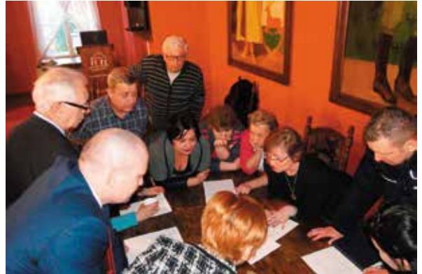
Spotkania konsultacyjne cieszyły się sporym zainteresowaniem

Do końca br. uchwalony zostanie Plan Gospodarki Niskoemisyjnej Gminy Wielen, opracowany przy współfinansowaniu Unii Europejskiej ze środków Funduszu Spójności, w ramach Programu Operacyjnego Infrastruktura i Środowisko. Dokument ten będzie stanowił obligatoryjny załącznik w konkursach przy aplikowaniu o środki na projekty z zakresu szeroko pojętej termomodernizacji. Skorzysta z niego będzie mógł nie tylko samorząd gminny, ale również przedsiębiorstwa, spółdzielnie mieszkaniowe, czy też inwestorzy prywatni, którzy zamierzają aplikować w kolejnym okresie programowania o środki zewnętrzne na projekty termomodernizacyjne. Myślą przewodnią dokumentu jest dokonanie analizy i wskazanie kierunków działań władz lokalnych w perspektywie najbliższych 6 lat w zakresie zarządzania energią w gminie. Istotą Planu jest zapewnienie korzyści ekonomicznych, społecznych i środowiskowych, w tym przede wszystkim: rozwój technologii niskoemisyjnych ukierunkowanych na kluczowe