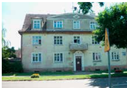
Budynek Wspólnoty Mieszkaniowej przy ul. Jana Pawła II 19 w Wieleniu przed remontem

Zostały wyremontowane budynki Wspólnot Mieszkaniowych, w których Gmina zgodnie z posiadaniem udziałem ponosiła koszty remontów. Mowa tu o takich budynkach jak: budynek Wspólnoty Mieszkaniowej przy ul. Błonie 9 w Wieleniu (wykonano remont dachu i remont elewacji 2 ścian), Kościuszki 3 (remont elewacji), Plac Zwycięstwa 8-10 (remont elewacji), Nowe Miasto 34 (remont elewacji), Jana Pawła II 19 w Wieleniu (remont pokrycia dachowego, elewacji oraz przemurzenie komina), Mężykowska 2,3,4 w Miałach (remont elewacji na budynku bloku nr 3) oraz budynek Wspólnoty Mieszkaniowej w Folsztynie 35 (remont elewacji).