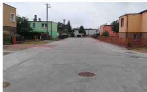
Nowa nawierzchnia ul. Sikorskiego w Wieleniu

długości 92,6 m od skrzyżowania z drogą powiatową (ul. Mężykowska). Wybudowano odcinek drogi o szerokości 5,5 mb z obustronnymi chodnikami i wjazdami na posesje. W ramach zadania wykonano