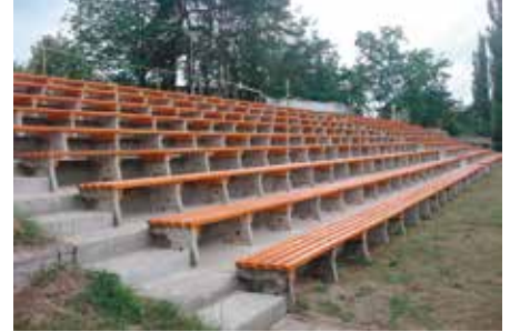
Odnowione trybuny na kortu miejskim w Wieleniu

W okresie letnim na terenie ulic Jana Pawła II, Piłskiej oraz Alei Zamkowej pojawiły się nowe ławki, które ustawiono tu przede wszystkim z myślą o osobach przemierzających się między prawo- a lewo-brzezną częścią Wielenia. Jednocześnie w celu utrzymania porządku w pobliżu każdej ławki postawiono kosz na śmieci. Całkowi-