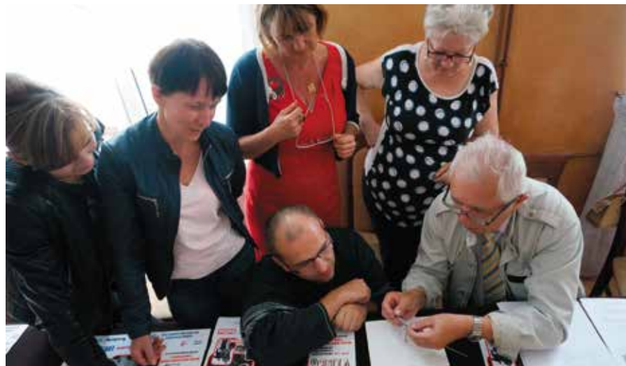
Liderzy lokalni podczas warsztatów byli dla siebie wsparciem