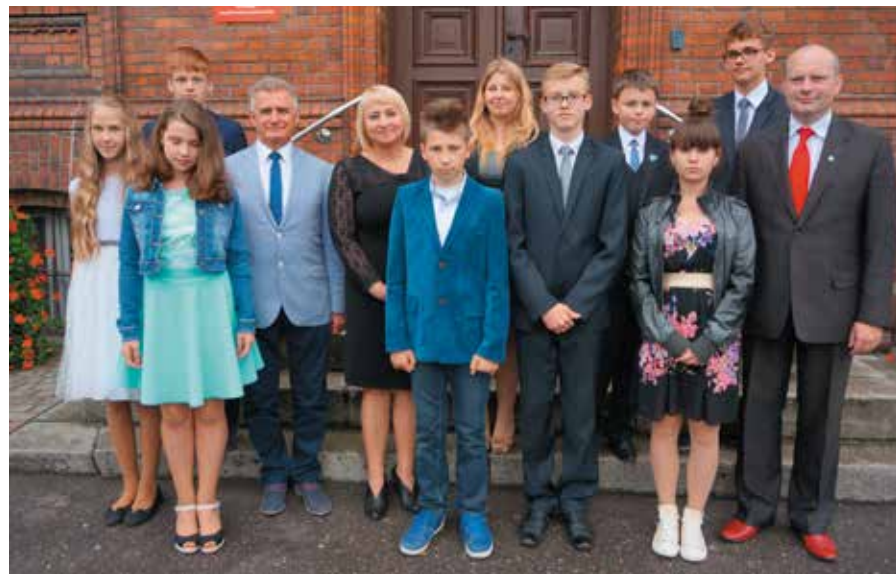
Nagrodzeni uczniowie wspólnie z przedstawicielami samorządu