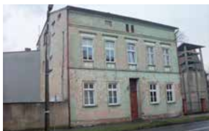
Budynek Wspólnoty Mieszkaniowej przy ul. Kościuszki 3 w Wieleniu przed remontem elewacji