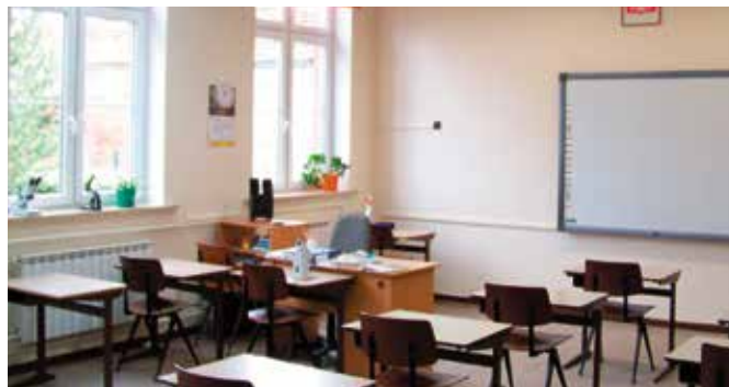
Jedna z klas po remoncie w Szkole Podstawowej w Dzierżąźnie Wielkim

podłodze została położona wykładzina termozgrzewalna. Pracom remontowym poddano również szatnię przylegającą do tego pomieszczenia oraz schody wejściowe do budynku.