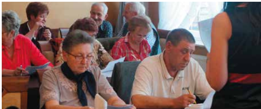
Organizacje pozarządowe wypracowały Program na przyszły rok