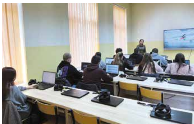
Nowa pracownia języka angielskiego w ZS Wieleń

W ramach „Kompleksowego programu rozwoju kształcenia zawodowego uczniów Technikum im. hetmana Stefana Czarnieckiego w Wieleń” odbywają się m.in. kursy dedykowane zarówno dla informatyków, jak i logistików: