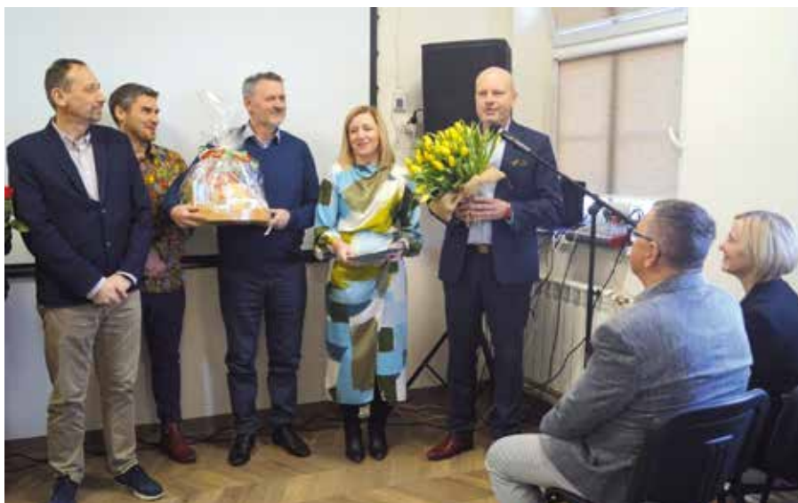
Gratulacje z okazji uruchomienia Klubu Senior + w Wieleniu złożyli dyrektorzy i kierownicy gminnych jednostek organizacyjnych

Osoby starsze często są wyobcowane. Nie mieszkają już z dziećmi, nie pracują, często stracili małżonków. Sytuacja ta skłania osamotnione osoby do obniżenia poczucia własnej wartości, stanów depresyjnych lub po prostu braku pomysłu na wypełnienie wolnego czasu. Z pomocą przychodzą Kluby Seniora , które nierzadko określa się jako ośrodek wsparcia, gdyż są panaceum na samotność, apatię, odrętwienie i wycofanie społeczne. To tu mogą przyjść starsze osoby, które są lub czują się samotne. Praca w grupie pozwala na powrót do aktywnego życia społecznego i nawiązanie nowych znajomości. W grupie rówieśników seniorzy nie czują się niedołążni i mogą skonfrontować typowe dla nich pro-