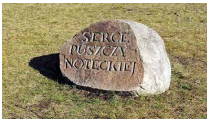
Pamiętkowy głaz w Puszczy Noteckiej, w Białej

Wieleń w „Sercu Puszczy Noteckiej” - to miasto z wielowiekową tradycją, któremu prawa miejskie nadane zostały w 1348 r. Gminę tworzy miasto - stary gród nadnotecki i oraz dziewiętnaście wsi sołeckich, w których zdecydowanie warto się zatrzymać. Bogata przyroda, zabytki naznaczone duchem historii, atrakcje turystyczne, gospodarstwa agroturystyczne decydują o unikatowości gminy, położonej w północno- zachodniej Wielkopolsce, w powiecie czarnkowsko- trzcianieckim. Na szczególną uwagę zasługuje rzeka Noteć, która przepływa wzdłuż rynku miasta, a jej dolina zwana jest europejskim korytarzem ekologicznym i stanowi biocentrum o znaczeniu międzynarodowym.