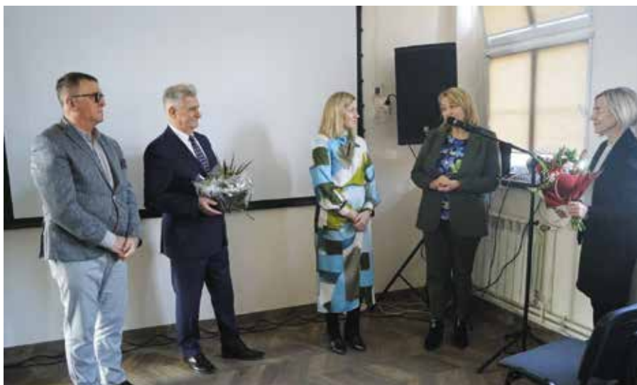
Przedstawiciele Samorządu Gminy Wielen złożyli podziękowania dyrekcji i pracownikom jednostki za zaangażowanie w powstanie Klubu Senior + w Wieleniu

blemy. Klub Senior+ wypełnia też wolny czas, by pomóc naszym seniorom odnaleźć sens życia i podjąć nowe wyzwania.