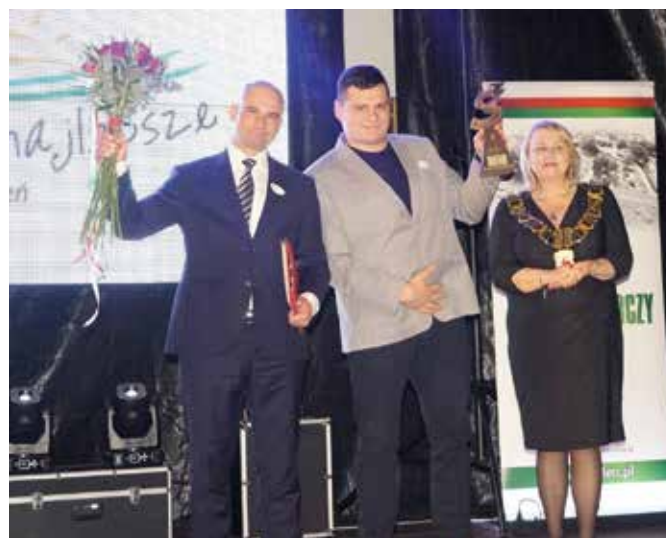
Stowarzyszenie Odnowy i Rozwoju Wsi MY GULCZ - Laureat Nagrody Burmistrza w dziedzinie kultury fizycznej i turystyki - statuetki SUKCES. Wielen, 17.02.2023 r.