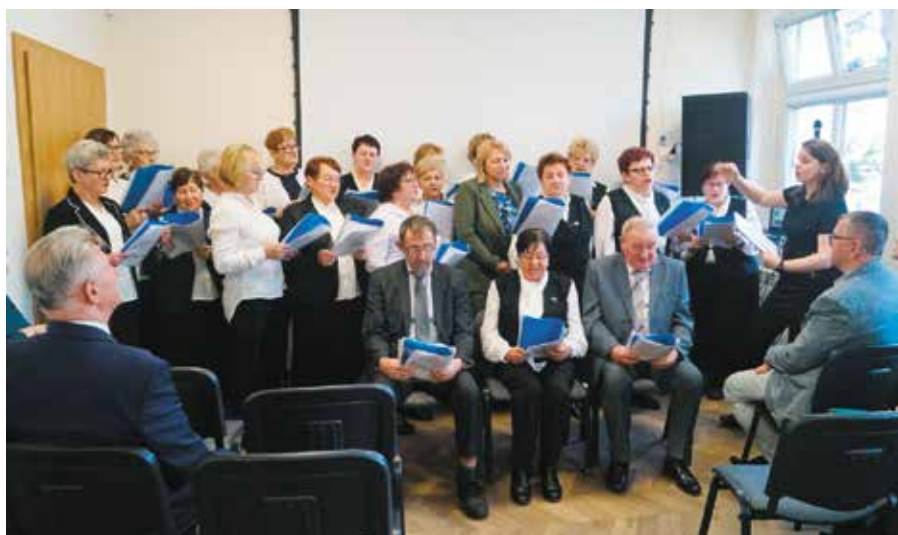
Występ seniorów z Klubów Seniora działających na terenie Gminy Wieleń

Seniorzy z gminy Wieleń mają swoje miejsce! Jesień życia kojarzy się często z bezczynnością i samotnością. Na szczęście coraz popularniejsze stają się kluby seniora, które organizują spotkania, warsztaty, prelekcje w dziedzinie zdrowia oraz pogadanki dotyczące bezpieczeństwa z Funkcjonariuszami Policji, Straży czy przedstawicielami Sądu dla osób w dojrzałym wieku, by nikt nie czuł się odizolowany. Z tą myślą pozyskano środki w ramach programu Senior + , by z nieczynnego budynku po Przedszkolu zrobić Klub Seniora w Wieleń.