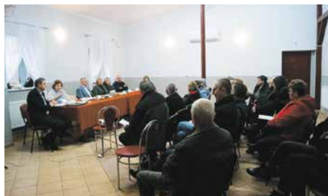
Zebranie wiejskie w Mężyku, 09.03.2023 r.

W trakcie zebrań omawiano wykonane budżety sołeckie i osiedlowe w 2022 r. oraz zadania inwestycyjne i remontowe zrealizowane w ostatnim okresie na terenie Gminy Wieleń. Przeprowadzone zostały konsultacje społeczne z mieszkańcami w zakresie projektów statutów sołectw i osiedli. Po zakończonych konsultacjach projekty statutów przedłożone zostaną Radzie Miejskiej w Wieleniu w celu ich uchwalenia. Mieszkańcy zapoznali się z planowanymi wydatkami w ramach funduszy sołeckich i osiedlowych