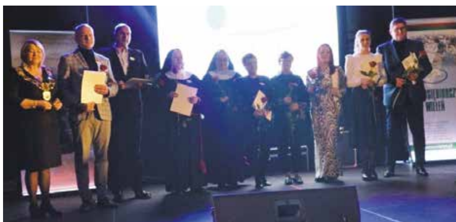
Podziękowania za współpracę na płaszczyźnie stowarzyszeń i organizacji działających w Gminie Wieleń

Film „Gmina Wieleń silna aktywnością swoich Mieszkańców”, ukazujący bogaty wachlarz różnorodnych aktywności podejmowanych w latach 2015 – 2023, zamknął oficjalną część uroczystości. Uroczyste spotkanie z Liderami Ziemi Wieleńskiej uświetnił koncert zespołu muzycznego „Ciała Pedagogiczne” w repertuarze Agnieszki Osieckiej. Wieczór zakończył się spotkaniem przy kawie.