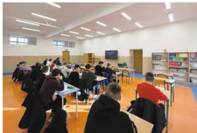
Nowa pracownia języka polskiego w ZS Wieleń

Dla młodego człowieka istotne jest, aby przestrzeń, w której przebywa, była dla niego atrakcyjna, dawała poczucie, że jest to miejsce dla niego bezpieczne, komfortowe. Przy szkolnym placu, wyrosła, można powiedzieć na fundamentach przeszłości Me-