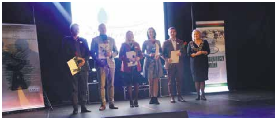
Dyrektorzy i kierownicy jednostek organizacyjnych Gminy Wieleń - Lokalnymi Liderami Ziemi Wieleńskiej

Stowarzyszenie Odnowy i Rozwoju Wsi „MY GULCZ ( Rok założenia: 2016) przyczyniło się do przyznania Sołectwu Gulcz nagrody finansowej w drugiej edycji konkursu „Aktywna Wieś Wielkopolska”. Nagrodę i statuetkę wręczono podczas Gali Liderzy Wielkopolskiej Odnowy Wsi 2018, która odbyła się w Wieleniu. Stowarzyszenie jest beneficjentem środków Programu Rozwoju Obszarów Wiejskich 2014 – 2020 na budowę budynku socjalno - sanitarnego (2019 rok), który wpisuje się w nowo powstały kompleks sportowo - rekreacyjny w Gulczu pod nazwą: „MY GULCZ ARENA”. Stowarzyszenie pozyskało środki z Czarnkowsko - Trzanieckiej Lokalnej Grupy Działania na budowę placu zabaw w Gulczu ( 2018 rok), a z Programu Odnowy Wsi na oświetlenie płyty boiska oraz od sponsorów na wykonanie trybun i pełnowymiarowej płyty boiska do piłki nożnej wraz z nawodnieniem.