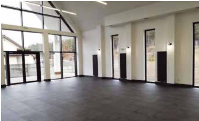
Sala wiejska Marianowo- Herburtowo