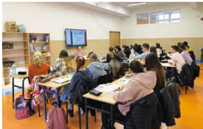
Izba lekcyjna w ZS Wieleń po przystosowaniu lokalu byłej siłowni na potrzeby oświatowe

Podnoszenie kwalifikacji zawodowych ułatwia młodemu człowiekowi wejście na wymagający rynek pracy. W tym roku szkolnym kontynuowane są projekty zainicjowane w poprzednich latach. Uczniowie zdobywają dzięki nim nowe umiejętności i podnoszą kompetencje zawodowe.