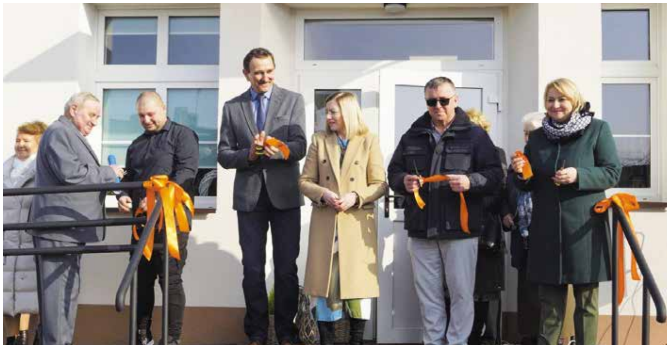
Oficjalne otwarcie Klubu Senior + w Wieleń, 16.02.2023 r.

Seniorzy z gminy Wieleń mają swoje miejsce! Jesień życia kojarzy się często z bezczynnością i samotnością. Na szczęście coraz popularniejsze stają się kluby seniora, które organizują spotkania, warsztaty, prelekcje w dziedzinie zdrowia oraz pogadanki dotyczące bezpieczeństwa z Funkcjonariuszami Policji, Straży czy przedstawicielami Sądu dla osób w dojrzałym wieku, by nikt nie czuł się odizolowany. Z tą myślą pozyskano środki w ramach programu Senior + , by z nieczynnego budynku po Przedszkolu zrobić Klub Seniora w Wieleń.