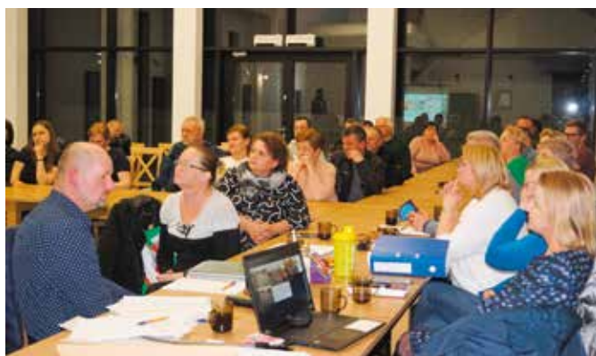
Zebranie wiejskie w Marianowie dla sołectw Marianowo i Herbutowo, 14.03.2023 r.

Po dwuletniej przerwie spowodowanej obostrzeniami covidowymi, w okresie od 27 stycznia do 22 marca 2023 r. odbyły się zebrania wiejskie i osiedlowe z mieszkańcami.