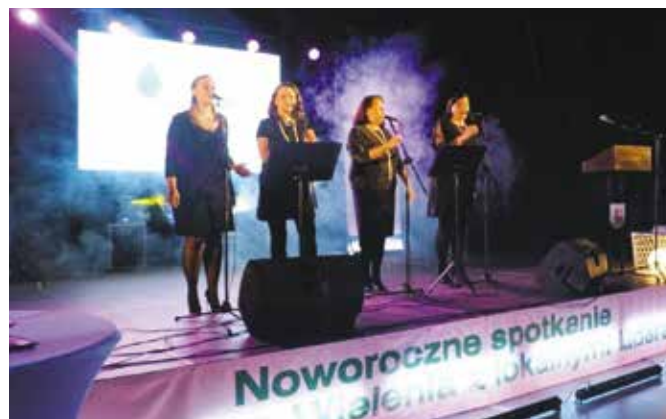
Koncert w wykonaniu zespołu Ciąła Pedagogiczne