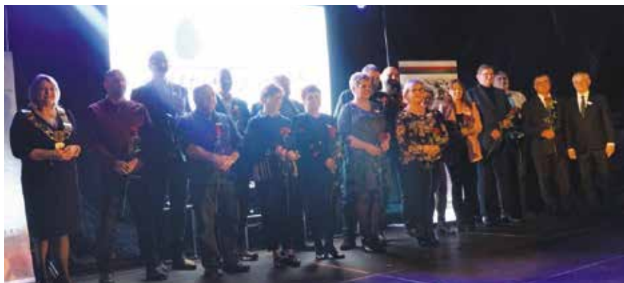
Podczas spotkania z Lokalnymi Liderami Burmistrz Wieleń podkreśliła zaangażowanie sołectw i osiedli w harmonijny rozwój Miasta i Gminy