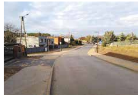
Drugi po przebudowie na osiedlu pomiędzy ul. Drawską a osiedlem Przytorze

Opracowanie: Radosław Janecki Kierownik Referatu Techniczno- Inwestycyjnego Urzędu Miejskiego w Wieleniu