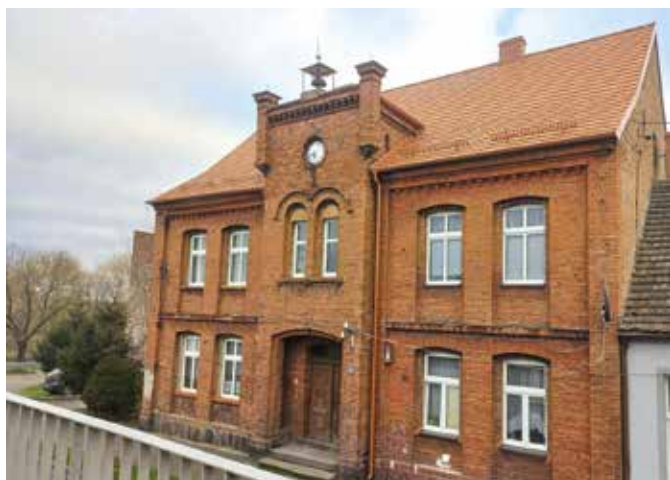
Budynek przy ul. Plac Powstańców 3 w Wieleniu po remoncie dachu 2022 r.

Przez okres pandemii zgodnie z ustawą eksmisje były wstrzymane. W tym roku zgodnie z przepisami prawa, istnieje możliwość dokonywania eksmisji z lokalu. Zatem od 1 kwietnia 2023 Administracja Budynków Komunalnych wznawia postępowania eksmisyjne w stosunku do osób z długotrwałym zadłużeniem z tytułu nieopłacania czynszu za lokal mieszkalny oraz za media z nim związane tj. (woda, ścieki, odpady komunalne).