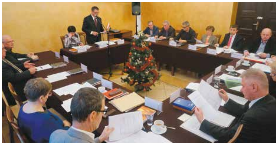
Radni w ostatnim czasie przegłosowali ważne uchwały

skoemisyjnej Gminy Wielen”. Dokumenty będą ważnymi załącznikami w wyścigu po środki unijne.