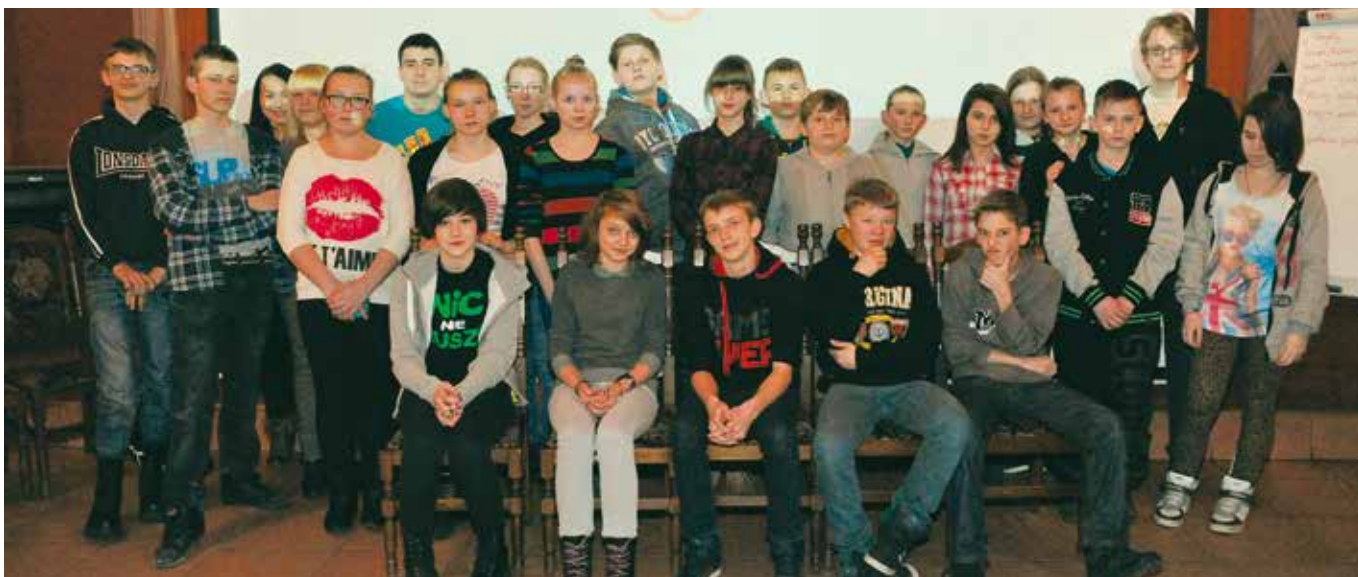
Dwa lata temu młodzież włączyła się w tworzenie telewizji internetowej, portalu. Dzięki projektowi nastąpi jego reaktywacja