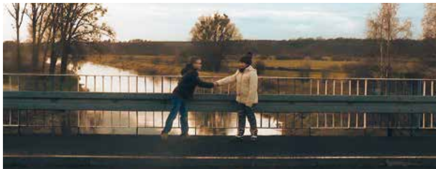
Symboliczne Dwa brzegi Noteci mają zjednoczyć gminę Wielen