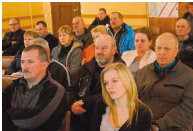
Mieszkańcy z Miałów licznie przybyli na swoje zebranie

Zebrania były okazją do przedstawienia potrzeb mieszkańców i zasygnalizowania problemów, z którymi się borykają. Uwagi dotyczyły najczęściej spraw związanych z utrzymaniem dróg, budowy nowych chodników, estetyki miejscowości, ale także spraw społecznych. Pieniądze z kasy gminy, a także fundusze sołeckie i osiedlowe nie wystarczą na wszystkie potrzeby. O tych trudnościach wiedzą samorządowcy, którzy już analizują postulaty i dokonują wyboru tych najpilniejszych. Samorządowcy obawiają się, że część wnio-