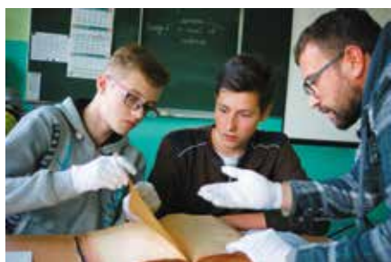
Uczniowie i historyk z Zespołu Szkół w Wieleniu podczas analizy dokumentu.

Kapitałnym źródłem umożliwiającym poznanie przeszłości naszego miasta, a przede wszystkim życia codziennego ówczesnych