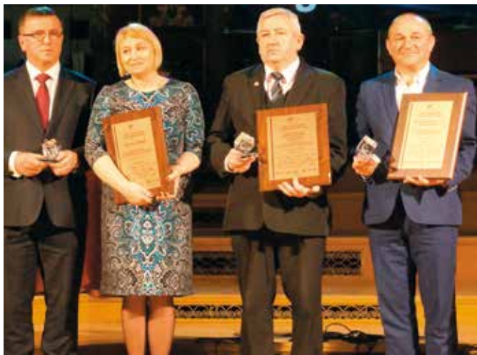
Gmina Wieleń spośród samorządów szczebla gminnego otrzymała najwyższe wyróżnienie

To nie pierwszy „HIT” dla samorządu wieleńskiego. W poprzednich latach wyróżniono działania w obszarze ochrony środowiska, poprawy bezpieczeństwa czy inwestycji wodociągowo-kanalizacyjnych. Tym razem to Złoty Hit, którym doceniono działania społeczne. Galę uświetnił koncert Moniki Kuszyńskiej. Organizatorem konkursu „Gospodarczo-Samorządowy HIT” jest Instytut Certyfikacji i Jakości Gospodarczo-Samorządowy HIT.