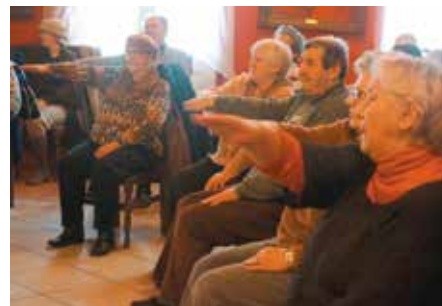
Seniorzy podczas warsztatów ćwiczyli umysł i ciało

Seniorzy z Roska i Wielenia skorzystali z Akademii, natomiast członkowie Klubu