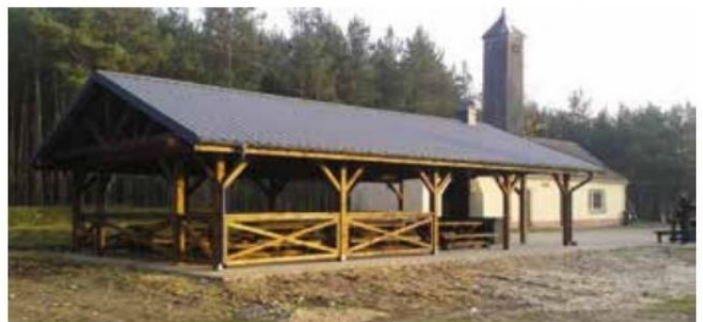
Wiąta rekreacyjna w Nowych Dworach