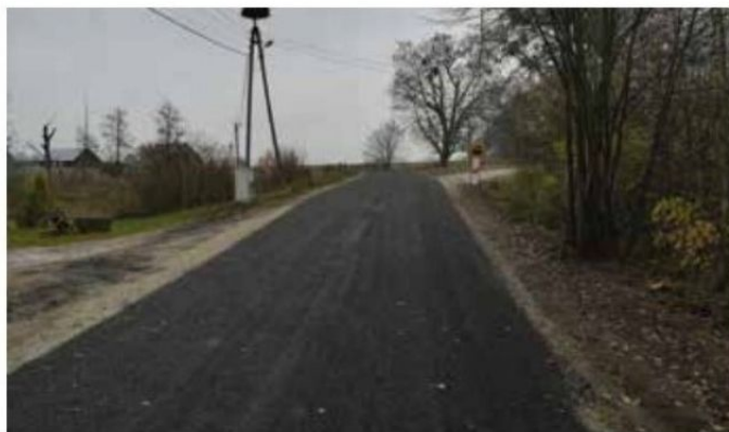
Droga w Herbertowie po przebudowie