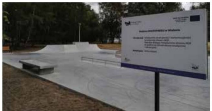
Skatepark w Wieleniu