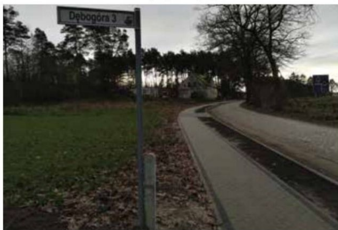
Chodnik przy drodze powiatowej w Dębogórze