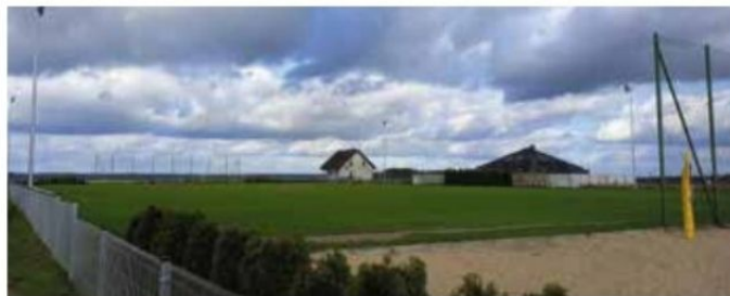
Boisko sportowe w Gulczu