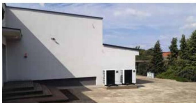
Pompy ciepła przy SP w Miałach