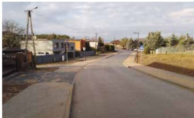
Ulica Akacyjowa po przebudowie dróg na osiedlu pomiędzy ul. Drawską a osiedlem Przytorze