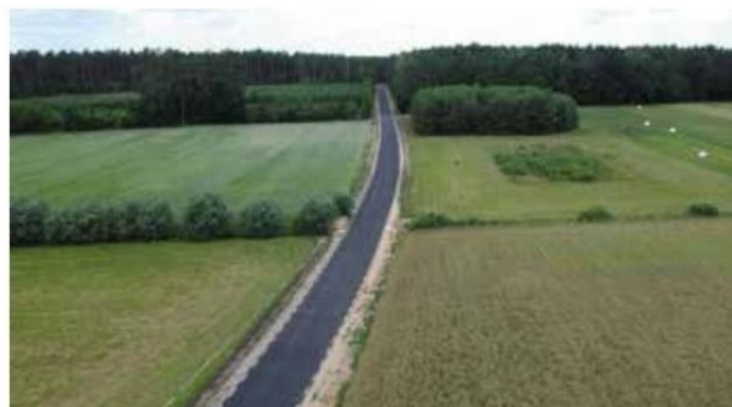
Droga Hamrzysko Krucz po przebudowie