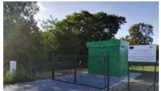
Stacja podnoszenia ciśnienia na trasie wodociągu do Białej, Hamrzyska i Mężyka