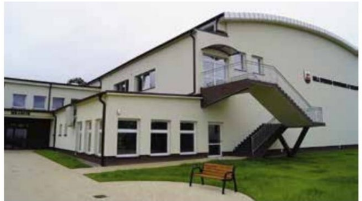
Hala sportowo- widowiskowa w Wieleniu