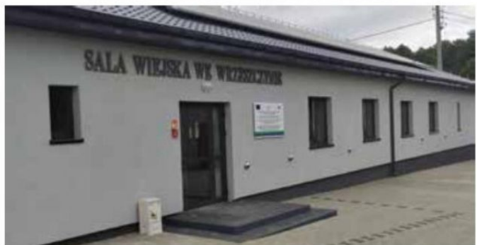
Sala wiejska we Wrzeszczynie