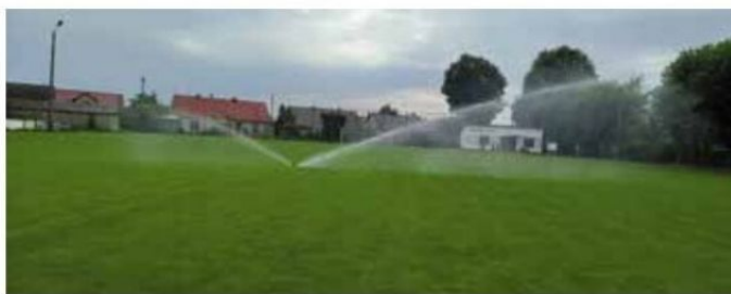
Nawodnienie płyty boiska w Rosku