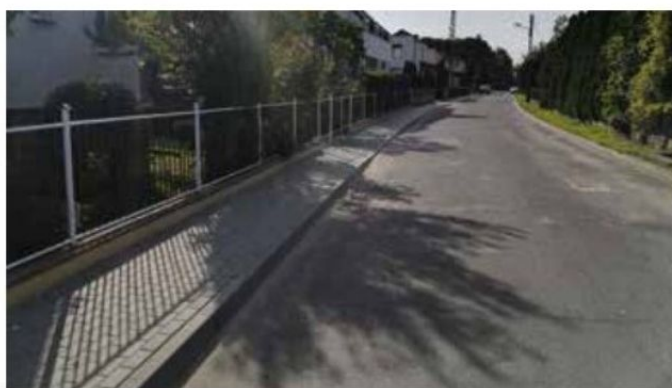
Odcinek chodnika przy ul. Nojiego w Wieleniu