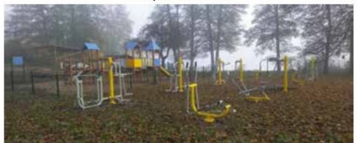
Plac zabaw i siłownia w Dzierżążnie Wielkim