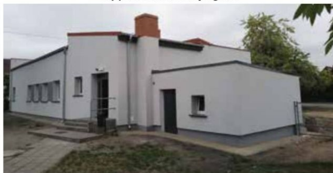
Obiekt tzw. małej szkoły SP nr 1 w Wieleniu po termomodernizacji