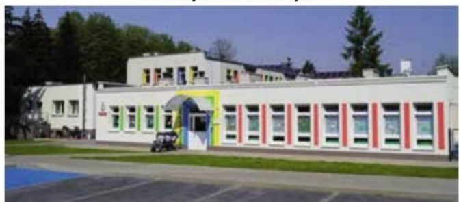
Żłobek w Wieleniu