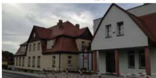
SP Rosko po termomodernizacji