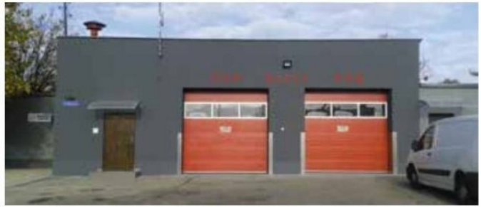
Remiza OSP Miały

Koszt ogółem: 133.200,00 zł, w tym środki zewnętrzne: 125.600,00 zł