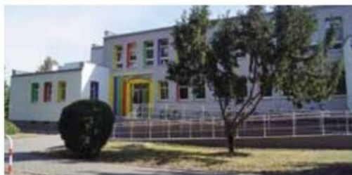
Przedszkole w Wieleniu po pracach termomodernizacyjnych

Koszt ogółem: 6.571.861,99 zł, w tym środki zewnętrzne: 4.438.630,08 zł