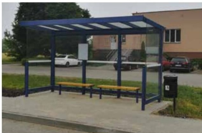
Wiata przystankowa przy ul. Międzyleskiej w Wieleniu