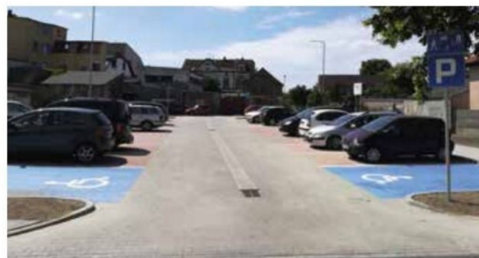
Parking przy ul Kasprzaka