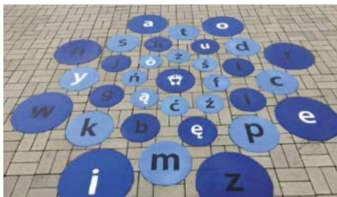
Gry podwórkowe w Dębogórze