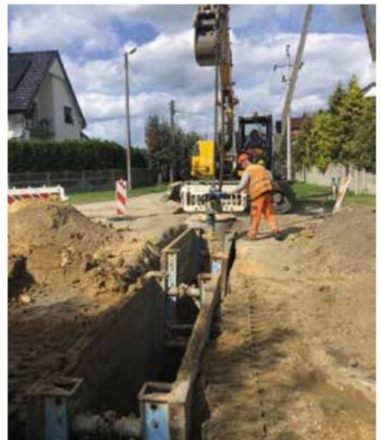
Kanalizacja deszczowa w Rosku w trakcie prac