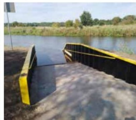
Przeźń miejska po przeprowadzeniu rewitalizacji