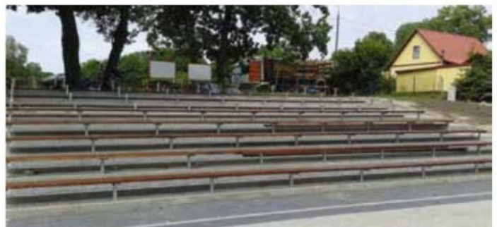
Trybuny amfiteatru wiejskiego w Dzierżążnie Wielkim