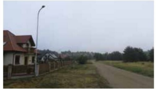
Oświetlenie na osiedlu Międzylesie w Wieleniu

Podczyszczalniki wód opadowych na wylotach sieci kanalizacji deszczowej w Gulczu i Rosku, zestawy naprawcze studni, czyszczenie sieci kanalizacyjnej. Koszt: 312.769,82 zł