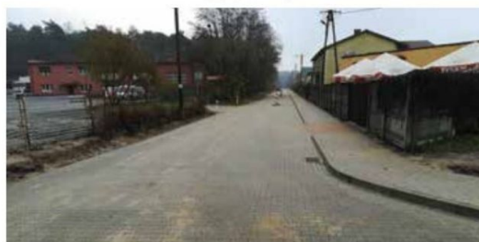
Ulica Sosnowa w Wieleniu po przebudowie