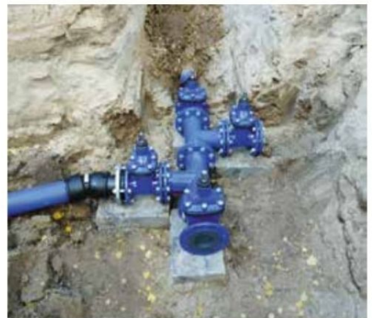
Sieć wodociągowa Gulcz. Wybudowanie w trakcie prac