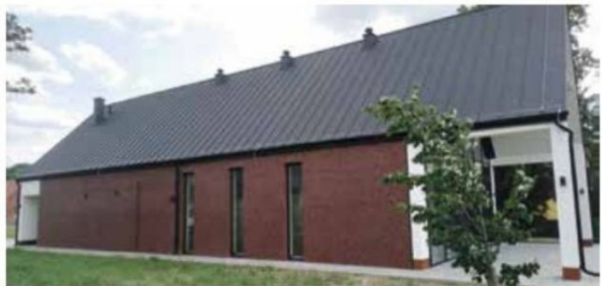
Sala wiejska dla sołectw Marianowo Herbertowo