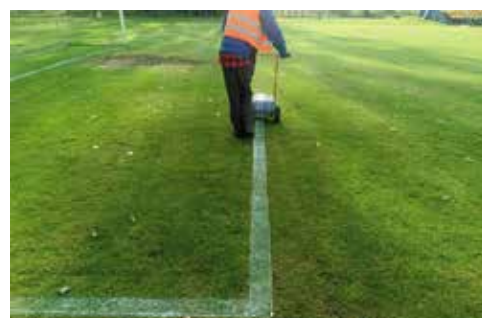
Przez większość roku CIS wykonuje prace porządkowe na terenie Stadionu Miejskiego w Wieleń. Do rutynowych zadań Centrum należy sprzątanie szatni, sanitariatów oraz koszenie murawy i malowanie linii boiska