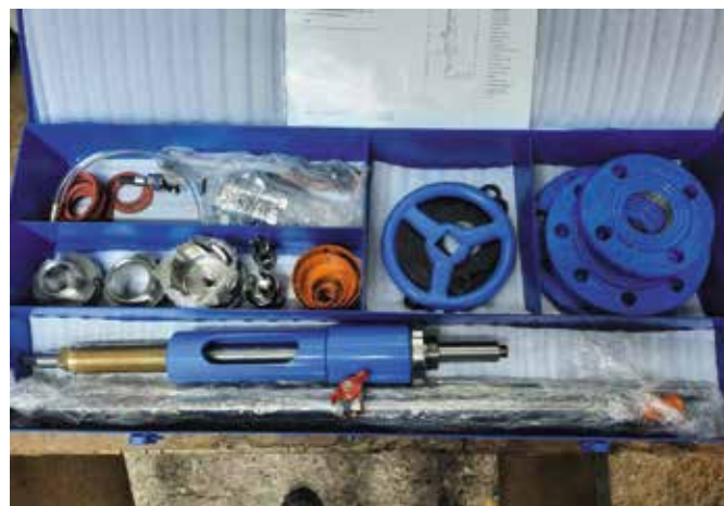
Zakupiono aparat do nawiercania rur firmy AKWA koszt ok. 5 tys. zł.