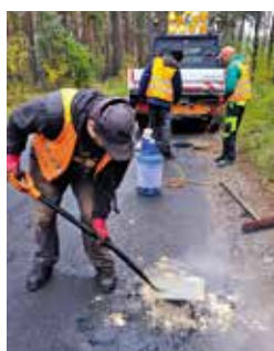
Grupa uczestników CIS wyspecjalizowana do napraw drobnych uszkodzeń gminnych nawierzchni asfaltowych