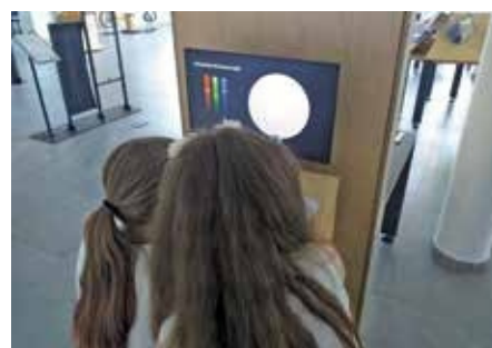
Centrum Rozwijania Wyobraźni SOWA w Wieleniu. warsztay dla dzieci i młodzieży 14.08.2025 r.