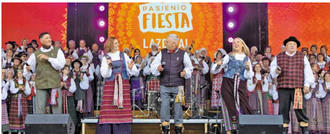
Prezentacja artystyczna podczas „Fiesty Pogranicza” w Łazdijai

Delegacja Gminy Wieleń w dniach 6 - 7 czerwca 2025 r. wzięła udział w cyklicznej sztandarowej imprezie międzynarodowej, organizowanej w Łazdijai - „Fiesta Pogranicza.” Tematem przewodnim uroczystości był „Dzień Pieśni – Radość Dzuki,” który podkreślił rok 2025 ogłoszony na Litwie - Rokiem Litewskiej Pieśni Ludowej. Organizatorzy zachycili uczestników gościnnością, kreatywnością i wysokim poziomem artystycznym wszystkich występujących na deskach litewskiej sceny. Delegacja Gminy Wieleń biorąc aktywny udział w wydarzeniu integrującym samorządy partnerskie Rejonu Łazdijai z Es-