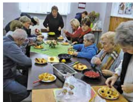
Zajęcia warsztatowe dla seniorów

orzeczenie traktowane na równi z orzeczeniem o znacznym stopniu niepełnosprawności.