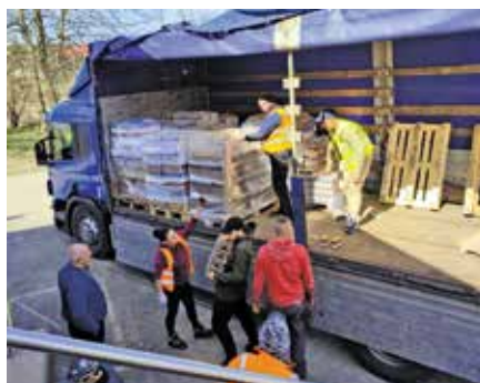
Rozładunek produktów z Banku żywności

MGOPS Wielen współpracuje z lokalnym wolontariatem („Lokalne Centrum