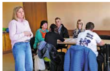
Kładziemy akcent na integrację społeczno - zawodową

Program kierowany jest do członków rodzin lub opiekunów, którzy wymagają wsparcia w postaci doraźnej, czasowej przerwy w sprawowaniu bezpośredniej opieki nad dziećmi z orzeczeniem o niepełnosprawności, a także nad osobami posiadającymi orzeczenie o znacznym stopniu niepełnosprawności albo