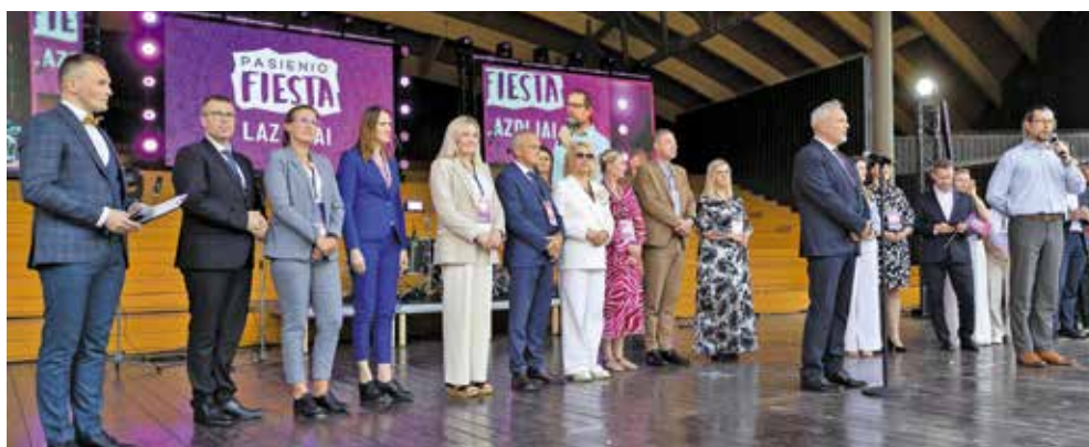
Łazdijai „Dzień Pieśni” - 6 czerwca 2025 r.

Polsko - litewskie partnerstwo międzynarodowe Gminy Wieleń z Rejonem Łazdijai daje powody do dumy i radości z oficjalnego partnerstwa samorządowego, które obfituje w wymianę dobrych praktyk, owocną współpracę, porozumienie i integrację wielopokoleniową.