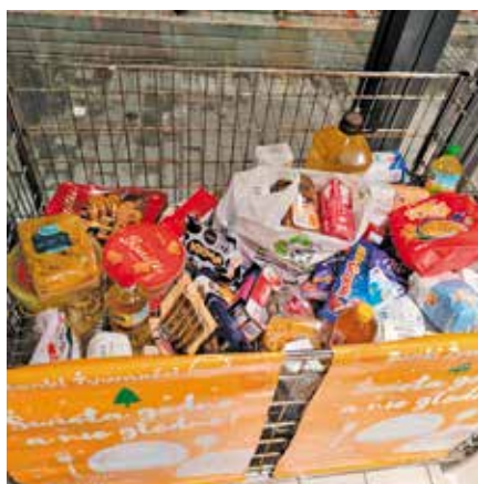
Zbiórka żywności - „Święta godne, a nie głodne”

Wolontariatu”), z harcerzami oraz z Pilskim Bankiem Żywności, z którym przez kilka lat wspólnie rozdysponował ponad 6 903 ton żywności i około 200 paczek żywnościowych dla osób w trudnej sytuacji. Z tego wsparcia korzysta rocznie około 1 600 osób . Co roku przed świętami prowadzi się świąteczne sprzątanie jak i zbiórkę żywności w lokalnych sklepach.