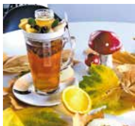
Uczestniczki warsztatu usługowo-handlowego cały rok dbają o wystrój wnętrza kawiarni, estetykę i jakość serwowanych dań oraz napojów w Przystanku Edukacja. Jesienią królują rozgrzewające herbaty oraz energetyczne ciasta i desery

Zakres usług świadczonych przez uczestników warsztatów nie jest zamkniętym katalogiem. Z każdym rokiem CIS poszerza swoją ofertę i specjalizacje, by jeszcze trafniej odpowiadać na potrzeby mieszkańców i jednostek samorządowych naszej gminy.