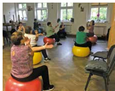
Projekt pn. Wsparcie seniorów, osób niepełnosprawnych i niesamodzielnych