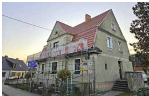
Budynek przy ul. Daszyńskiego 9 w trakcie wymiany pokrycia dachowego

Administracja Budynków Komunalnych dużą wagę przywiązuje do utrzymywania dobrych relacji z mieszkańcami. Dobra współpraca pomiędzy mieszkańcami a ABK ma się opierać na wzajemnym zaufaniu, szacunku i zaangażowaniu obu stron w sprawy wspólno-