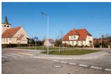
Parkingi Wieleń Północ