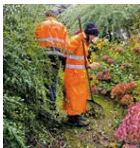
CIS wykonuje całoroczne usługi pielęgnacji zieleni na prywatne zlecenia. W 2025 roku ilość takich zleceń wzrosła dwukrotnie w porównaniu z rokiem ubiegłym