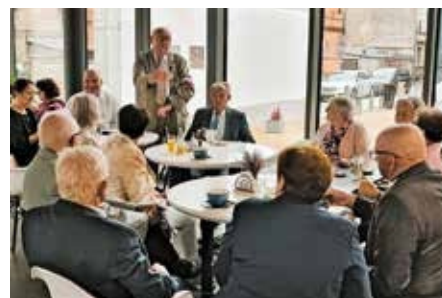
14 września 2025 r. Spotkanie przy kawie po Mszy Świętej w intencji Polskich Dzieci Wojny. Współorganizacja święta, Muzeum z wielńskim Oddziałem Związku Polskich Dzieci Wojny