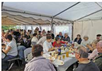
Imprezy integracyjne, wolontariat