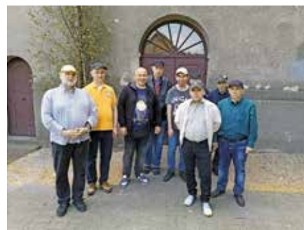
Lipiec 2025r., Spacer szlakiem obrazów Hermana Hana z mieszkańcami Domu Pomocy Społecznej przy ul. Chopina w Wieleniu

Organizatorem zaprezentowanych niżej wydarzeń było Muzeum Ziemi Wielńskiej, opiekunem grup oraz prelegentem i kuratorem wystaw był koordynator Muzeum, Marek Doczekalski.