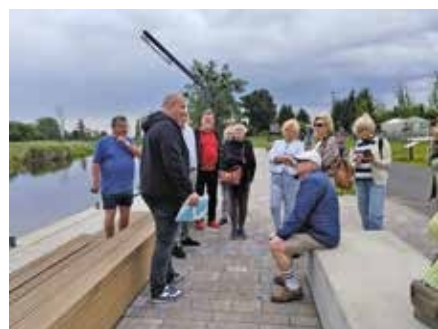
06.06.2025 r. Orowadzanie wycieczki, którą stanowiła grupa emerytowanych sędziów międzynarodowych piłki ręcznej