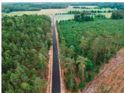
Droga Hamrzysko - Krucz