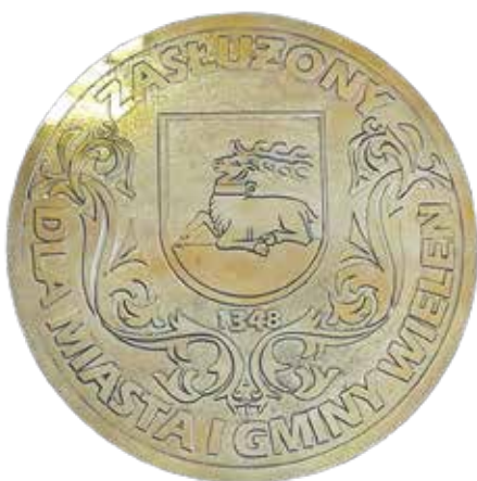
Wzór patery „Zasłużony dla Miasta i Gminy Wieleń” - zał. nr 2 do uchwały nr 49/VI/2024 Rady Miejskiej w Wieleniu z dnia 9 października 2024 r. w sprawie szczegółowych zasad oraz trybu nadawania tytułu

3.05.2025 r. Gminne Obchody Święta Konstytucji 3 Maja w Wieleniu - uroczystość w UM (Podjęcie uchwały nr 106/X/2025 RM w Wieleniu z dnia 2.04.2025 r. w sprawie nadania tytułu „Zasłużony dla Miasta i Gminy Wieleń”)