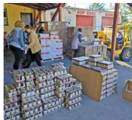
Bank żywności w ramach pomocy mieszkańcom

Dyrektor Miejsko - Gminnego Ośrodka Pomocy Społecznej w Wieleniu