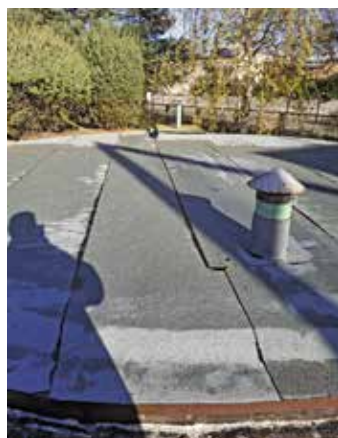
Wyremontowano dach na budynku Stacji Uzdatniania Wody oraz uszczelniono zimny zbiornik wody surowej na ul. Janka z Czarnkowa koszt ok. 58 tys. zł.