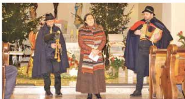
Trójgłosny, międzynarodowy koncert kolędników - dudziarzy odbył się w Kościele pw. św. Piotra i Pawła w Gulczu