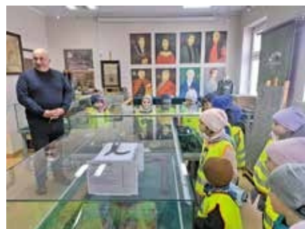
28.03.2025 r. Wizyta wychowanków Przedszkola Publicznego w Mikołajewie. Zwiedzanie Muzeum Ziemi Wielńskiej i miasta Wielenia