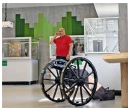
12.06.2025 r. w budynku wielńskiej Mediateki, siedzibie Nadnoteckiego Centrum Kultury w Wieleniu, miało miejsce otwarcie wystawy czasowej pt. Tradycje Kurkowego Bractwa Strzeleckiego w Wieleniu 1645 r.