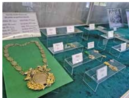
12 czerwca 2025 r. w budynku wielńskiej Mediateki, siedzibie Nadnoteckiego Centrum Kultury w Wieleniu. Otwarcie wystawy czasowej pt. Tradycje Kurkowego Bractwa Strzeleckiego w Wieleniu 1645 r.