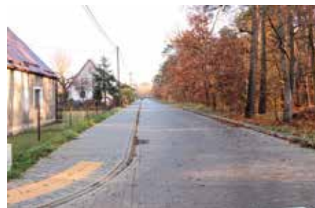
Drogi Wieleń Północ