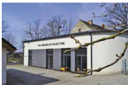
Sala wiejska w Folsztynie