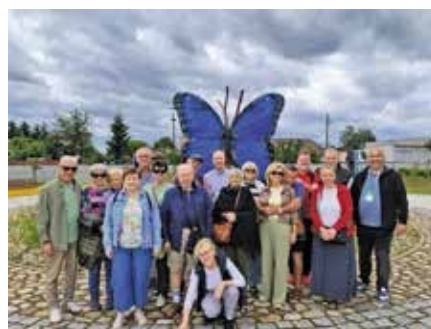
6 czerwca 2025 r. Orowadzanie wycieczki, którą stanowiła grupa emerytowanych sędziów międzynarodowych piłki ręcznej