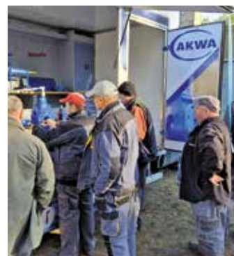
Spotkanie szkoleniowe z firmą AKWA

łączy bez zamknięcia dopływu wody. Zmodernizowano zbiornik wody surowej oraz wyremontowano dach na budynku socjalno-technicznym Stacji Uzdatniania Wody przy ul. Janka z Czarnkowa w Wieleniu. Zorganizowano także spotkanie szkoleniowe z firmą AKWA, podczas którego zaprezentowano nowe rozwiązania technologiczne i nowoczesne maszyny wykorzystywane w branży wodno-kanalizacyjnej. Dodatkowo, dla poprawy bezpieczeństwa, dokonano częściowej regulacji oraz wymiany włazów kanalizacji deszczowej na ul. Powstańców Wlkp. w Rosku oraz na ul. Drawskiej w Wieleniu.