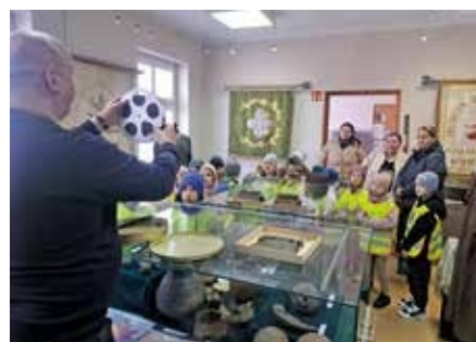
8 marzec 2025 r. Wizyta wychowanków Przedszkola Publicznego w Mikołajewie. Zwiedzanie Muzeum Ziemi Wielńskiej i miasta Wielenia