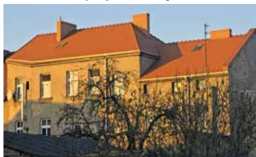
Budynek przy ul. Kasprzaka po remoncie dachu

ty. Jej podstawą jest przede wszystkim sprawna komunikacja. Mieszkańcy powinni mieć łatwy dostęp do informacji dotyczących funkcjonowania budynków, planowanych remontów, terminów opłat czy zasad korzystania z lokali. Z kolei administracja powinna być otwarta na kontakt i gotowa do udzielania pomocy, przyjmowania zgłoszeń oraz reagowania na potrzeby lokatorów.