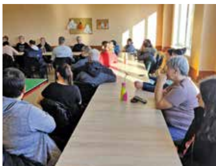
Projekt pn. Aktywna integracja w Gminie Wieleń

W roku 2025 Miejsko-Gminny Ośrodek Pomocy Społecznej w Wieleniu realizował