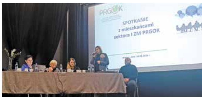
Spotkanie w Wieleniu, 10.02.2026 r.