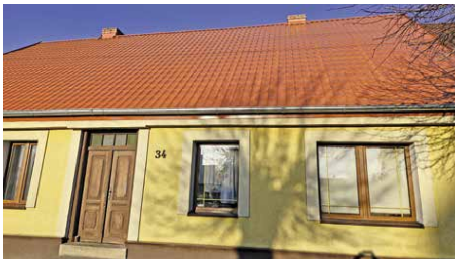
Wymiana pokrycia dachowego w budynku Wspólnoty Mieszkaniowej Nowe Miasto 34