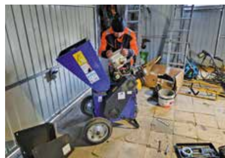
Przedsezonowe przeglądy i serwisy sprzętów spalinowych