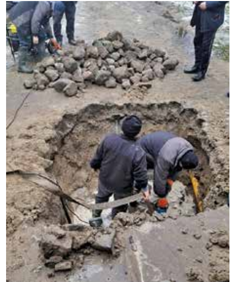
Usuwanie awarii przez służby techniczne PK „Noteć”

W ramach działalności Spółka wykonuje m.in.: przyłącza wodociągowe i kanalizacyjne, montaż zbiorników bezodpływowych, montaż bezzapachowych przydomowych oczyszczalni ścieków, montaż zbiorników na wody deszczowe, przeróbkę zbiorników bezodpływowych na przydomowe oczyszczalnie ścieków. Oferowane