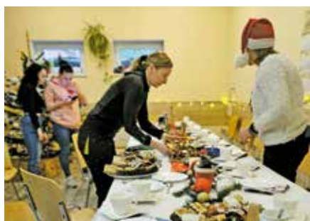
Spotkanie oplatkowe w Centrum Integracji Społecznej ARKA w Wieleń