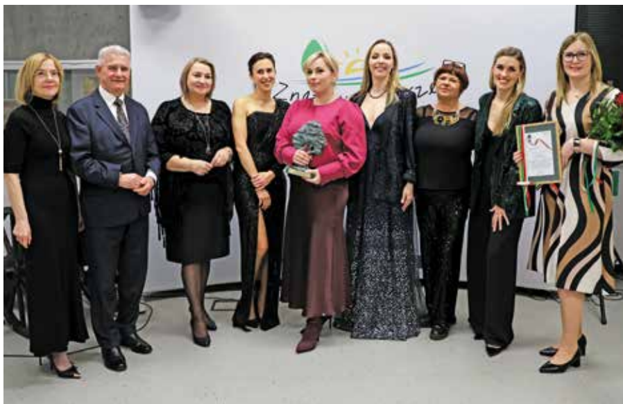
Spotkanie Noworoczne z Lokalnymi Liderami i Mieszkańcami. Wielen, 14.01.2026 r.

Decyzją Sejmiku RP, ustanowiono patronów roku 2026, wskazując postaci wybitne dla polskiej kultury, myśli społecznej i niepodległościowej: Józefa Czapskiego, Ignacego Daszyńskiego, Sergiusza Piaseckiego, Stanisława Staszica, Mieczysława Fogga oraz Józefa Maksymiliana Ossolińskiego. Podczas uroczystości wysłuchano utworów Mieczysława Fogga oraz słów Stanisława Staszica, które mimo upływu lat zachowują swoją aktualność i siłę oddziaływania. Rok 2026 będzie również rokiem Polskiego Radia, Polskiej Kolei oraz Profilaktyki Zdrowotnej – a więc wartości, które łączą komunikację, dostępność i odpowiedzialność za dobro wspólne. To wszystko tworzy szeroki, inspirujący kontekst dla naszej dzisiejszej rozmowy z Lokalnymi