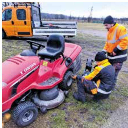
Przegląd stanu technicznego maszyn spalinowych