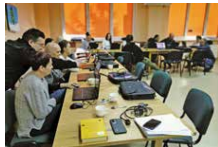
16-godzinne szkolenie z podnoszenia kompetencji cyfrowych, grupa I

Walka z zimą na pierwszej linii. Styczeń i luty zweryfikowały naszą wytrzymałość. Podczas największych mrozów i opadów śniegu, ekipy CIS pracowały często od wczesnych godzin porannych, dbając o bezpieczeństwo na kilometrach wieleńskich chodników. W dniach gołoledzi trzeba było wysypywać setki kilogramów piasku i soli drogowej. W najtrudniejszych dniach licznik ciągnika rejestrował po 10 motogodzin pracy. Poza mechanicznym odśnieżaniem, nasi uczestnicy z dużym poświęceniem ręcznie zabezpieczali ważne komunikacyjne miejsca, takie jak przejścia dla pieszych, skrzyżowania czy okolice szkół i przychodni. W chwilach odwilży skupialiśmy się na wywożeniu zalegającego śniegu oraz udrażnianiu studzienek kanalizacyjnych, by zapobiegać podtopieniom. Wszystkie ciepłe słowa i gesty życzliwości, które otrzymywaliśmy podczas mroźnych dni, były dla nas najlepszą motywacją do dalszego działania na rzecz dobra wspólnego naszej gminy.