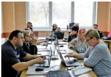
Szkolenie z kompetencji cyfrowych - Wielkopolska w cyfrowym świecie, grupa II