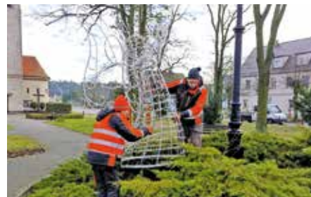
Montaż iluminacji świątecznych w przestrzeni publicznej - centralne miejsce w parku przy placu Zwycięstwa