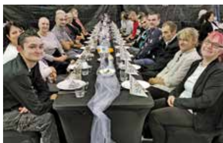
Spotkanie oplatkowe w Nadnoteckim Centrum Kultury organizowane przez Miejsko-Gminny Ośrodek Pomocy Społecznej