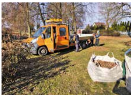
Przygotowania na nadejście wiosny - prace porządkowe w parkach i skwerach zieleni