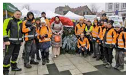
CIS zaangażowany w obsługę techniczną stoisk wystawowych podczas Jarmarku Bożonarodzeniowego - Targowisko Miejskie w Wieleniu