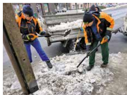
Wywożenie zalegającego śniegu