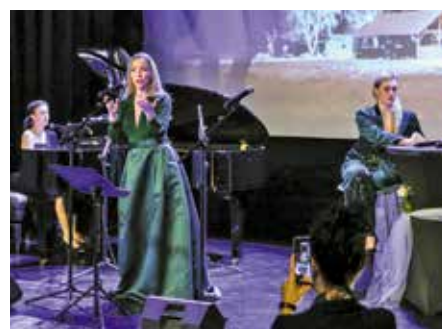
Spotkanie uświetnił koncert w ramach projektu „Viva La Diva”

Noworoczne wydarzenie było okazją, by podziękować wszystkim zaangażowanym lokalnie, przede wszystkim za