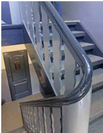
Remont klatki schodowej w budynku Wspólnoty Mieszkaniowej Plac Zwycięstwa 8,9,10

Zima jest corocznym testem sprawności organizacyjnej. Obecne działania potwierdzają stabilne funkcjonowanie jednostki oraz skuteczne utrzymywanie kontroli nad wyzwaniami, mimo ich skali.