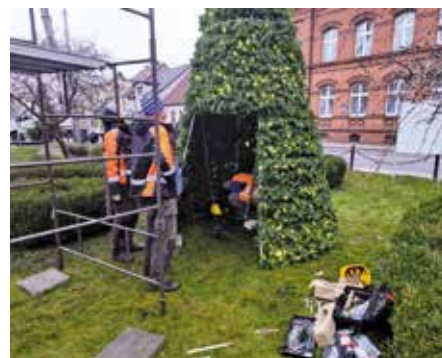
Montaż ozdobnych choinek - skwer zieleni przed Urzędem Miejskim w Wieleniu