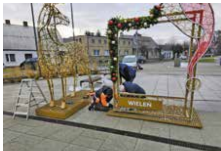
Montaż iluminacji świątecznych - Targowisko Miejskie w Wieleń