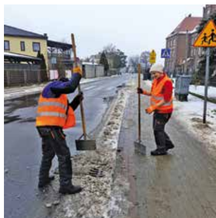
Udrażnianie studzienek odpływowych