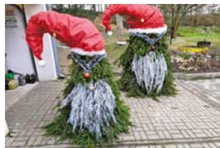
Własnoręcznie wykonane dekoracje świąteczne