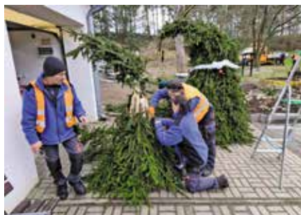
Własnoręczne wykonanie dekoracji świątecznych