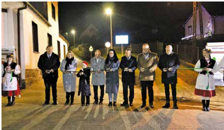
Uroczyste otwarcie dróg w Rosku po przebudowie, 20.12.2025 r.