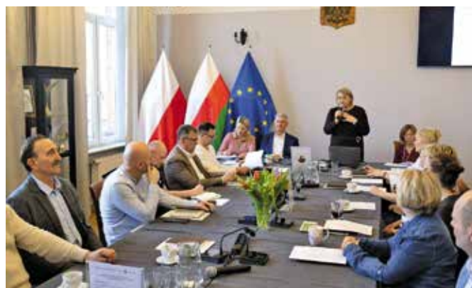
Spotkanie przedstawicieli Samorządu Gminy Wielen z sołtysami i przewodniczącymi zarządów osiedli. Wielen. 18.02.2026 r.