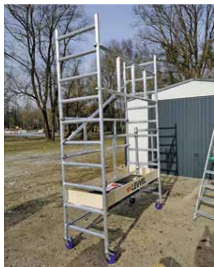
Wypożyczenie warsztatów CIS - nowe rusztowanie dla zwiększenia bezpieczeństwa prac na wysokościach