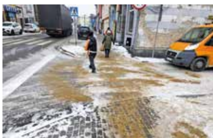
Ręczne posypywanie mieszanką piachu z solą oblodzonych skrzyżowań, przejść dla pieszych i innych ważnych komunikacyjnych miejsc