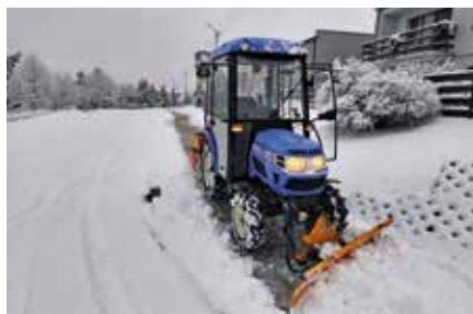
Mechaniczne odśnieżanie i posypywanie piachem wieleńskich chodników odbywało się w styczniu niemal każdego dnia