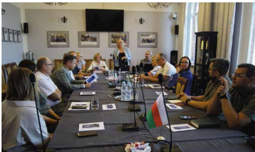
Spotkanie z przedsiębiorcami w ramach prac nad projektem Strategii Rozwoju Gminy Wielen na lata 2025 - 2034

W Urzędzie Miejskim i w Mediatece w Wieleniu, 17 września 2024 roku odbyły się spotkania związane z opracowaniem projektu Strategii Rozwoju Gminy Wielen na lata 2025 – 2034.