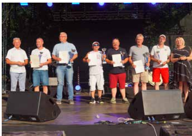
Zwycięcy zawodów wędkarskich o Puchar Burmistrza Wielenia