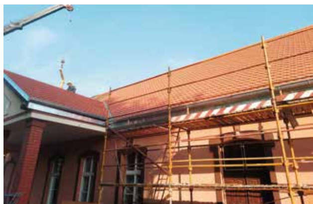
Wymiana pokrycia dachowego na obiekcie OK Strzelnica w Wieleń

W miesiącu kwietniu br. podpisana została umowa na realizację prac pn. „Przebudowa Ośrodka Kultury Strzelnica w Wieleń” (I etap). W ramach realizowanych prac wymieniane jest pokrycie dachowe wieleńskiej Strzelnicy oraz realizowane są prace związane z dachem obiektu, w tym: