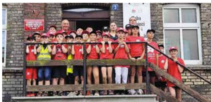
Młodzieżowa Drużyna Pożarnicza w Wieleniu. 10.08.2024 r.

W pierwszej części, wyeksponowano toporki kamienne, które na terenach Ziemi Wieleńskiej pozostawili po sobie przedstawiciele bardzo starej kultury Pucharów Lejkowatych z okresu od 3700 p.n.e do 1900 p.n.e. W drugiej części wystawy zwiedzający mogą zobaczyć popielnice (urny ceramiczne) z epoki brązu, pozostałości Kultury Łużyckiej, której przedstawiciele żyli na terenie Ziemi Wieleńskiej w okresie od 1300 p.n.e. do 400 p.n.e.