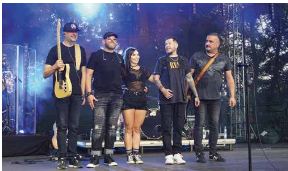
Koncert zespołu NADMIAR 20.07.2024 w Wieleniu

W dniach 20-21 lipca 2024 roku mieszkańcy Wielenia oraz liczni goście mieli okazję uczestniczyć w Dniach Ziemi Wieleńskiej odbywających się na Korcie Miejskim w Wieleniu. Impreza ta, bogata w atrakcje, przyciągnęła zarówno miłośników muzyki, jak i sportu.