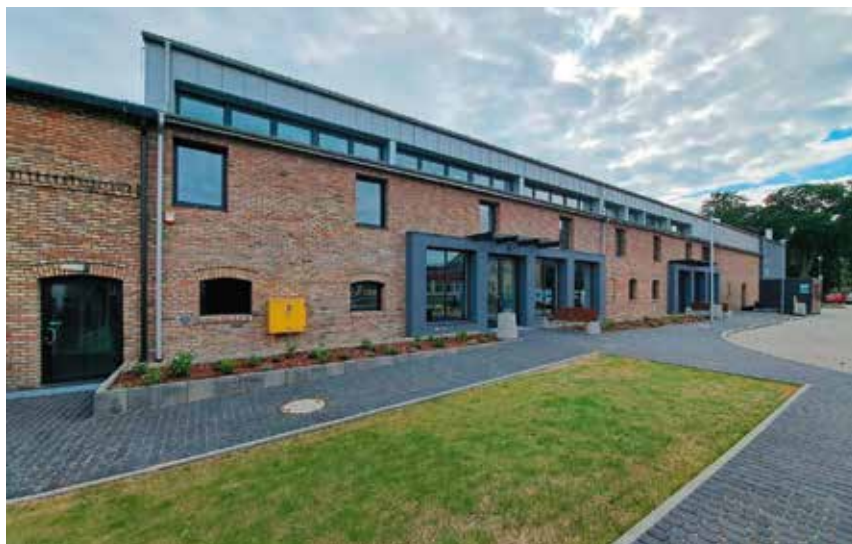
Mediateka w Wieleniu po modernizacji