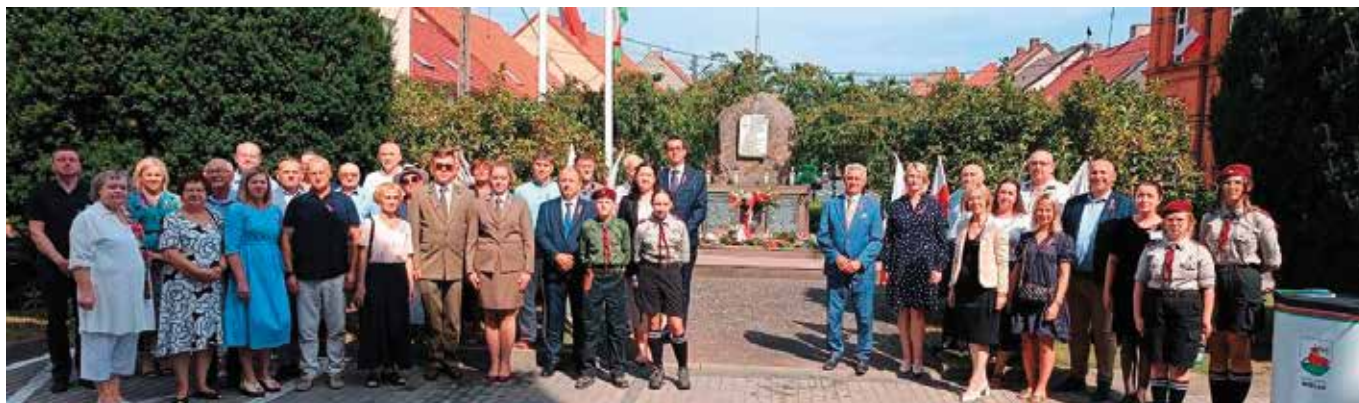
Wielen upamiętnienie 85.rocznicy wybuchu II wojny światowej przy Tablicy Pamięci

Podczas uroczystości patriotycznej podkreślano także Dzień Solidarności i Wolności, upamiętniający 44. rocznicę narodzin Niezależnego Samorządowego Związku Zawodowego „Solidarność.” Ten moment w dziejach naszego narodu, to początek drogi ku odzyskaniu suwerenności, wolności oraz samorządności.