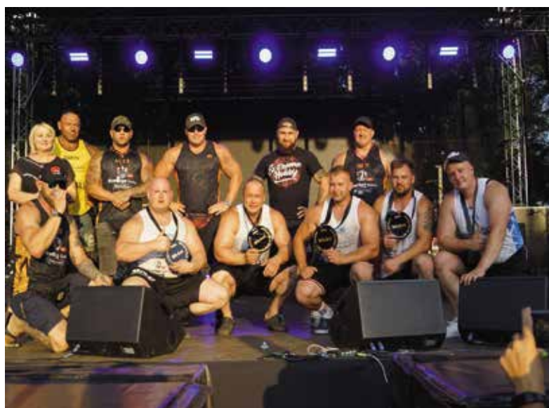
Wręczenie medali w Pucharze Wielkopolski Strongman 21.07.2024 w Wieleniu