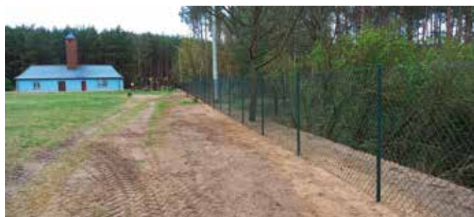
Ogrodzenie terenu rekreacyjnego w Nowych Dworach

W Miałach przeprowadzono drugi etap prac dotyczących budowy chodnika na ul. Nowej i Krętej. W ramach robót wykonano chodnika na odcinku o długości 107 mb. (chodnik o powierzchni 120,00 m 2 oraz wjazdy o powierzchni 33,00 m 2 . Część prac realizowano z użyciem wcześniej zakupionego materiału. Łączna wartość