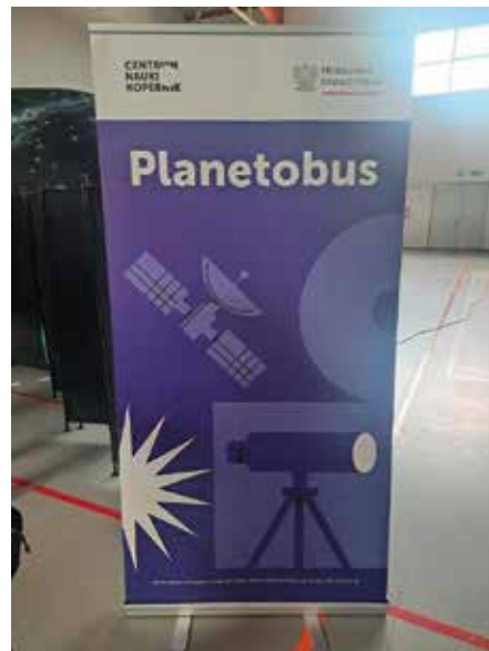
27. Piknik Naukowy Polskiego Radia i Centrum Nauki Kopernik – informuje Centrum Nauki Kopernik Dział Promocji i Komunikacji.

Wspólny Program Ministra Nauki oraz Centrum Nauki Kopernik pod nazwą Nauka dla Ciebie finansowany jest w ramach dotacji Ministra Nauki na podstawie umowy z dnia 23 października 2023 r. Nr MEiN/2023/DPI/3079. W roku 2024 w ramach Programu Nauka dla Ciebie realizowane są działania „Naukobus”, „Planetobus”, „O matmo!” oraz