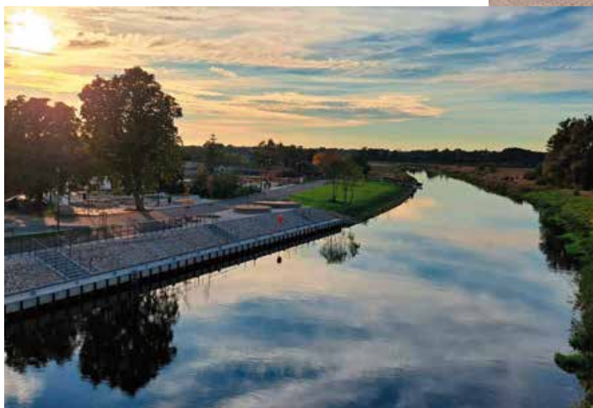
Nadnoteckie Bulwary w Wieleniu po modernizacji

Promocja Gminy Wieleń przez pryzmat pokazywania „dobrych praktyk” jest pokłosiem wygranego konkursu, w którym za realizację projektu „Rewitalizacja Wielenia szansą rozwoju gminy” Gmina Wieleń zajęła I miejsce w II edycji plebiscytu „Łączy nas WIELkopolskiE” w kategorii „Łączy nas ... architektura i kultura.” Uroczystość podsumowania plebiscytu z udziałem laureatów i nominowanych oraz zaproszonych gości odbyła się 1 marca 2024 roku w Poznaniu. Projekt został nominowany do plebiscytu za ożywienie miejskiej przestrzeni, nowoczesny design i kompleksową rewitalizację wspierającą aktywność społeczną mieszkańców. Projekt pn.: Rewitalizacja szansą rozwoju gminy Wieleń, zwyciężył w głosowaniu internautów. Głosowanie odbywało się od 23 października do 13 listopada 2023 r. Galę wręczenia nagród połączono z 20-leciem uczestnictwa Polski w strukturach Unii Europejskiej.