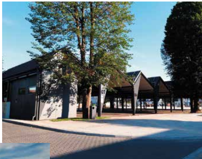
Nowe Miasto na Nowo - plac targowy

W sierpniowym wydaniu nr 8 (279) magazynu Samorządu Województwa Wielkopolskiego „Monitor Wielkopolski” opublikowano materiał dotyczący promocji funduszy europejskich dla regionu, z przywołaniem wieleńskiej rewitalizacji jako przykładu zrewitalizowanej przestrzeni miasta, które czeka na turystów. Atrakcji województwa jest dużo w każdej części Wielkopolski, jednak podczas wyprawy na północ nie sposób ominąć Wielenia-