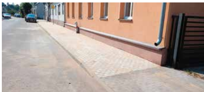
Ulica Błonie w Wieleńiu po pracach chodnikowych