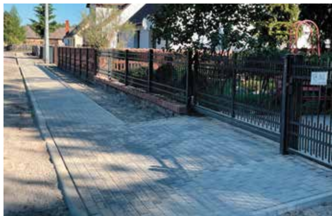
Wybudowany odcinek chodnika w Miałach