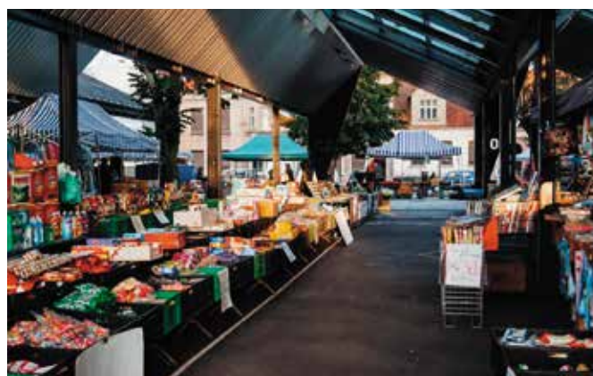
Targowisko - stoiska handlowe

Nagrodę dedykujemy mieszkańcom, to dzięki ich głosom Rewitalizacja Wielenia została doceniona przez Kapitułę Konkursu. Jesteśmy dumni z efektów tej ciężkiej kilkuletniej realizacji czterech największych inwestycji służących przede wszystkim mieszkańcom Gminy Wielen, ale nie tylko. Bulwary Nadnoteckie, Przystanek Edukacja, Nowe Miasto na Nowo wraz z Targowiskiem Miejskim oraz Mediateka z Kinem, Pracowniami Nowoczesnych Technologii wraz z filią Centrum Kopernika SOWA, Centrum Współpracy Pokoleniowej, Centrum Pomocy Rodzinie i kawiarenką pod Klonami - to nowoczesne przestrzenie służące rozwojowi wszystkich grup społecznych.