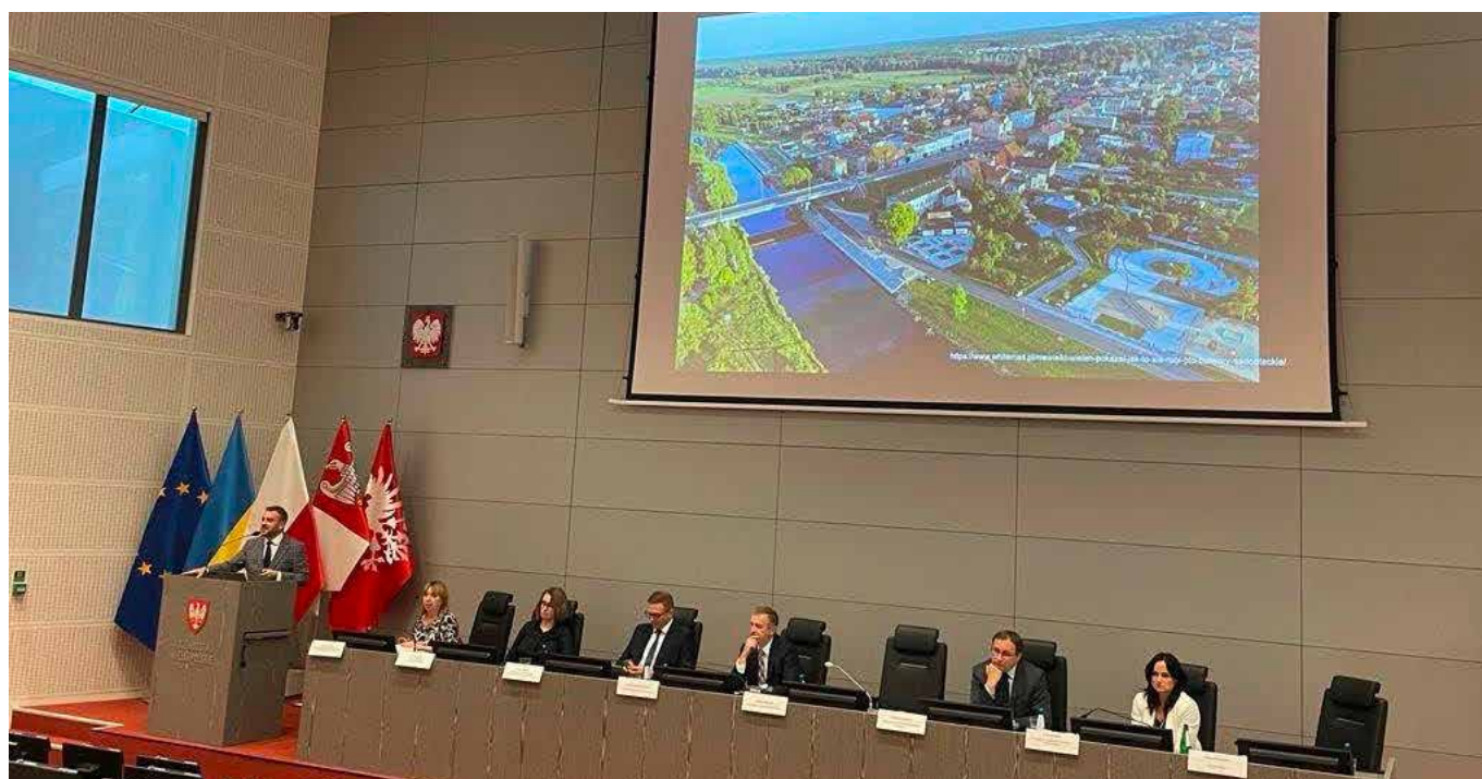
18.09.2024 r. Poznań, Gmina Wieleń jako przykład dobrej praktyki w zakresie rewitalizacji - konferencja otwierająca projekt Regiony Rewitalizacji. Edycja 3.0