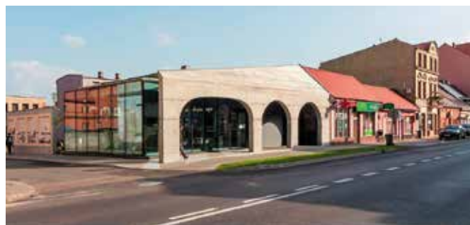
Wielen. Przystanek Edukacja. Fot. Neostudio Architekci