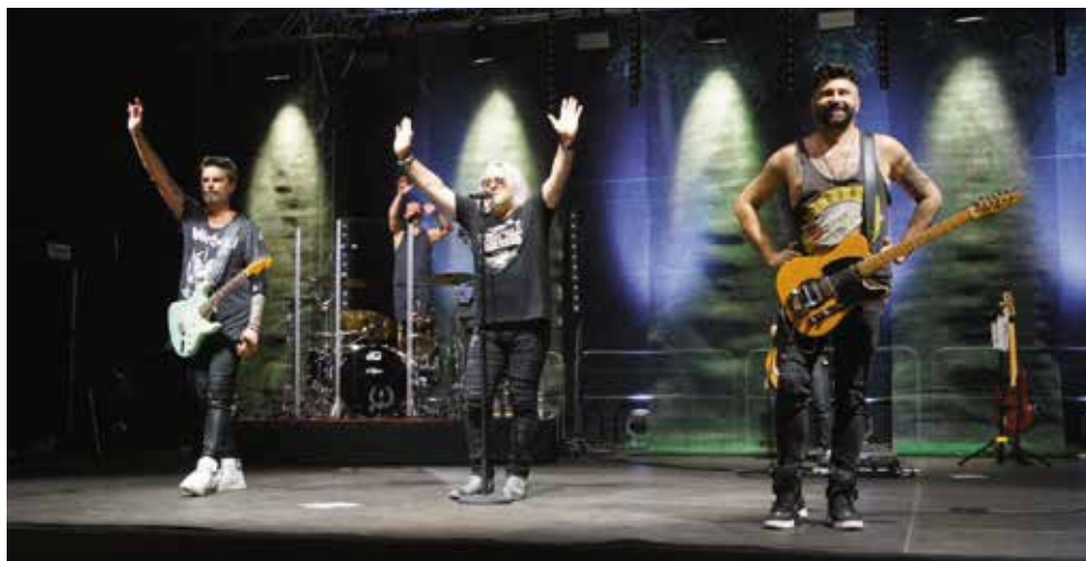
Koncert zespołu IRA 20.07.2024 w Wieleniu