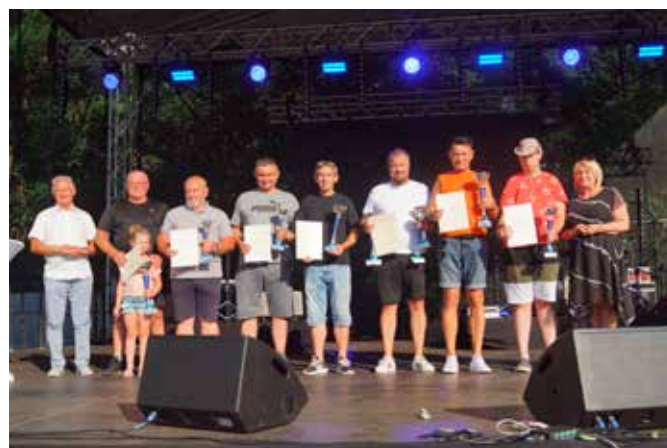
Zwycięcy lotów pucharowych gołębi pocztowych uhonorowani podczas Dni Ziemi Wielińskiej 2024