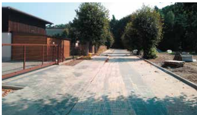
Ulica Wysockiego w trakcie prac brukarskich

Informacja: Referat Techniczno- Inwestycyjny Urzędu Miejskiego w Wieleniu