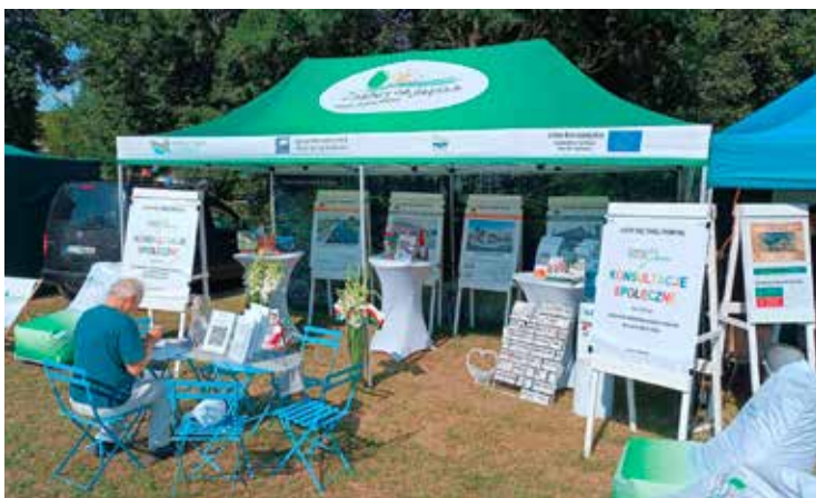
Stoisko promocyjne Urzędu Miejskiego w Wieleniu podczas Dni Ziemi Wielińskiej 2024

Opracowanie: Kacper Ficner Ref. Org. UM Wielen, st. ds. inicjatyw społeczno – kulturalnych