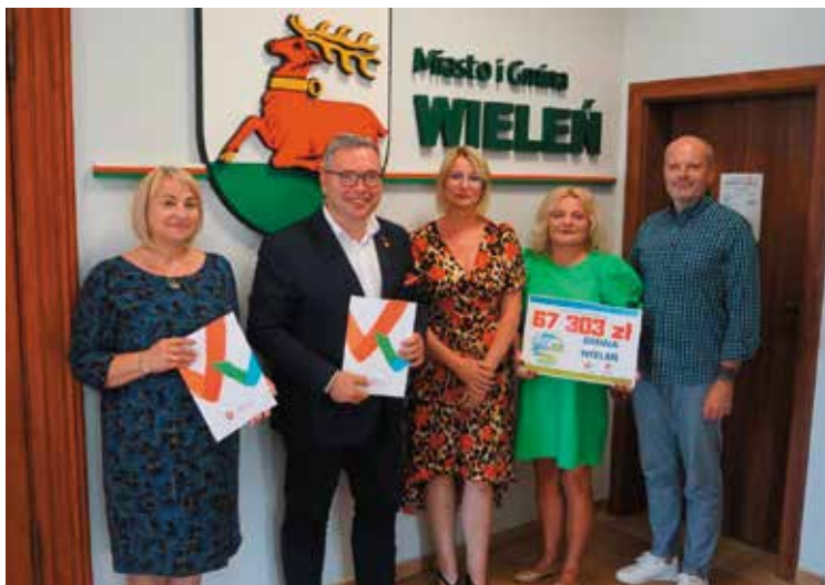
Podpisano umowę na „Błękitno – zielone inicjatywy dla Wielkopolski”