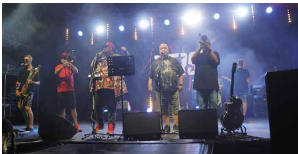
Koncert zespołu PIERSI 21.07.2024 w Wieleniu