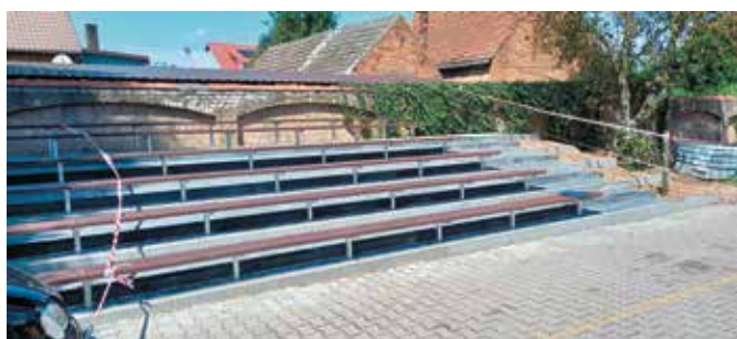
Trybuny przy WDK Rosko w trakcie prowadzenia prac

Przeprowadzono kolejny etap prac dotyczących remontu pokrycia dachowego na obiekcie sali wiejskiej w Zielonowie. Wymienione zostały rynny, rury spustowe, ułożono pokrycie dachowe z blachy trapezowej na powierzchni 50,8 m 2 . Wymienione zostały opierzenia oraz przebudowano kominy. Łącznie wydatkowano na zadanie kwotę 32.138,66 zł, w tym środki Funduszu Sołeckiego: 20.000,00 zł oraz środki gminy: 13.138,66 zł.