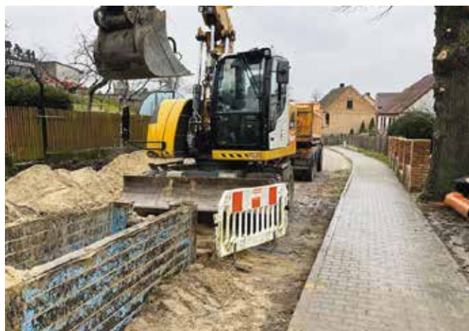
Budowa kanalizacji deszczowej w Rosku

W kolejnym etapie prac, które rozpoczną się w III kwartale br., wykonane zostaną nawierzchnie ulic, chodników oraz ciągów pieszo- jezdnych. Prace drogowe będą realizowane w obrębie ulic: Cmentarnej, Studniowej, Tęczowej, Kwiatowej i Jarzębinowej w Rosku. Ponadto w obrębie ulicy Podgórznej zakres prac realizowany będzie na zasadzie „zaprojektuj i wybuduj” i obejmować będzie zaprojektowanie oraz wykonanie odcinka sieci kanalizacji deszczowej, nawierzchni ulicy, chodnika, miejsc parkingowych przy boisku sportowym. Łącznie wybudowanych zostanie 2,84 km dróg utwardzonych. Wykonane zostaną także doświetlone przejścia dla pieszych. Przebudowa nawierzchni dróg będzie możliwa dzięki środkom zewnętrznym pozyskanym przez Gminę Wieleń w ramach Rządowego Funduszu Polski Łąd: Program Inwestycji Strategicz-