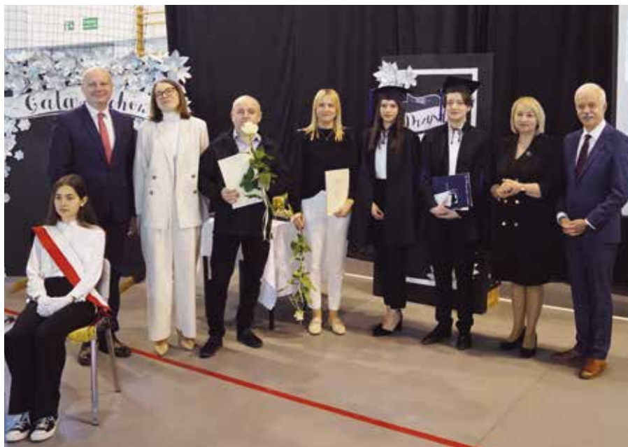
Wręczenie nagród dla najlepszych absolwentów klas maturalnych ZS w Wieleniu

Wręczenia nagród oraz listów gratulacyjnych uczniom oraz rodzicom