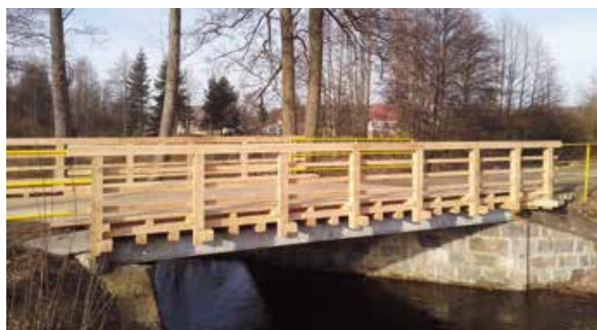
Most na rzece Bukówka w Kuźniczce

modrzewiowe. Prace wykonane zostały przez Zakład Remontowo-Budowlany DROMOST Błażej Fobka z Wielonia. Koszt zrealizowanych robót budowlanych to: 82.262,40 zł.