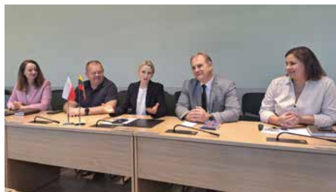
Przedstawiciele Rejonu Alytus w trakcie rozmów o możliwości podjęcia współpracy z Gminą Wieleń