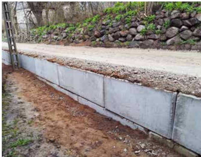
Odcinek ul. Karpackiej w Gulczu - po naprawie

W okresie wiosennym przeprowadzono prace związane z poprawą przejezdności dróg o nawierzchni gruntowej. Nawierzchnie gruntowe dróg podlegały profilowaniu wraz z nadaniem od-