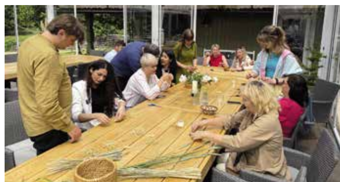
Warsztaty z wyplatania słomianych ozdób