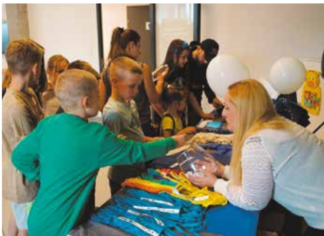
Akcja promocyjno - informacyjna w wieleńskiej Mediatece, 10.05.2024 r. Dzień Otwartych Funduszy Europejskich

Koordynatorem Dni Otwartych było Ministerstwo Funduszy i Polityki Regionalnej przy wsparciu Urzędu Marszałkowskiego Województwa Wielkopolskiego oraz zaangażowaniu większości instytucji zajmujących się Funduszami Europejskimi w Polsce.