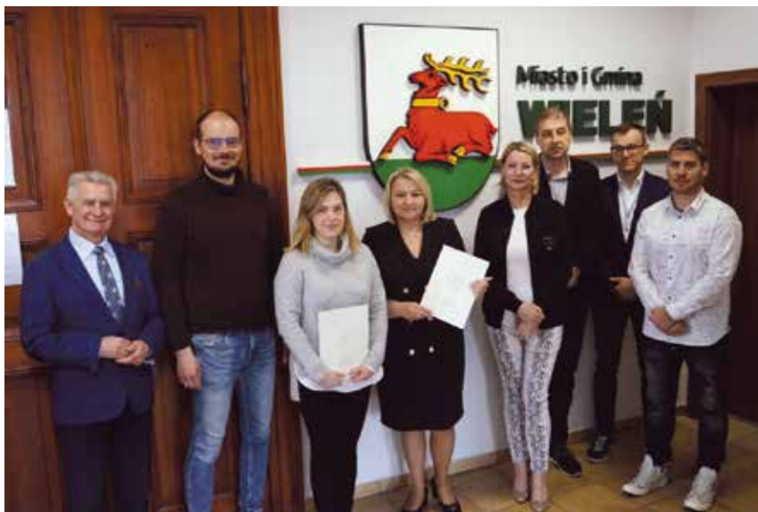
Podpisanie umowy OK Strzelnica - remont dachu

Zakres dotyczący zadania realizowany będzie na bazie wcześniej opracowanej dokumentacji projektowej. Wykonawcą zadania inwestycyjnego będzie Przedsiębiorstwo Budowlane „PEBEROL” Sp. z o.o. z Chodzieży.