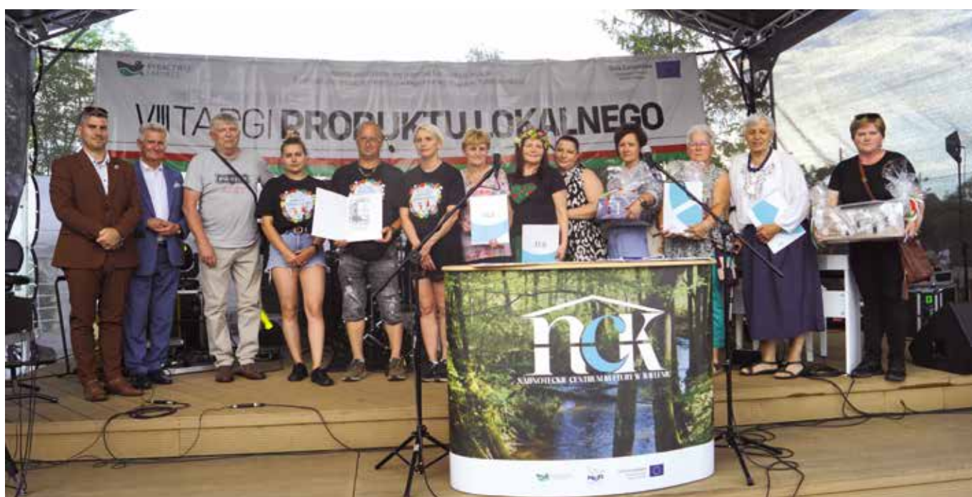
Laureaci konkursu kulinarnego „Dary Lasu”