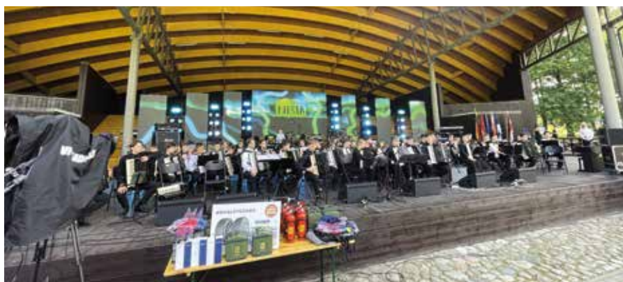
Koncert zespołu akordeonistów w Parku Miejskim w Lazdijai

W drugim dniu uroczystości delegacje samorządów partnerskich zaproszone zostały do wizyty w muzeum upamiętnia-