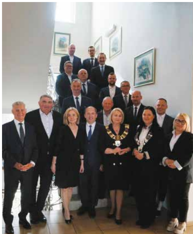
I Sesja Rady Miejskiej w Wieleniu, 7.05.2024 r.