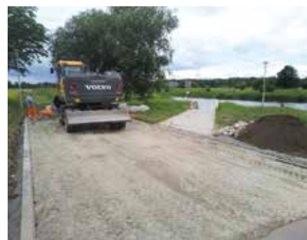
Prace budowlane przy odcinku ciągu pieszo - jezdnego

Przeprowadzenie inwestycji jest możliwe dzięki środkom zewnętrznym pozyskanym przez Gminę Wieleń w ramach poddziałania „Wsparcie na wdrażanie operacji w ramach strategii rozwoju lokalnego kierowanego przez społeczność” w ramach działania „Wsparcie dla rozwoju lokalnego w ramach inicjatywy LEADER” objętego