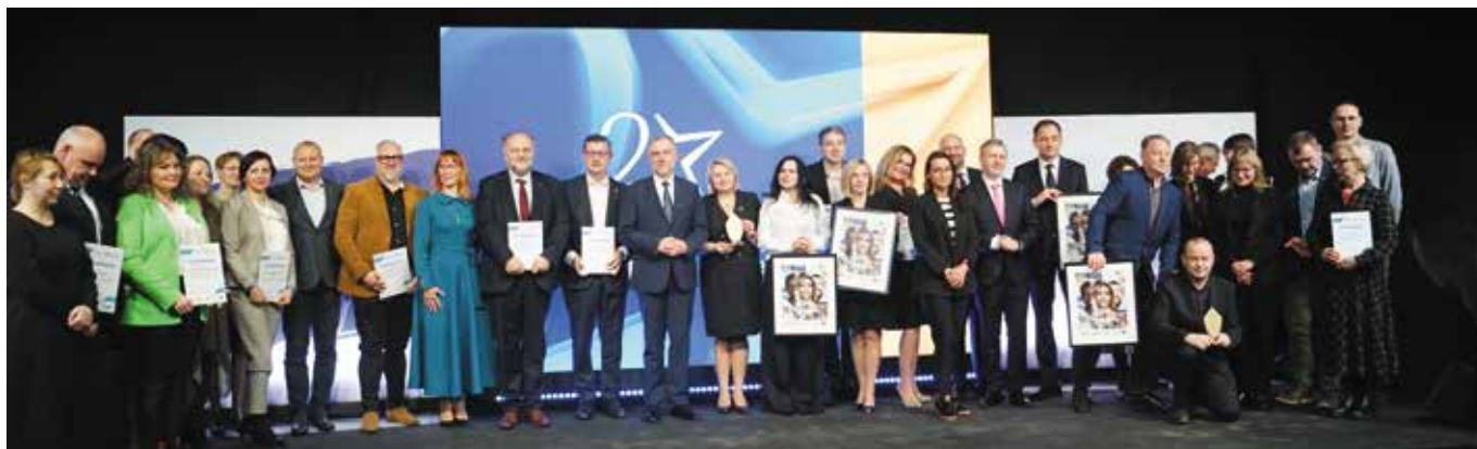
Poznań, 1.03.2024 r. Laureaci plebiscytu oraz nominowani na gali „Łączy nas WIELKOPOLSKIE” (druga edycja)