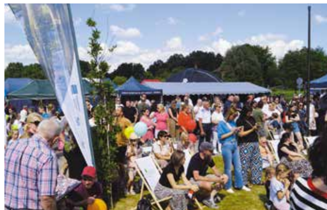
Pogoda sprzyjała aktywnemu wypoczynkowi