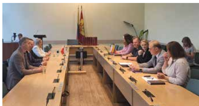
Rozmowy z przedstawicielami Rejonu Alytus