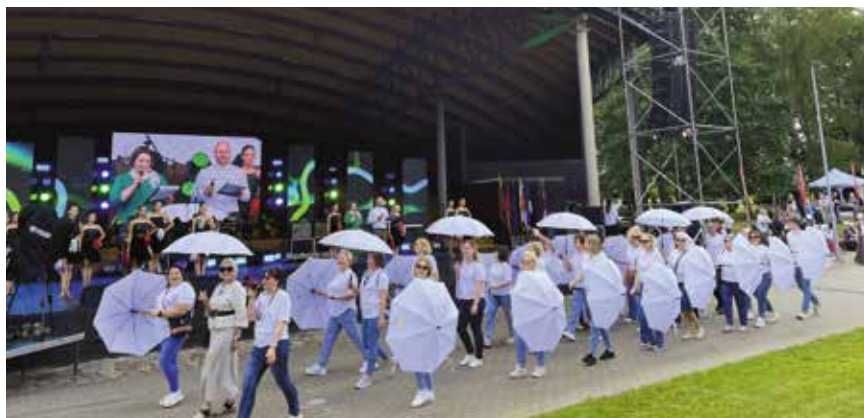
Święto Pogranicza w Lazdijai