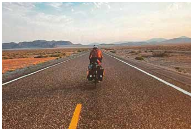
„Na stalowym rumaku w 90 dni dookoła USA” ...

zali również, że pasja to coś, co warto pielęgnować i kultywować. „Warto mieć marzenia, reszta sama przyjdzie” - podsumowali na pożegnanie spotkania z młodzieżą, które odbyło się 14 czerwca 2024 r. w Mediatece. Zapierające dech w piersiach opowieści o wyprawie zostaną nam na długo w pamięci, a my nauczyciele, mamy nadzieję, że z racji zbliżających się wakacji, nasza młodzież również zmotywowała się do zaplanowania swoich podróży, tych bliskich, a może nawet zupełnie odległych. Pięknie jest mieć marzenia, ale jeszcze piękniej jest móc je realizować.