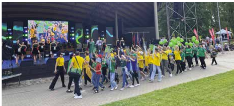
Barwny korowód uczestników tegorocznego Święta Pogranicza w Lazdijai