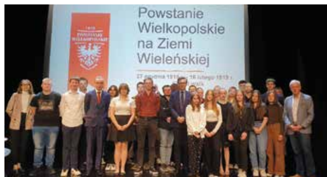
Na scenie w sali kinowej NCK w Wieleniu