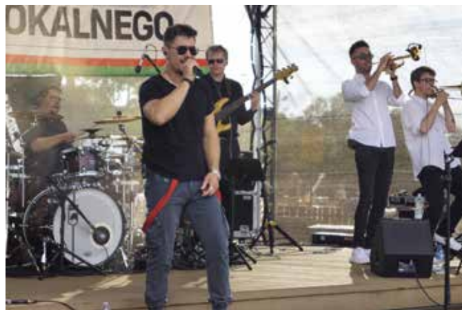
Gwiazdą wieczoru był zespół MITRA z Gdyni

Bulwary Nadnoteckie, które były areną tegorocznych targów, to wyjątkowo urokliwe miejsce, zagospodarowane z dofinansowaniem środków Unii Europejskiej w ramach projektu Rewitalizacji Wieleń. Dzięki tej inwestycji, obszar nad rzeką stał się jednym z najważniejszych punktów rekreacyjnych i turystycznych gminy.