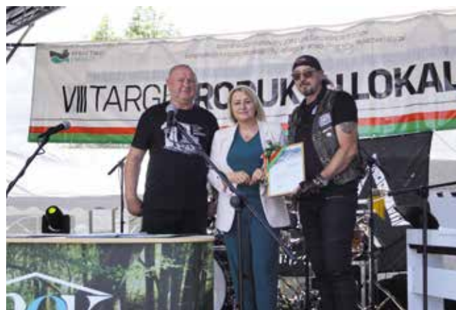
Gratulacje z okazji 10 - lecia PCT Riders

Targi były znakomitą okazją do promocji walorów turystycznych gminy. Zwiedzający mogli degustować regionalne specjały, podziwiać rękodzieło oraz dowiedzieć się więcej o lokalnych inicjatywach i projektach. Uczestnicy mieli również okazję wziąć udział w warsztatach i prezentacjach.