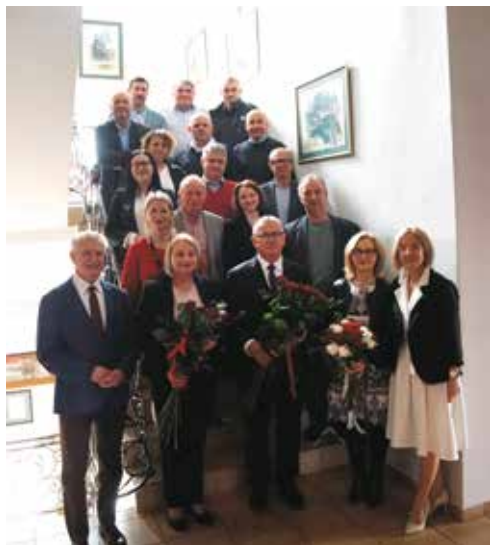
XLIX Sesja Rady Miejskiej w Wieleniu, 24.04.2024 r