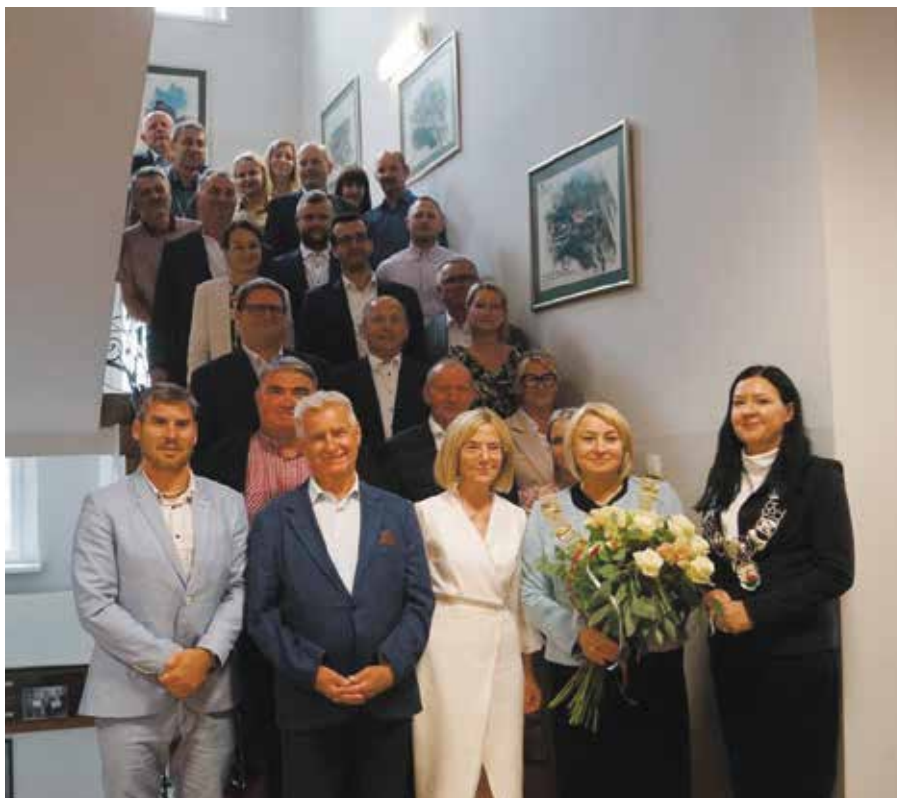
II Sesja Rady Miejskiej w Wieleniu, 19.06.2024 r

wkład własny w zadania z dofinansowaniem zewnętrznym, ale również spłacanie bieżących zobowiązań, przy zachowaniu bezpiecznych dla gminy wskaźników zadłużenia. Aspekty te podkreślone zostały w wystąpieniach związanych z przedstawieniem Raportu o stanie gminy, jak również sprawozdania z wykonania budżetu oraz sprawozdania finansowego. Plan dochodów na 2023 rok wynosił 78 334 741,98 zł i został wykonany w wysokości 73 437 417,57 zł, co stanowi 93,75 % zakładanego planu. Natomiast wydatki zaplanowano w wys. 85 519 658,66 zł, wydatkowano 79 594 820,00 zł, co stanowi 93,07 % zakładanego planu. Budżet zamknął się deficytem w wys. 6 157 402,43 zł. Radnym przedstawiono również pozytywną opinię Regionalnej Izby Obrachunkowej w Poznaniu.