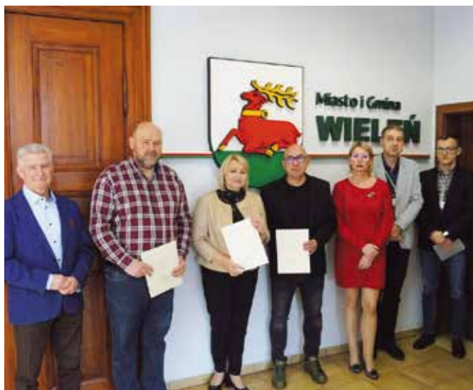
Podpisanie umów na przebudowę i rozbudowę sali wiejskiej we wsi Gulcz

W dniu 27 marca 2024r., po przeprowadzeniu postępowania w trybie podstawowym, podpisano umowę na zadanie pn. „Przebudowa i rozbudowa sali wiejskiej we wsi Gulcz”. Zakres rzeczowy obejmuje zaprojektowanie oraz wykonanie robót budowlanych związanych z przebudową i rozbudową obiektu sali wiejskiej we wsi Gulcz. Zakładany termin realizacji zadania to 18 miesięcy od dnia podpisania umowy. Koszt robót budowlanych: 1.939.000,00 zł brutto, w tym pozyskane dofinansowanie stanowi kwotę: 1.900.220,00 zł (98% kosztów zadania).