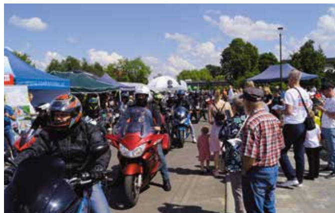
Przejazd pokazowy motocyklistów z PCT Riders

VIII Targi Produktu Lokalnego w Gminie Wieleń pokazały, jak wiele możliwości oferuje ten region. Był to z pewnością czas