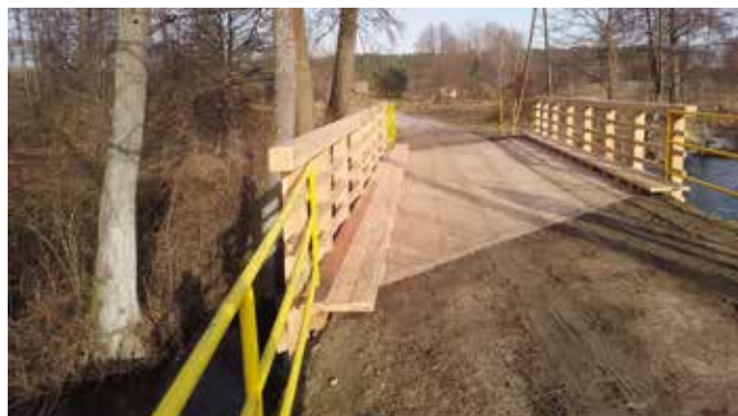
Most w Kuźniczce po pracach remontowych

W styczniu br. wykonano prace związane z kompleksowym remontem mostu drewnianego na rzece Bukówka w Kuźniczce. Stan techniczny mostu spowodował konieczność jego czasowego wyłączenia z użytkowania w roku 2023. Wraz z początkiem roku przystąpiono do prac budowlanych, które obejmowały wymianę elementów drewnianych nawierzchni, podwalin oraz wymianę balustrad drewnianych. Do wykonania prac zastosowano drewno