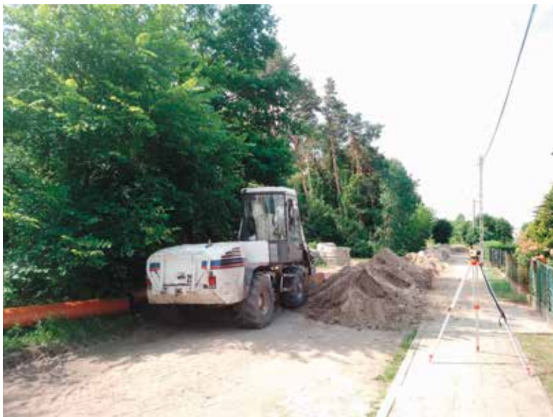
Budowa sieci kanalizacji deszczowej na ulicy Leśnej w Wieleń

W pierwszej kolejności realizowane będą roboty dotyczące budowy sieci kanalizacji deszczowej, które rozpoczęte zostaną od strony ulicy Wysockiego wraz z odcinkiem drogi dojazdowej do ulicy Jana Pawła II przy przepompowni ścieków. Po ułożeniu kolektorów kanalizacji deszczowej wykonawca przystąpi do prac związanych z wykonywaniem podbudowy oraz nawierzchni ulic i chodników. Prace prowadzone będą w obrębie ulic: Leśna, Brzozowa, Ignacego Daszyńskiego, Ludwika Waryńskiego, Piotra Wysockiego, Romualda Traugutta, Zdzisława Orłowskiego oraz Placu Zwycięstwa w Wieleń. Łącznie wykonana zostanie nawierzchnia dróg o długości 1,72 km. Zagospodarowaniu podlegać będzie przestrzeń w obrębie Placu Zwycięstwa.