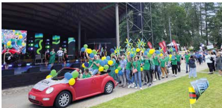
Korowód uczestników Święta Pogranicza