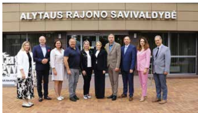
Przedstawiciele Rejonu Alytus i Gminy Wieleń przed urzędem Rejonu Alytus