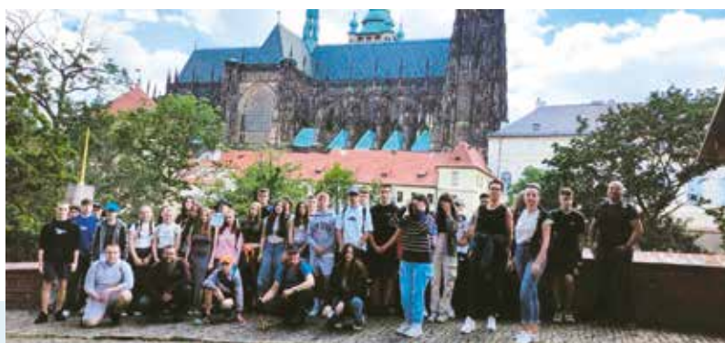
Praga Katedra św. Wita

W dniach 22- 24.05.2024 roku uczniowie klas pierwszych i drugich Zespołu Szkół w Wieleniu brali udział w wycieczce Karpacz-Praga, której celem było poznawanie tradycji, zabytków kultury i historii, upowszechnianie form aktywnego wypoczynku i polepszenia umiejętności pracy w grupie. Uczestnicy wyjazdu zwiedzali kompleks podziemnych korytarzy Sztolni w Kowarach, w których przed laty trwały prace wydobywcze, m. in. uranu i żelaza. W Pradze zapoznali się z wieloma atrakcjami turystycznymi (Zamek