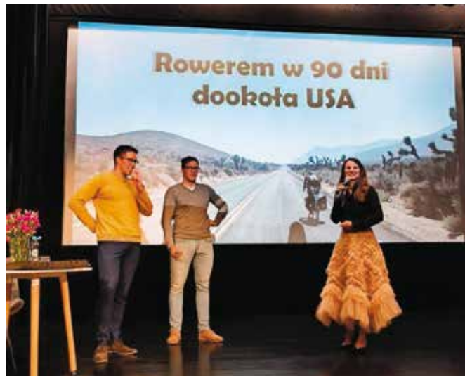
Spotkanie z podróżnikami w wieleńskiej Mediatece, 14.06.2024 r.