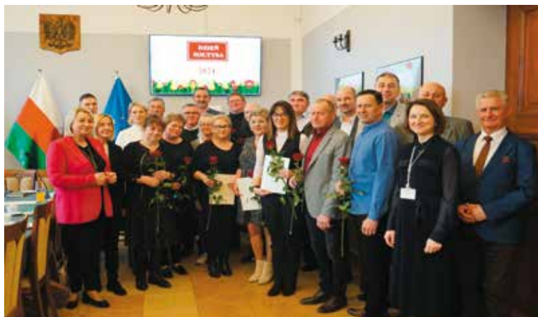
Spotkanie przedstawicieli jednostek pomocniczych gminy na zakończenie VIII kadencji

W Gminie Wieleń pracuje 19 sołtysów i 3 przewodniczących rad osiedli, którzy z roku na rok mają coraz więcej zadań... Sołtys zwołuje zebrania wiejskie, realizuje uchwały Rady Miejskiej dotyczące sołectwa, może uczestniczyć w sesjach i komisjach, zobowiązany jest do ścisłej współpracy z Burmistrzem w ramach wydatkowania środków z Funduszu Sołectkiego, dokonuje pobo-