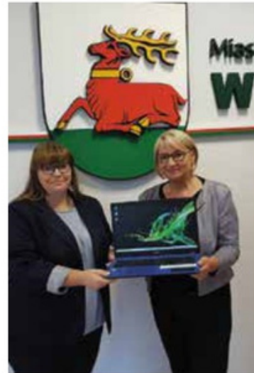
Przekazanie laptopów dla Szkoły Podstawowej w Gulczu