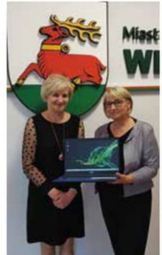
Przekazanie laptopów dla Szkoły Podstawowej w Miałach