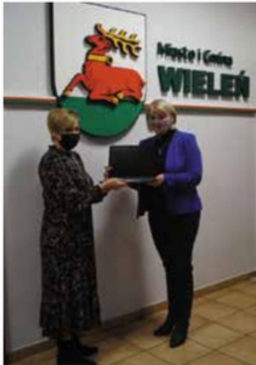
Przekazanie laptopów dla Szkoły Podstawowej Nr 1 w Wielkiu

Gmina Wielki zakupiła 33 nowe laptopy dzięki pozyskaniu przez samorząd kwoty 94.737,06 złotych dofinansowania w ramach programu „Zdalna Szkoła+” finansowanego ze środków Europejskiego Funduszu Rozwoju Regionalnego w ramach Programu Operacyjnego Polska Cyfrowa na lata 2014-2020. W zakresie zrealizowanego dofinansowania Szkoła Podstawowa Nr 1 w Wielkiu otrzymała 9 laptopów, Szkoła Podstawowa Nr 2 w Wielkiu oraz Szkoła Podstawowa w Rosku otrzymały po 7 laptopów, Szkoła Podstawowa w Dzierżążnie Wielkim 4 laptopy, natomiast szkoły podstawowe w Gulczu i Miałach po 3 laptopy.