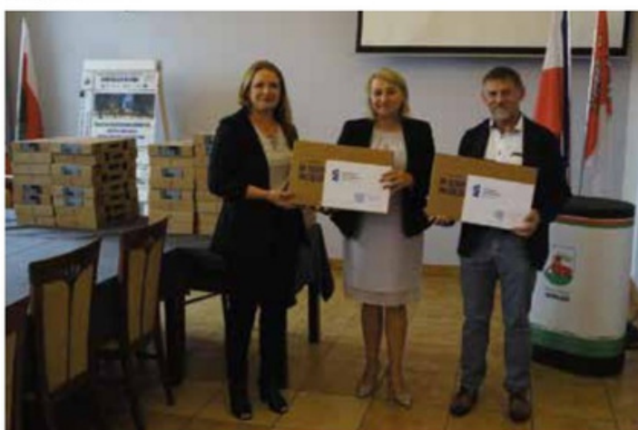
Przekazanie sprzętu komputerowego dla Szkoły Podstawowej w Rosku