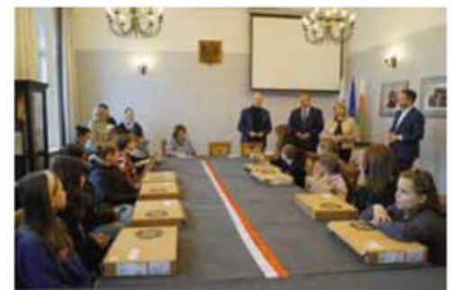
Przekazanie laptopów, tabletów oraz zestawów komputerowych wnukom i prawnukom byłych pracowników zakładów PGR