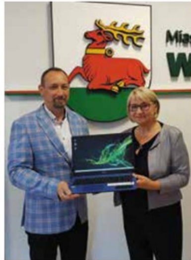
Przekazanie laptopów dla Szkoły Podstawowej Nr 2 w Wielkiu