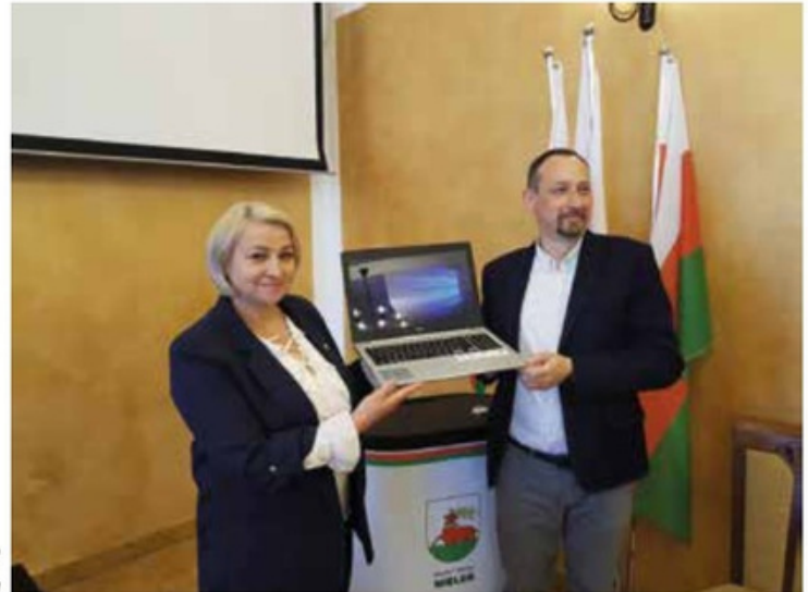
Przekazanie laptopów do Szkoły Podstawowej nr 2 im. Jana Pawła II w Wielkiu

Gmina Wielki zrealizowała grant w wysokości 69.991,92 złotych z Programu Operacyjnego Polska Cyfrowa 2014 - 2020. W ramach realizowanego dofinansowania Szkoła Podstawowa Nr 1 w Wielkiu otrzymała 7 laptopów, Szkoła Podstawowa Nr 2 w Wielkiu otrzymała 7 laptopów, Szkoła Podstawowa w Rosku 6 laptopów, natomiast szkoły podstawowe w Dzierżążnie Wielkim, Gulczu i Miałach po 2 laptopy. Komputery zostały przeznaczone do nauki zdalnej w okresie pandemii.