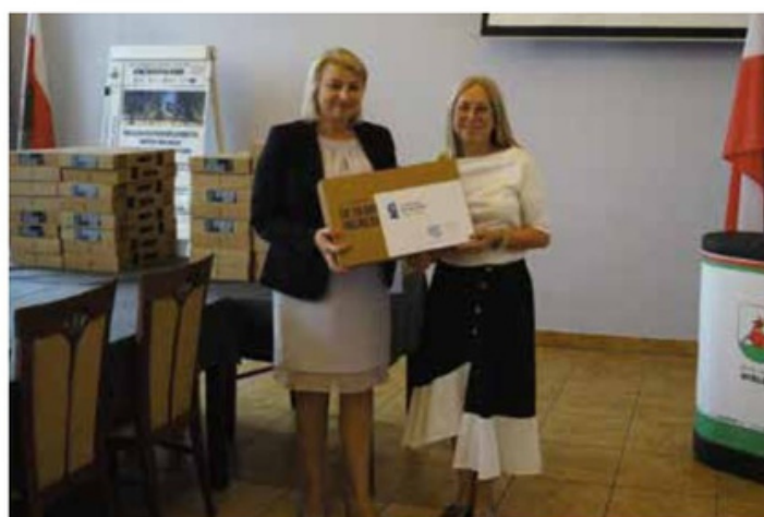
Przekazanie sprzętu komputerowego dla SP w Dzierżążnie Wielkim