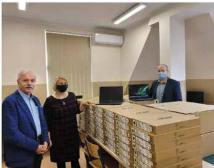
Przekazanie laptopów do Zespołu Szkół w Wieleniu w ramach COVID-19

Gmina Wielki zrealizowała projekt pn. „Wsparcie kształcenia zdalnego w Technikum im. hetmana Stefana Czarnieckiego w Wieleniu” w ramach Wielkopolskiego Regionalnego Programu Operacyjnego 2014 - 2020. Poddziałanie 8.3.1 Kształcenie zawodowe młodzieży - tryb konkursowy oraz tryb nadzwyczajny w zakresie epidemii COVID-19 (nr konkursu: RPWP.08.03.01-IZ.00-30-001/20) w ramach WRPO na lata 2014-2020. W zakresie zrealizowanego zadania zakupiono dla Zespołu Szkół w Wieleniu 76 laptopów oraz 6 zestawów do wideokonferencji. Wartość projektu wyniosła 447.000,00 zł, przy wsparciu środków zewnętrznych w wysokości 379.500,00 zł.