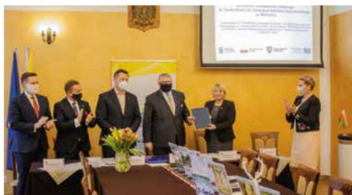
Podpisanie umowy - laptopy do Zespołu Szkół w Wieleniu w ramach Covid-19

Opracowanie: Przemysław Grześkowiak Dyrektor Samorządowej Administracji Oświatowej w Wieleniu Fot. Archiwum SAO Wielki