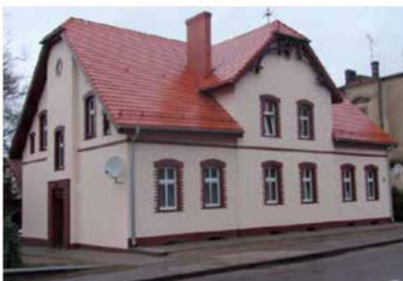
Budynek komunalny przy ul. Staszica 5 w Wieleniu przed i po remoncie. Koszt 317.644,12 zł.