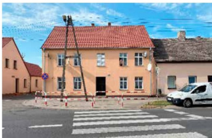
Budynek przy ul. Kościuszki 39 w Wieleniu przed i po remoncie pokrycia dachowego i elewacji