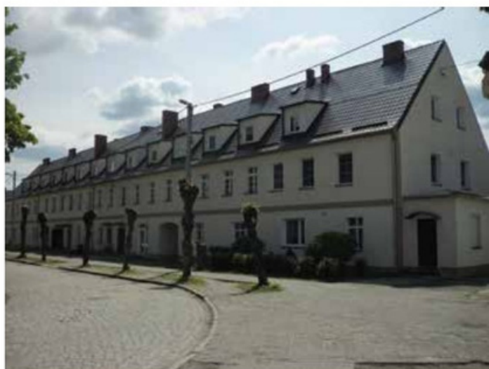
Budynek przy ul. Plac Zwycięstwa 8-10 przed i po remoncie elewacji