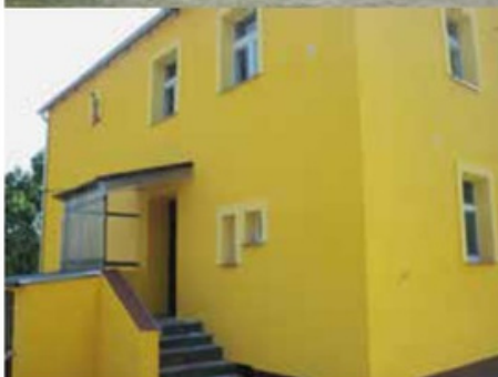
Budynek mieszkalny, Folsztyn 35 przed i po remoncie i dociepleniu elewacji