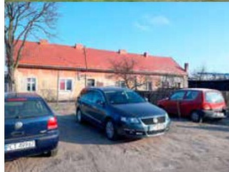
Budynek przy ul. Przemysłowej 5 w Wieleniu przed i po remoncie pokrycia dachowego