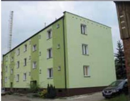
Bloki przy ul. Mężykowskiej 2,3,4 w Miąłach przed i po dociepleniu i remoncie elewacji