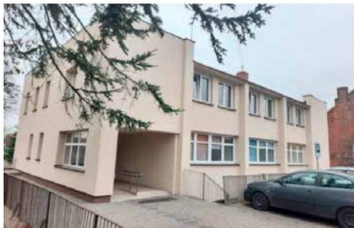
Nowa elewacja Ośrodka Zdrowia w Rosku. Koszt: 90 tys. zł.