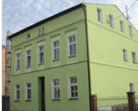
Budynek przy ul. Kościuszki 3 przed i po remoncie