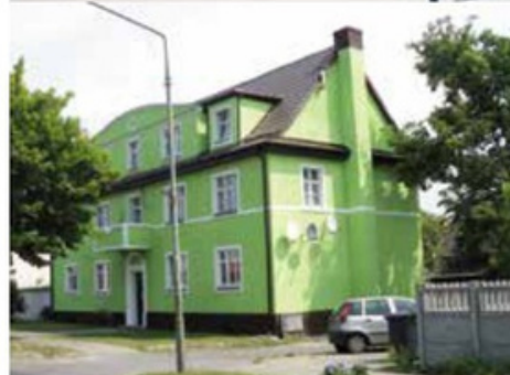
Budynek przy ul. Jana Pawła II 19 przed i po remoncie pokrycia dachowego i elewacji