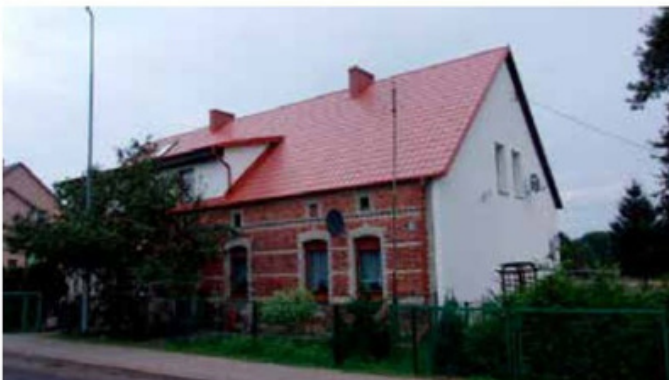
Budynek przy ul. Fabrycznej w Miałach przed i po remoncie pokrycia dachowego