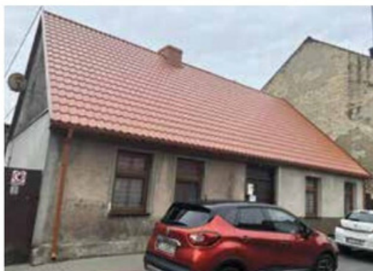
Budynek przy ul. Kasprzaka 10 w Wieleniu w trakcie i po remoncie pokrycia dachowego.