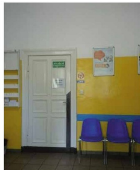
Ośrodek Zdrowia przy ul. Jana Pawła II 27 w Wieleniu oraz remont Ośrodka Zdrowia przy ul. Chopina 7 w Wieleniu. Koszt: 249.318,24 zł.