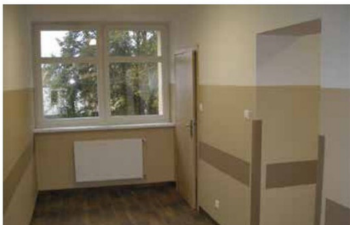
Pomieszczenia Przychodni Zdrowia w Rosku po kompleksowym remoncie. Koszt: 321.523,17 zł.