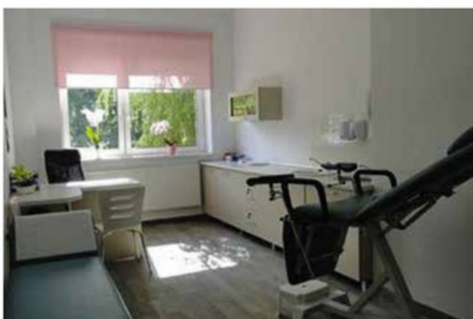
Gabinet położnej środowiskowej i ginekologiczny po remoncie przy ul. Jana Pawła II w Wieleniu. Koszt: ok. 70 tys. zł.