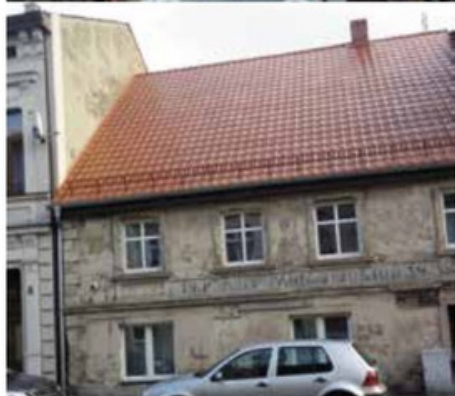
Budynek przy ul. Kościuszki 9 przed i po remoncie pokrycia dachowego