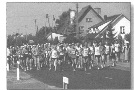
Start do XXXI Masyowego Biegu im. Józefa Nojiego