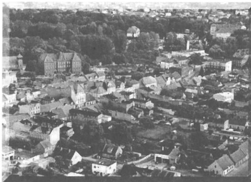
Wieleń – centrum

Kolarstwo górskie jest dynamicznie rozwijającą się dyscypliną sportu. Wpływa na harmonijny rozwój organizmu, wyzwala zdrową rywalizację, a także pozwala cieszyć się pięknem przyrody. Atrakcyjna trasa po pagórkowatym terenie leśnym Puszczy Noteckiej i Puszczy nad Drawą, przebiegająca obok wielu jezior, stała się inspiracją dla stworzenia imprezy rowerowej o charakterze rekreacyjnym, kierowanej w szczególności do amatorów kolarstwa górskiego. Szybko okazało się, że pomysł był trafiony. Kolarstwo górskie, które jest sukcesywnie rozwijane na ziemi wie-