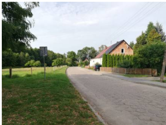
Droga powiatowa przebiegająca przez centrum