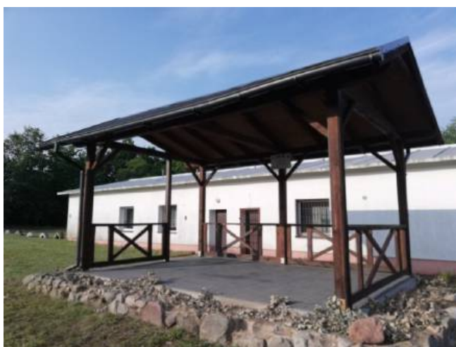
Wiata (scena) na terenie rekreacyjnym