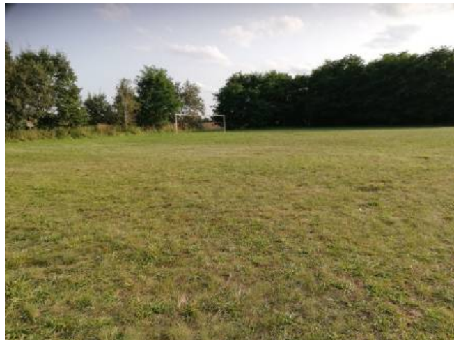
Teren rekreacyjny z boiskiem