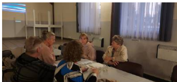
Praca Grupy Odnowy Wsi podczas warsztatów