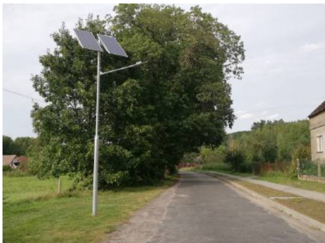
Droga powiatowa prowadząca do miejscowości