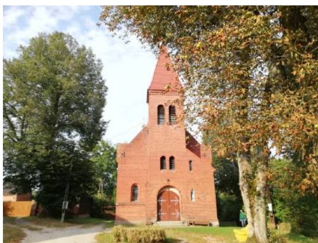
Kościół p.w. MB Wspomożenia Wiernych