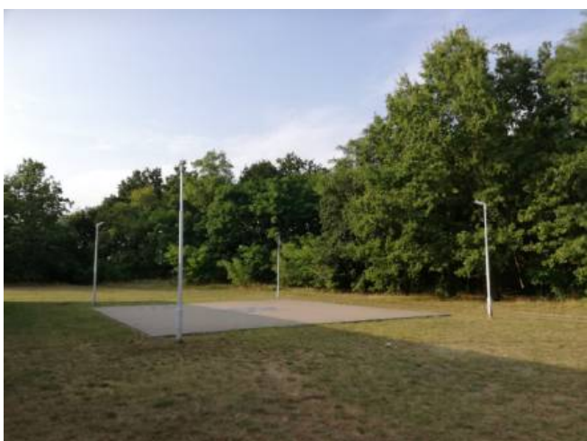
Teren przy świetlicy