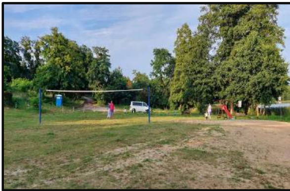
9. Boisko sportowe