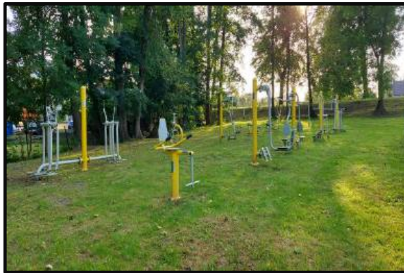
7. Siłownia pod chmurką