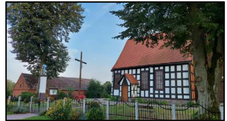
11. Kościół pw. MB Różańcowej w Dzierżążnie Wielkim