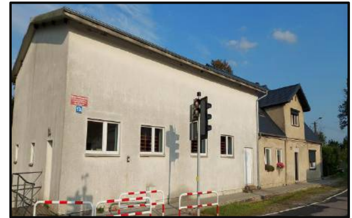
14. Sala gimnastyczna