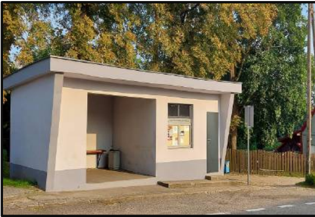
12. Przystanek autobusowy