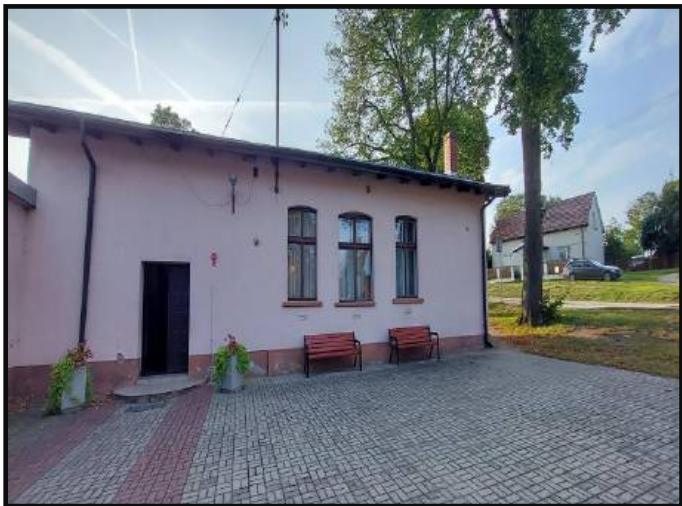
1. Świetlica wiejska – sala wiejska