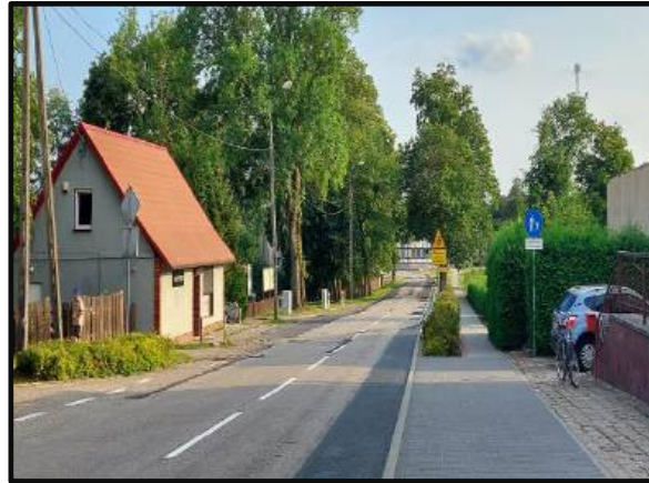
13. Droga wojewódzka nr 177