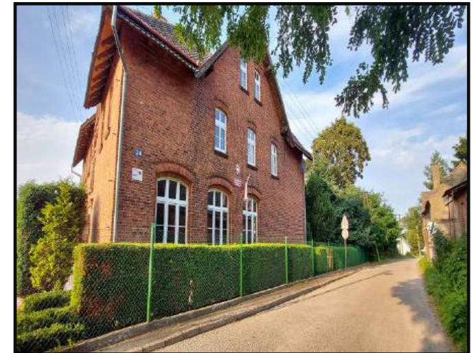
2. Szkoła Podstawowa im. Henryka Sienkiewicza