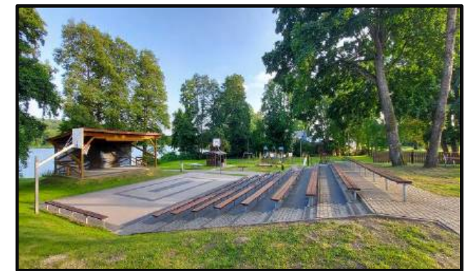
5. Amfiteatr wiejski