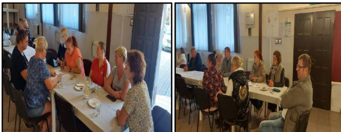
Warsztaty z budowania Sołeckiej Strategii Rozwoju Wsi Sołectwa Dzierżążno Wielkie 3 i 12 września 2024 r.; Dzierżążno Wielkie