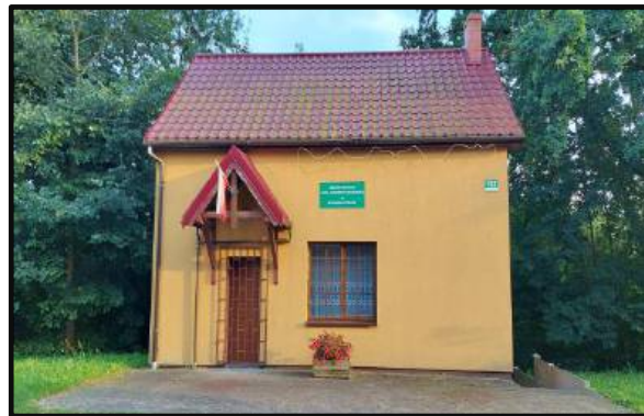
10. Siedziba Kółka Rolniczego