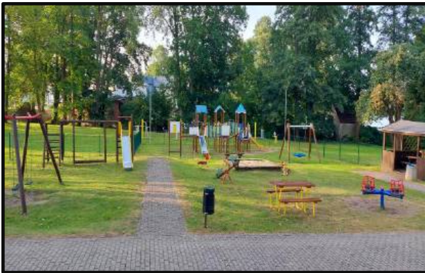
6. Plac zabaw