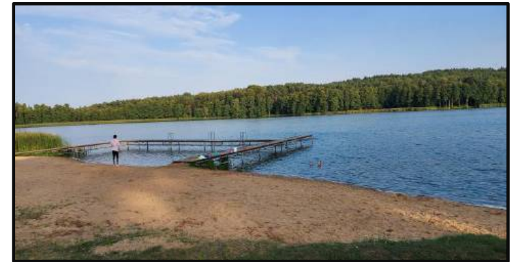
8. Plaża w Dzierżążnie Wielkim