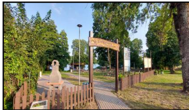
4. Przystanek Dzierżążno