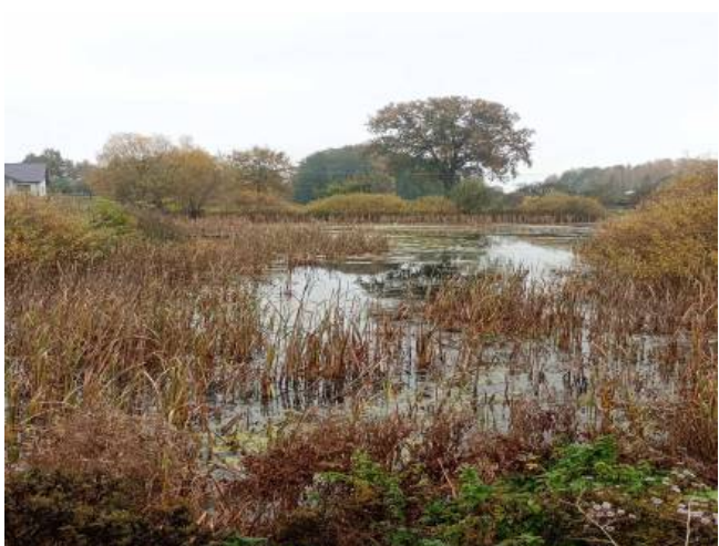
Staw w centrum sołectwa