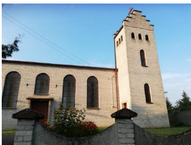
Kościół Podwyższenia Krzyża Świętego