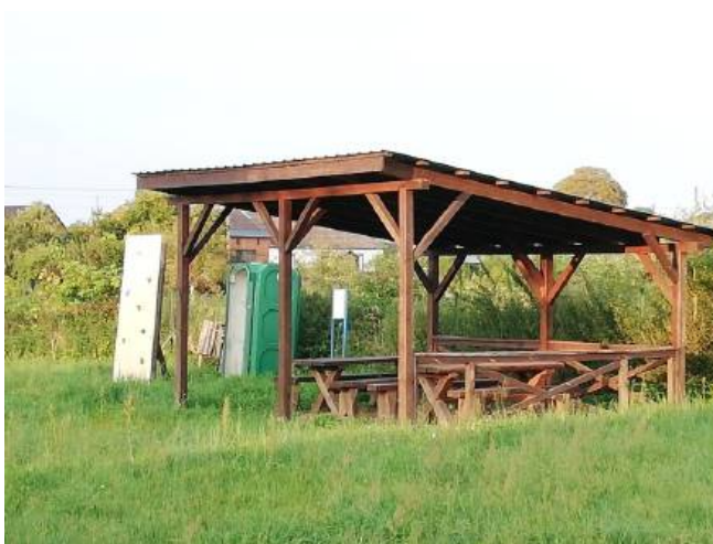
Altana na terenie rekreacyjnym