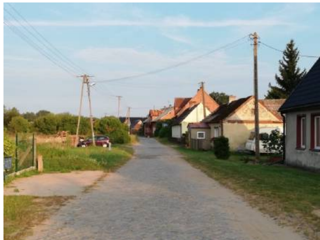
Droga gminna przebiegająca przez centrum