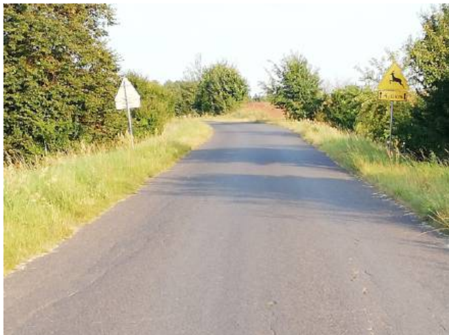
Droga gminna prowadząca do miejscowości