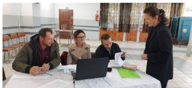
Praca Grupy Odnowy Wsi podczas warsztatów