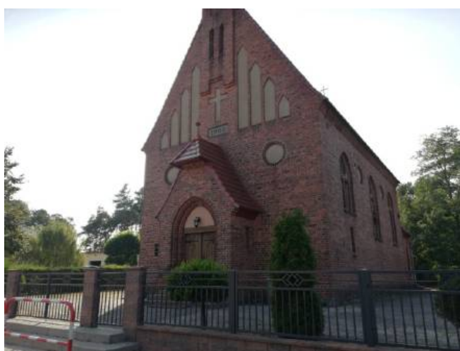
Kościół Rzymskokatolicki pw. św. Antoniego