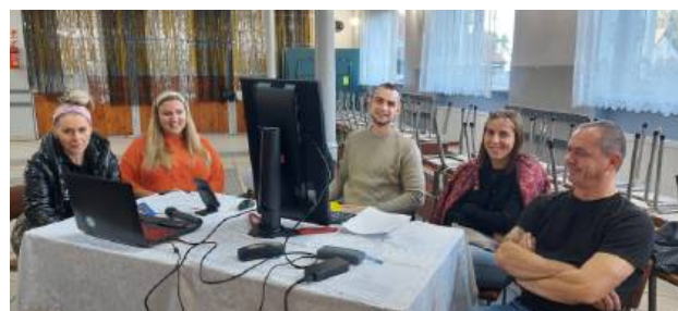
Praca Grupy Odnowy Wsi podczas warsztatów