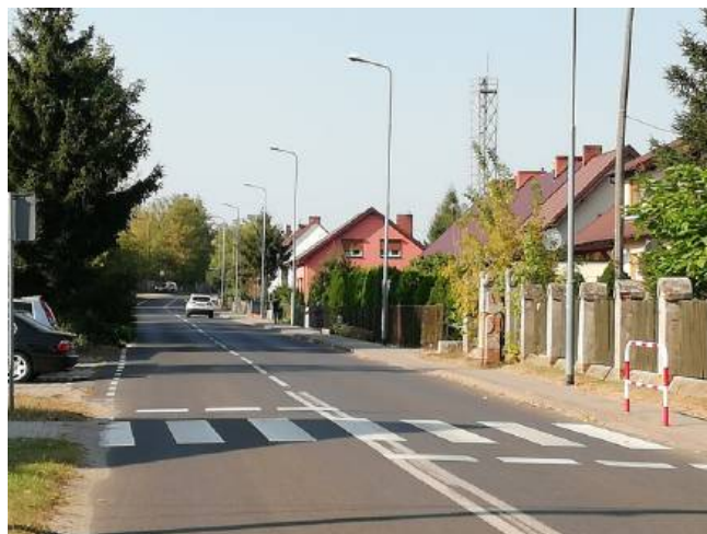
Droga gminna przebiegająca przez centrum