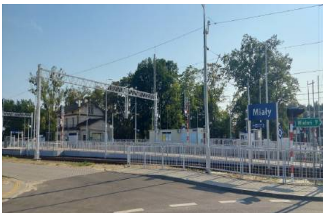
Przystanek PKP w centrum wsi