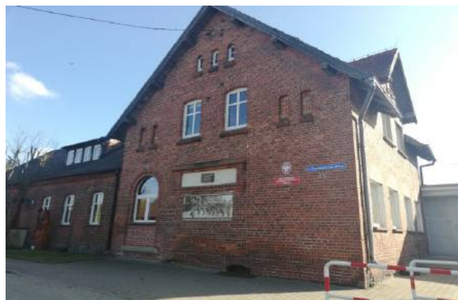
Budynek Szkoły Podstawowej