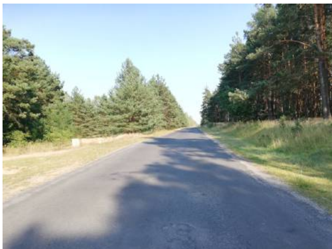
Droga gminna prowadząca do miejscowości