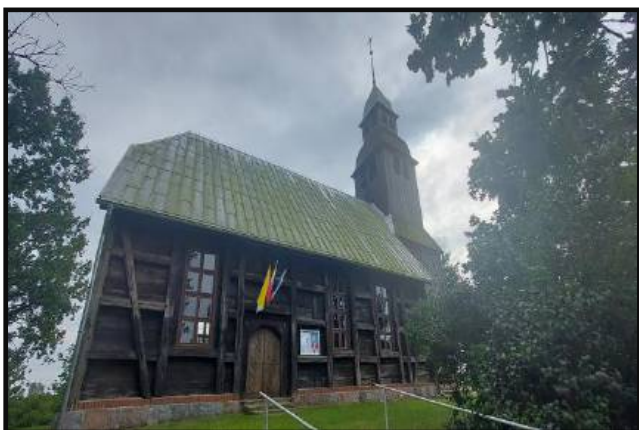
Kościół pw. Narodzenia Św. Jana Chrzciciela