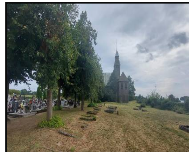
Teren przy zabytkowym kościele