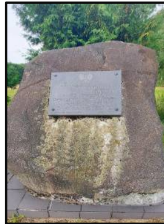
Pamiętkowy obelisk przed salą wiejską (poświęcony 52. rocznicy powrotu do macierzy)