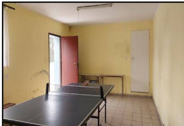
Sala w świetlicy wiejskiej