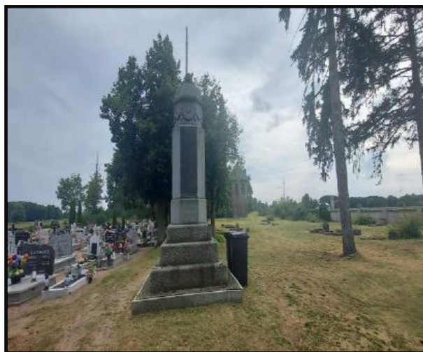
Pomnik ku czci mieszkańców poległych w czasie I wojny światowej