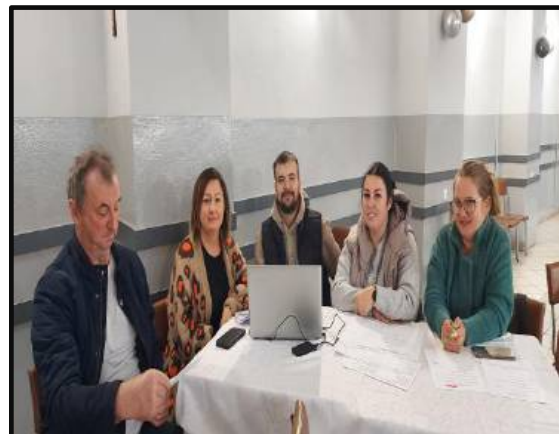
Warsztaty z budowania Sołeckiej Strategii Rozwoju Wsi Sołectwa Nowe Dwory 12 i 16 października 2024 r.; Miały