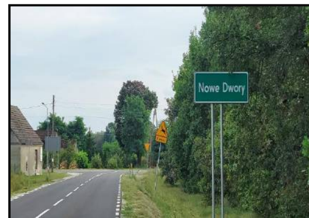
Wjazd do miejscowości