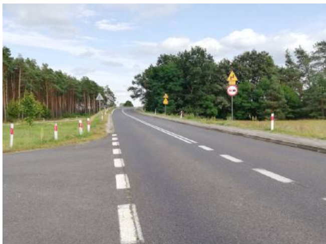
Droga wojewódzka prowadząca do miejscowości