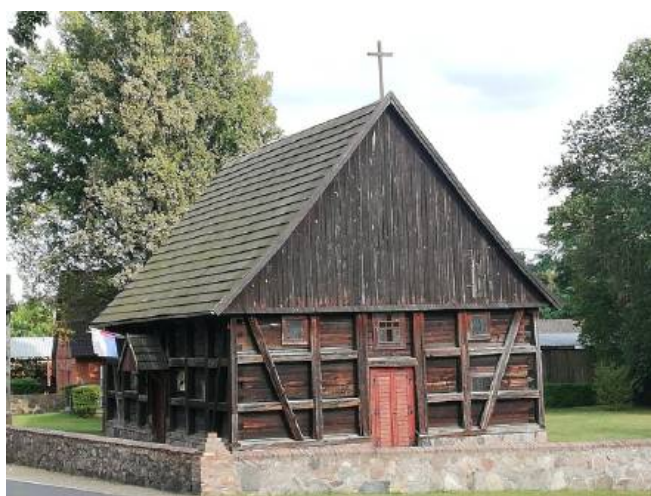
Kościół p.w. MB Siewnej w Herburtowie z 1787 r.