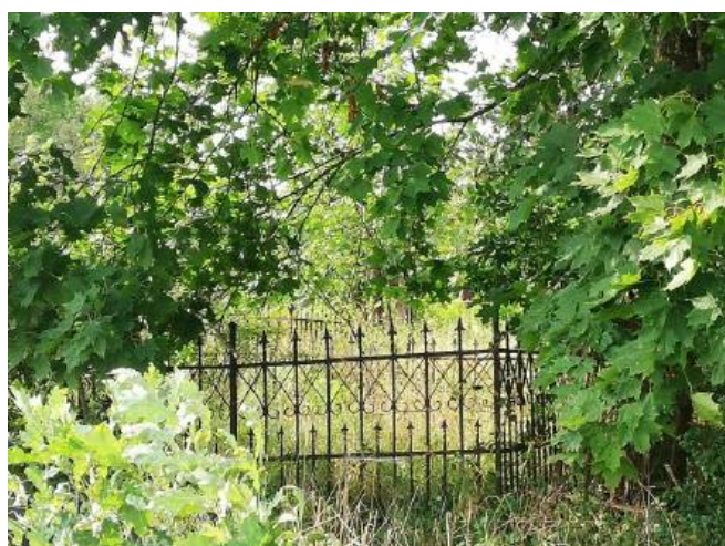
Cmentarz ewangelicko – augsburski z XIX w.