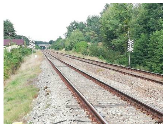
Połączenie kolejowe linii Piła – Krzyż Wlkp.