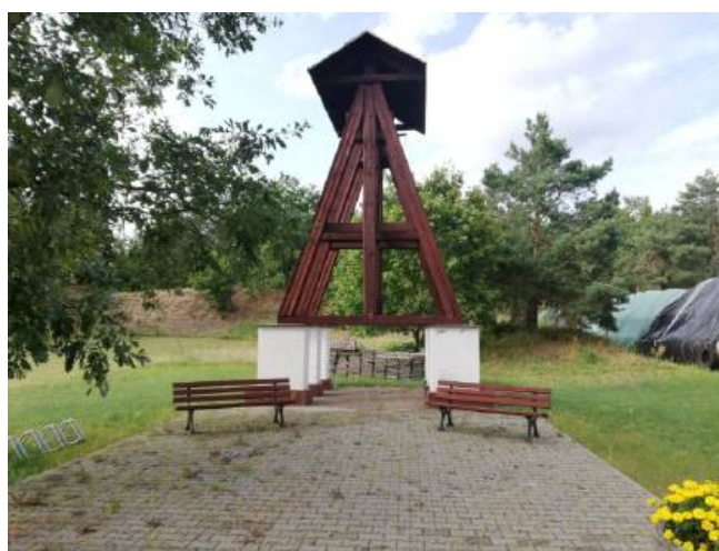
Dzwonnica z pocz. XX w.