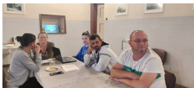
Praca Grupy Odnowy Wsi podczas warsztatów