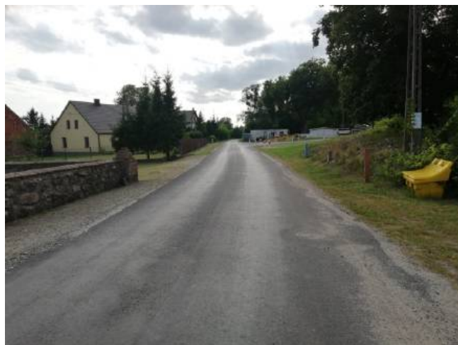
Droga gminna przebiegająca przez centrum