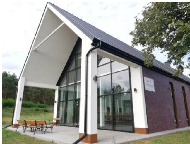
Świetlica wiejska Marianowo - Herbutowo