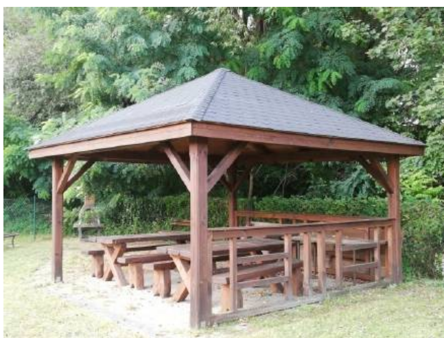
Altana na terenie rekreacyjnym